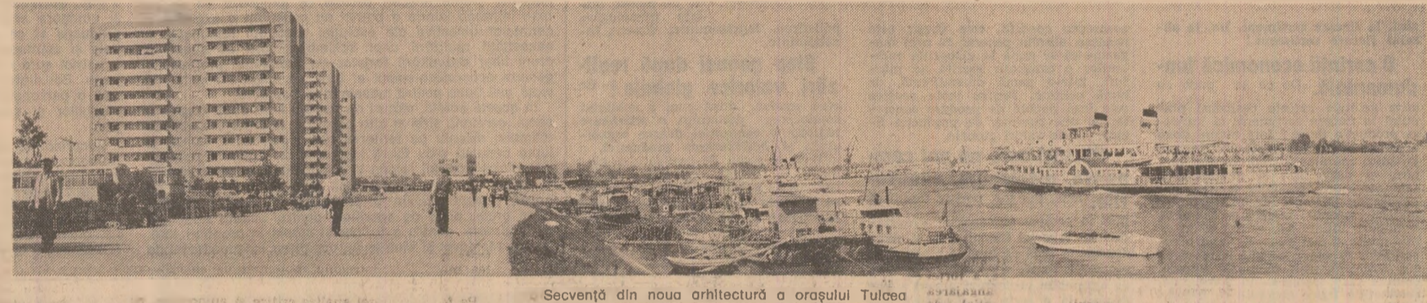
Secvență din noua arhitectură a orașului Tulcea