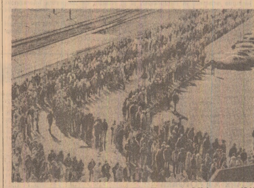
Unul din conflictele sociale în plină desfășurare în S.U.A.: peste 17000 de muncitori de la uzinele aeronautice „Boeing” din Seattle au declarat grevă în sprijinul revendicărilor lor sindicale.

Federația marilor centrale sindicale italiene, la alături apel au fost lansate acțiunile de protest, în vederea organizării în zilele următoare și alte greve de protest pentru a determina guvernului să ia măsuri urgente, în primul rînd pentru reducerea șomajului, deoarece, la ora actuală, peste 1,7 milioane de oameni se află în căutare de locuri de muncă.