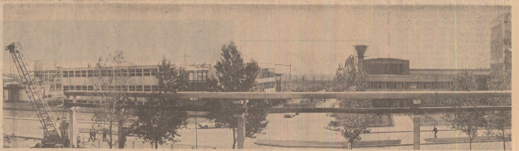
Zona industrială, puternică și modernă, a orașului Buzău