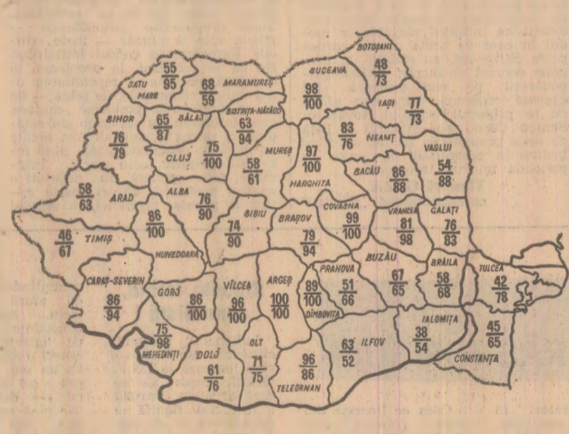
Cifrele înscrise în perimetrul fiecărui județ redau, în procente, suprafețele pe care s-au efectuat arăturile de toamnă în întreprinderile agricole de stat (sus) și în cooperativele agricole (jos) pină ieri, 15 noiembrie

În programul de măsuri privind executarea lucrărilor agricole de toamnă, întocmit de Ministerul Agriculturii și Industriei Alimentare, s-a prevăzut să se facă arăturile adînci pe o suprafață de circa patru milioane de hectare. Din datele centralizate la minister rezultă că pină la 15 noiembrie au fost arate 76 la sută din suprafețele prevăzute în cooperativele agricole și 58 la sută în întreprinderile agricole de stat. Se apreciază că lucrările sint mai avansate față de aceeași perioadă a anului trecut. Cu toate acestea, realizările din unele județe — Ilfov, Iaomița, Arad, Timiș, Mureș, Constanța ș.a. — se situează la un nivel scăzut. Se desprinde deci necesitatea ca organizațiile de partid, comandamentele locale și conducerea unităților agricole să ia măsuri energice în vederea urgentării lucrărilor, astfel încît, așa cum a stabilit comandamentul central, arăturile adînci să se încheie pe toate suprafețele pină ce mai țirziu la 20—22 noiembrie.