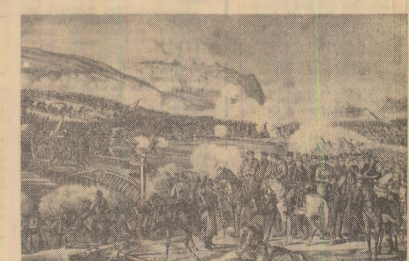
Capitularea oștirii otomane de la Plevna

Războiul pentru independența României din anii 1877-1878 constituie o pagină de glorie în epopeea luptei pentru eliberare națională și socială, a marilor bătălii pe care iluștrii conducători de oaste români — precum Mircea cel Bătrîn, Iancu de Hunedoara, Vlad Tepeș, Ștefan cel Mare, Mihai Viteazul — le-au dus pentru apărarea pămîntului strămoșesc. Această bărbăție în luptă, aceeași dăruire de jertfă, aceeași rîdicare a armei a tuturor s-au înlînit mereu de-a lungul acestor veacuri de înclăștră apărării, din expresie aceleiași voințe a poporului român de a trăi liber, de a fi el însuși stăpîn al destinelor sale.