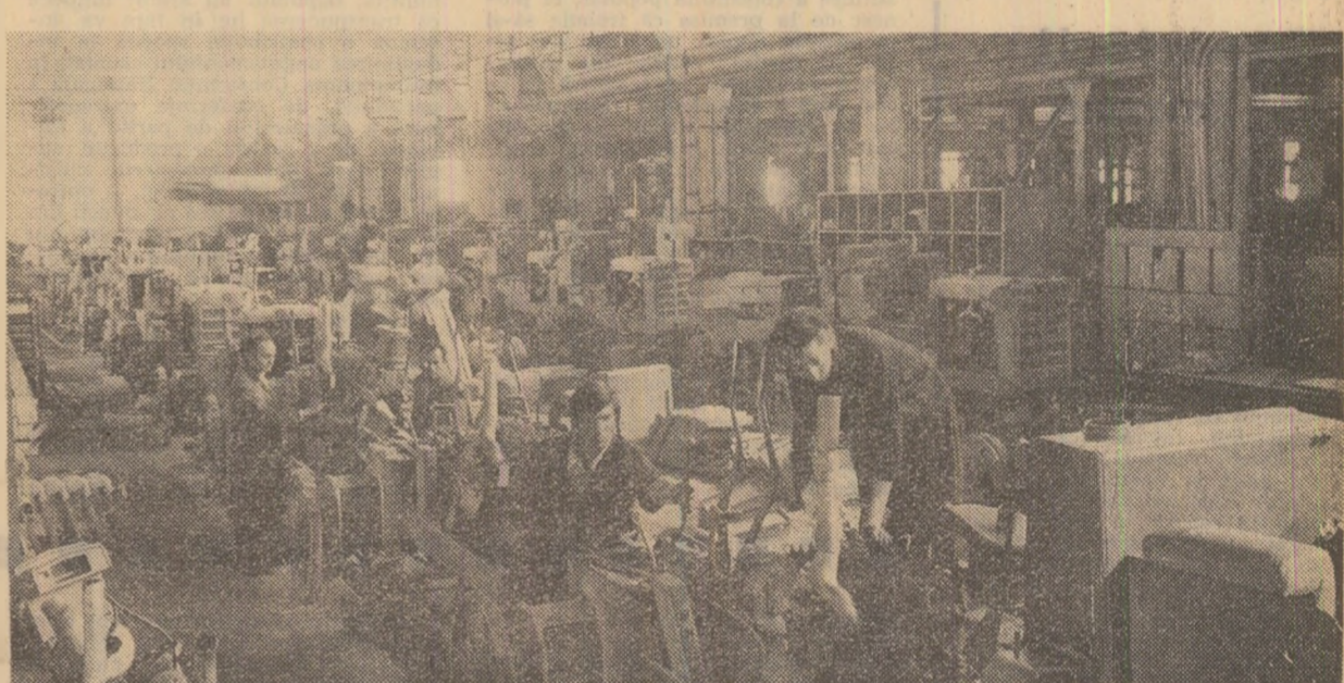
Întreprinderea de tractoare pe șenile din Miercurea Ciuc: aspect din secția montaj

În timpul întrevederii s-a procedat la un schimb de vederi asupra stadiului și perspectivelor relațiilor economice româno-israeliene, precum și asupra unor probleme actuale ale vieții internaționale, în special referitor la situația din Orientul Mijlociu. Întrevedere s-a desfășurat într-o atmosferă cordială.