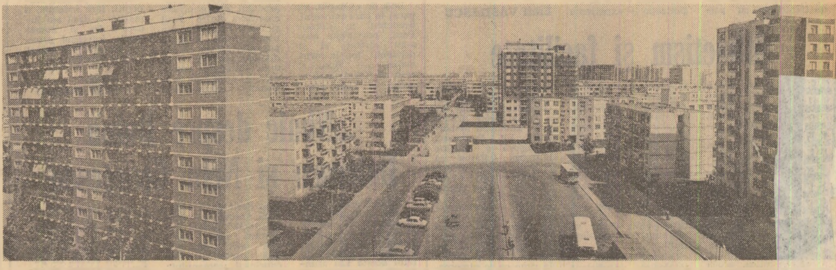
Chipul nou al orașelor României socialiste. În fotografie: Cel mai tînăr cartier al Galațiului — „Dunărea“ — construit în actualul cincinual.

● Prin măsurile luate recent de conducerea partidului s-a generalizat sistemul de pensii, urmînd ca de la 1 ianuarie 1978 să primească pensii și tîrînii cu gospodării individuale din zonele necooperativizate. Față de anul 1975, venitul mediu lunar al tîrînii cooperativizate va crește cu 19 la sută în anul 1980.