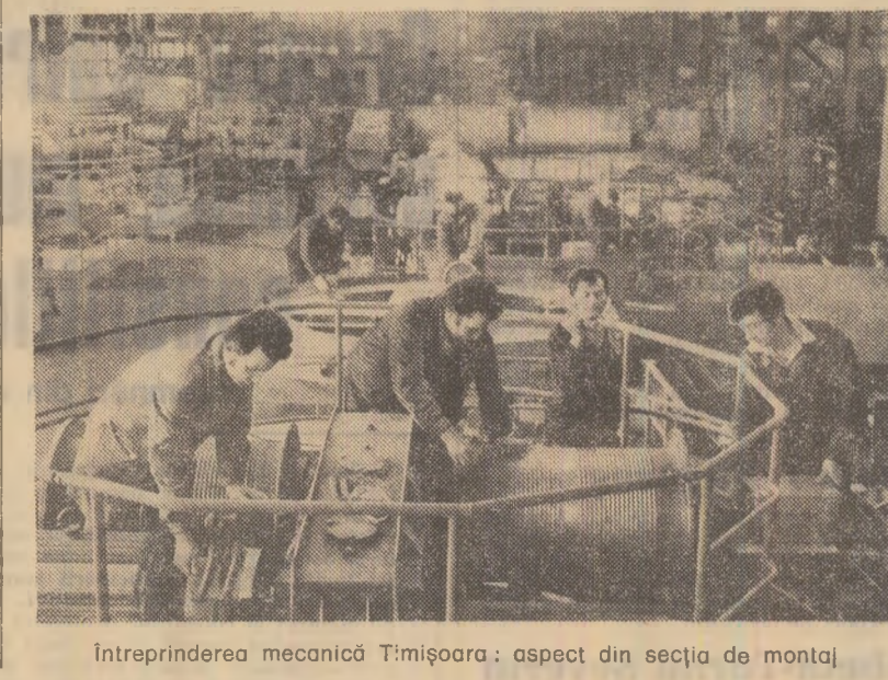
Întreprinderea mecanică Timișoara: aspect din secția de montaj