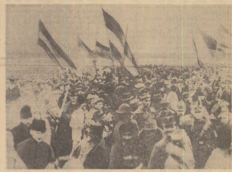
Alba Iulia — 1 decembrie 1918. Secevență de la adunarea populară