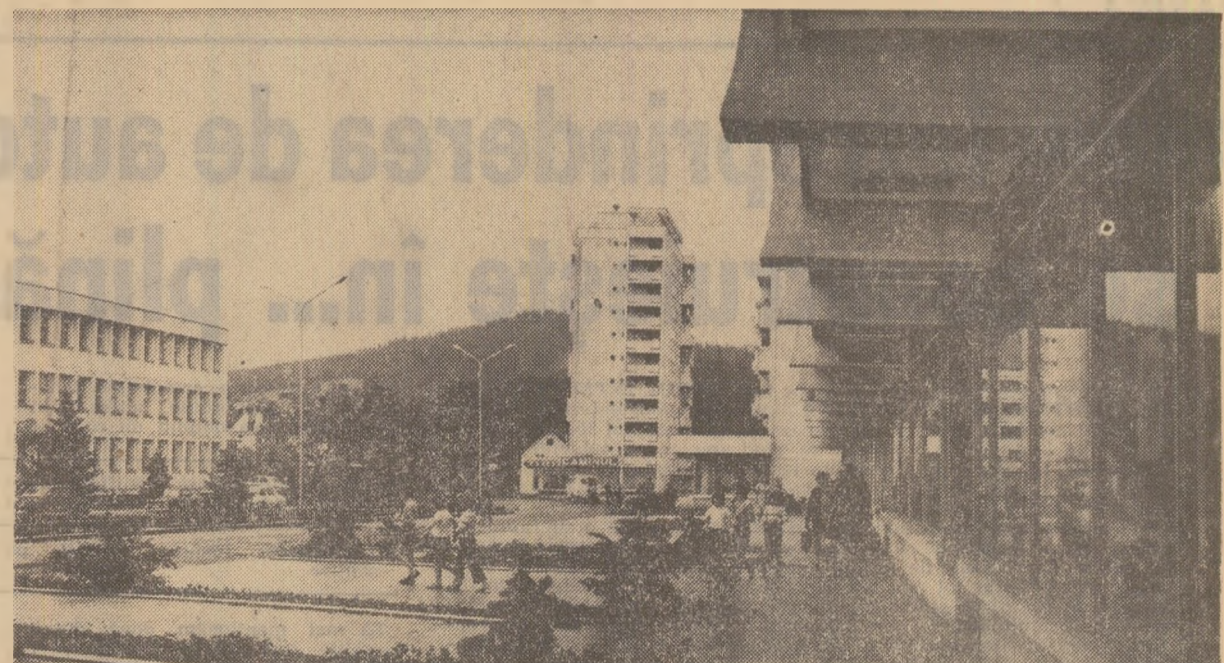
Din noul peisaj al orașului Cimpulung Moldovenesc