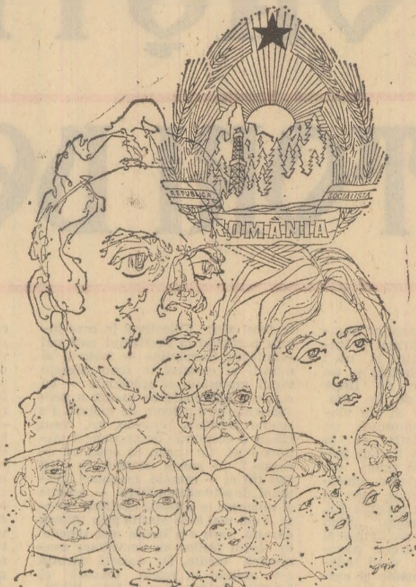
Desen de Mihail GION