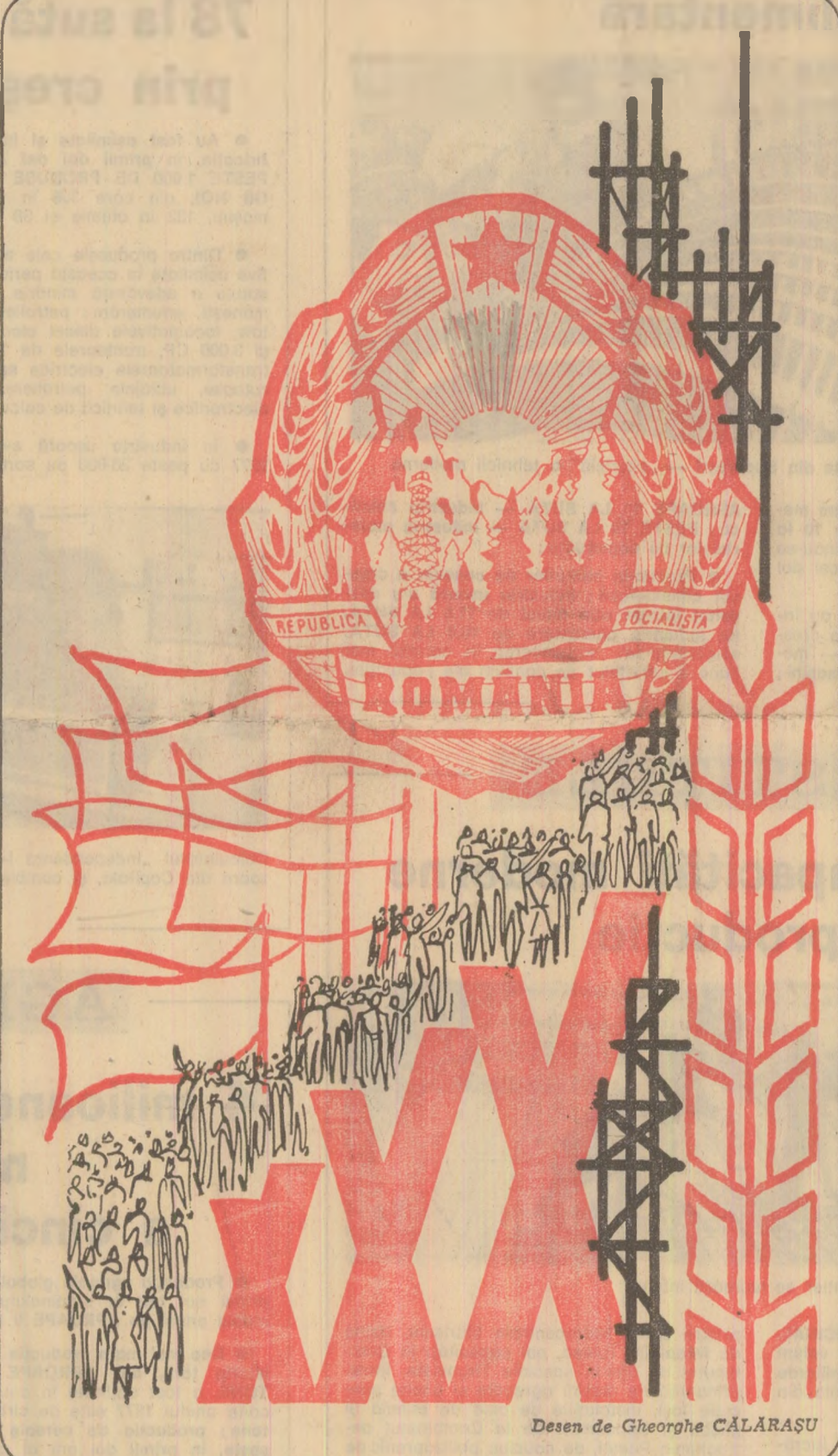
Desen de Gheorghe CĂLĂRAȘU