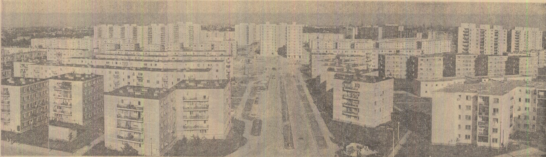
Ploiești — peisaj urban