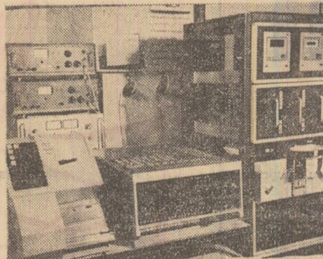
Calculatorul „Independența 1-100”, realizat în acest cincinal la întreprinderea de calculatoare din Capitală, și combina de sortat cartofii, construită de colectivul de la „Tehnologia” din Odorheiu Secuiesc

● În industria Capitală și a județului Hunedoara, întregul spor de producție în primii doi ani ai cincinalului s-a realizat pe seama creșterii productivității muncii, iar în județele Buzău, Sibiu, Brașov, Neamț, Bihor, Galați, Dimbovița s-a obținut, pe această bază, între 80 și 85 la sută din sporul de producție industrială.