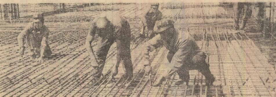
Pe șantier se lucrează intens

1000 noi capacități moderne de producție