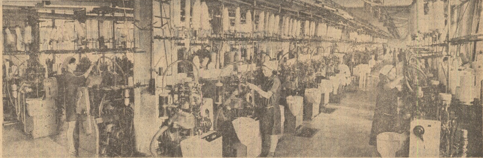
În secția I a întreprinderii „Adesgo” din Capitală

Ce poți economisi AZI nu lasa pe MÎINE! ...și mai ales cînd este vorba de ENERGIA ELECTRICĂ