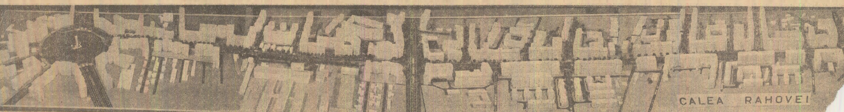
Așa va arăta — potrivit machetei de mai sus — Calea Rahovei

Florea CEAUȘESCU Dumitru TÎRCOBU (Continuare în pag. a II-a)