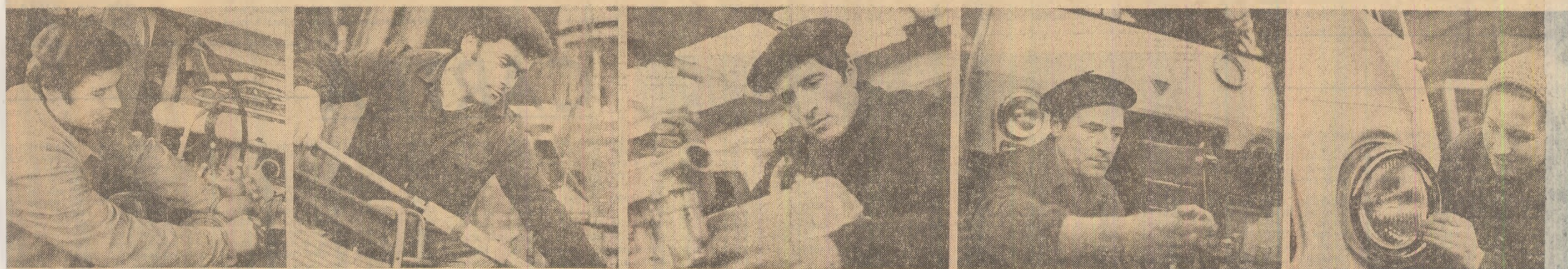
În centrul preocupărilor - creșterea producției la 1000 lei fonduri fixe

În vederea îndeplinirii acestei sarcini, la noi în întreprindere, au fost inițiate încă din ultimul trimestru al anului trecut o serie de măsuri tehnice și organizatorice, multe dintre acestea fiind în curs de materializare în aceste zile. Avem în vedere, în primul rând, utilizarea cu îndrăzneală a capacităților de producție, prin creșterea vitezelor de lucru pe baza îmbunătățirii calității se-