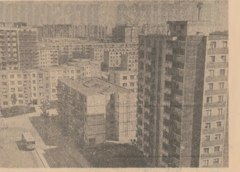
Galați. Cartierul „Dunărea”