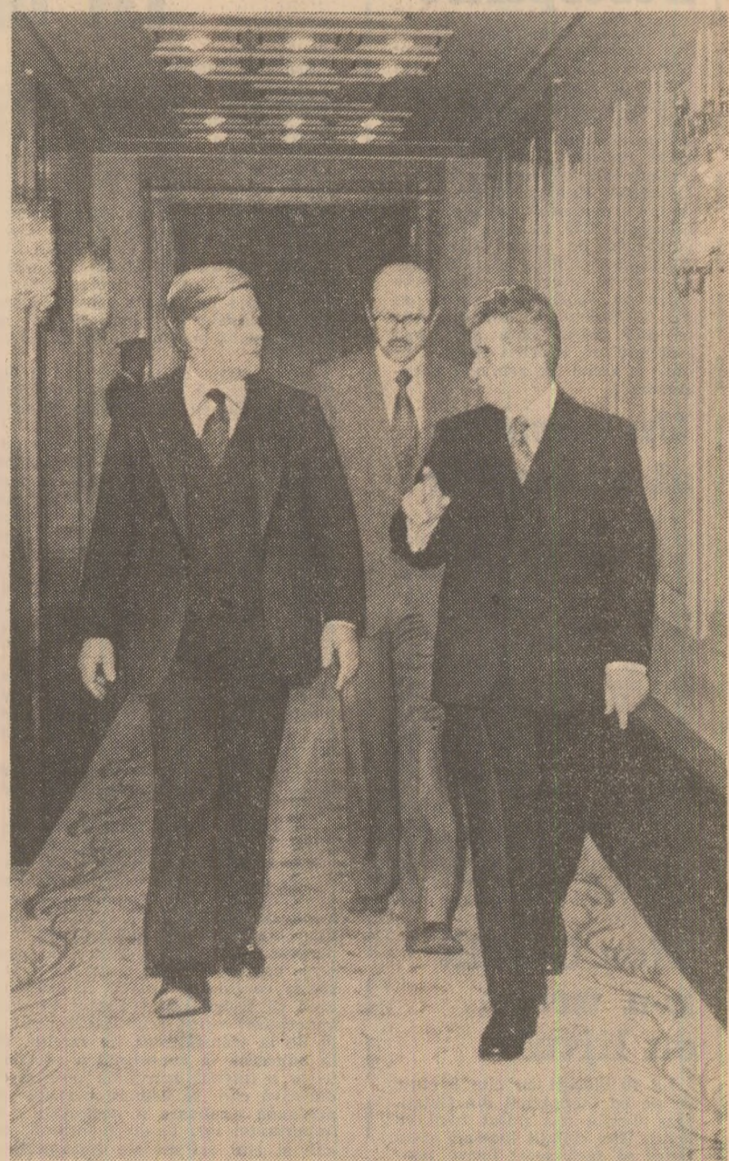
rață Germania și se găsește mai puțin și mai bun decît se produce în această țară. Eu, aș dori foarte mult ca studierea pieței din acest punct de vedere să fie aprofundată considerabil. Guvernul federal este dispus să acorde asistență în această privință. Dar, desigur, și firme din R.F.G., în special firme comerciale, sînt, de asemenea, dispuse să acorde ajutor în această problemă. În general, se poate spune, de altfel, că colaborarea dintre firme particulare din Republica Federală Germania și întreprinderile de stat din România a înregistrat deja progrese destul de bune, dar, desigur, această colaborare poate fi îmbunătățită considerabil.

Se pune problema găsirii acestor produse care să intereseze și să trezească interes. Se pune, deci, problema analizării pieței din punctul de vedere a ceea ce este necesar, a ceea ce se cere în Republica Federa-