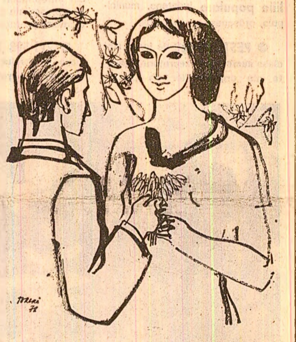
Desen de Traian VASAI