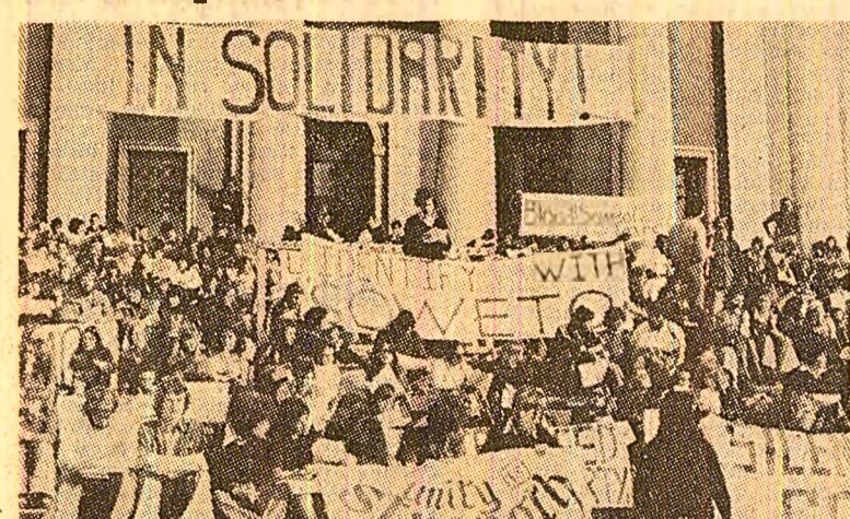
Studentii albi de la Universitatea din Capetown au declanșat ample acțiuni în sprijinul luptei populației africane împotriva apartheidului. „Sintem solidari cu Soweto” — stă scris pe pancartele demonstranților

În decurs de 15 ani, cheltuielile militare ale Africii de Sud au crescut de peste 10 ori, de la 168 milioane dolari în 1962-1963, la 1,9 miliarde dolari în 1977-1978. R.S.A. dispune de enorme cantități de material militar ultramodern și de o