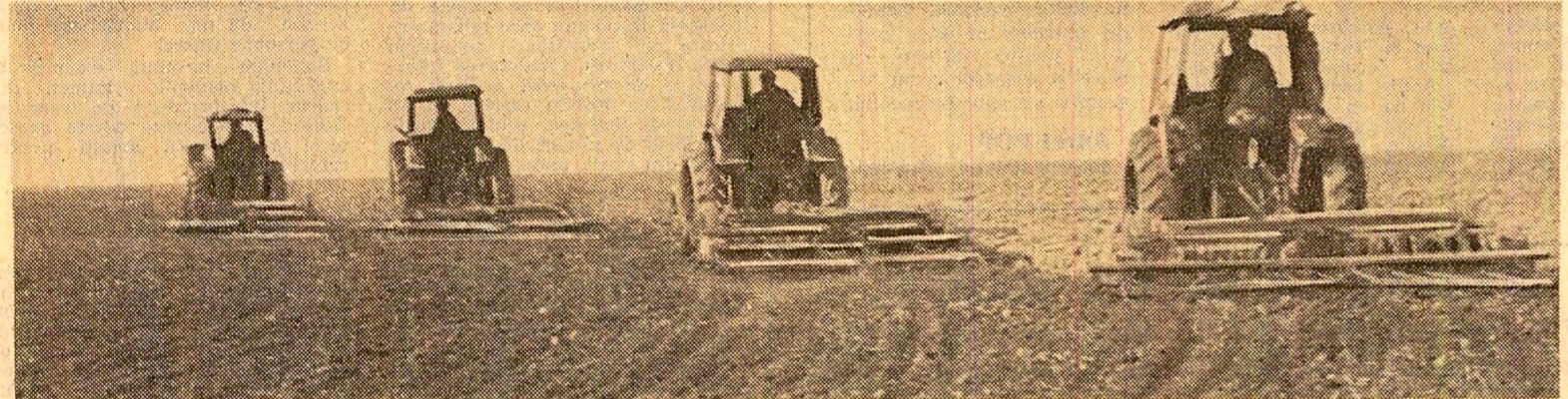
Mecanizatorii execută lucrări de bună calitate, la pregătirea terenului, pe ogoarele C.A.P. Nănești, județul Vrancea

buie să deplaseze suprafețele care pot fi tratate cu prioritate, să asigure, printr-o bună organizare și un control permanent și exigent, executarea de lucrări de cea mai bună calitate. Sub nici un motiv, ei nu trebuie să admită nici o abatere de la regulile agrotehnice, de la normele de calitate prevăzute în tehnologia fiecărei culturi! Organele agricole județene, comitetele de partid și consiliile populare comunale au datoria să se ocupe zi de zi, cu cea mai mare răspundere, de buna organizare și urgentarea lucrărilor agricole. Toți oamenii muncii de la sate, mecanizatorii, cooperatorii și specialiștii din fiecare unitate trebuie puternic mobilizați pentru ca în această săptămînă să se însămînțeze cea mai mare parte din suprafețele destinate culturilor din prima epocă, să fie intensificate lucrările în legumicultură, în vii și livezi.