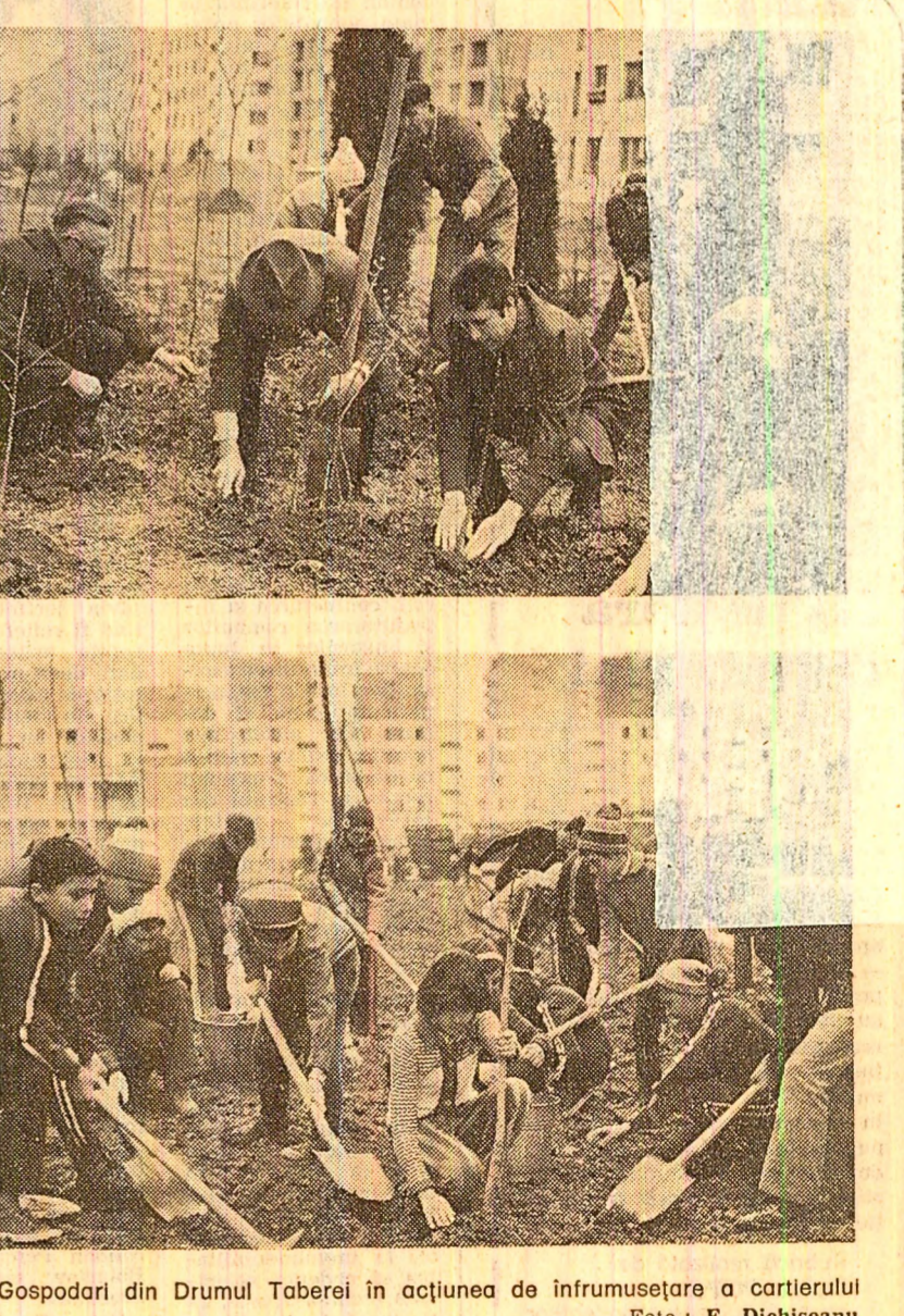
Gospodari din Drumul Taberei în acțiunea de înfrumusețare a cartierului