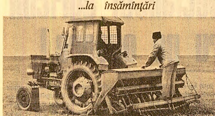
Numai lucrări de bună calitate — iată cuvîntul de ordine al mecanizatorilor de la C.A.P. Grădiștea, care au început înșămînțările