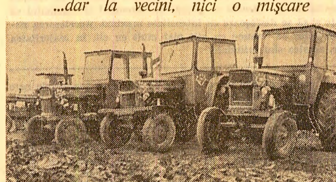
Deși timpul era bun de lucru, în curtea secției de mecanizare Radu Vodă stăteau nu mai puțin de 12 tractoare