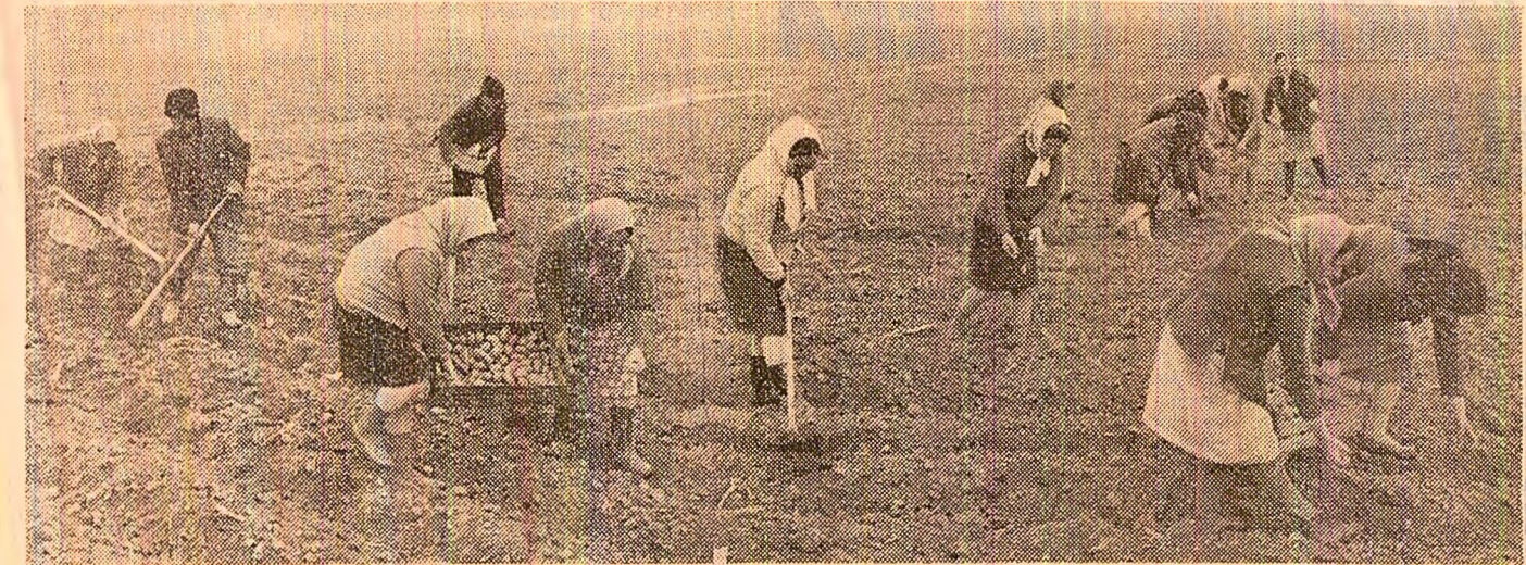
Doi moduri diferite ale a acțiunii în campania agricolă: la Crouv, cooperatorii, în frunte cu cadrele de conducere, au plantat între „ferestrele” ploilor peste 10 hectare cu cartofi, în timp ce la unitatea vecină din Odobesti, conducerea cooperativei abia acum se ocupă de semănarea angajamentelor pentru lucrările ce vor fi executate în acord global