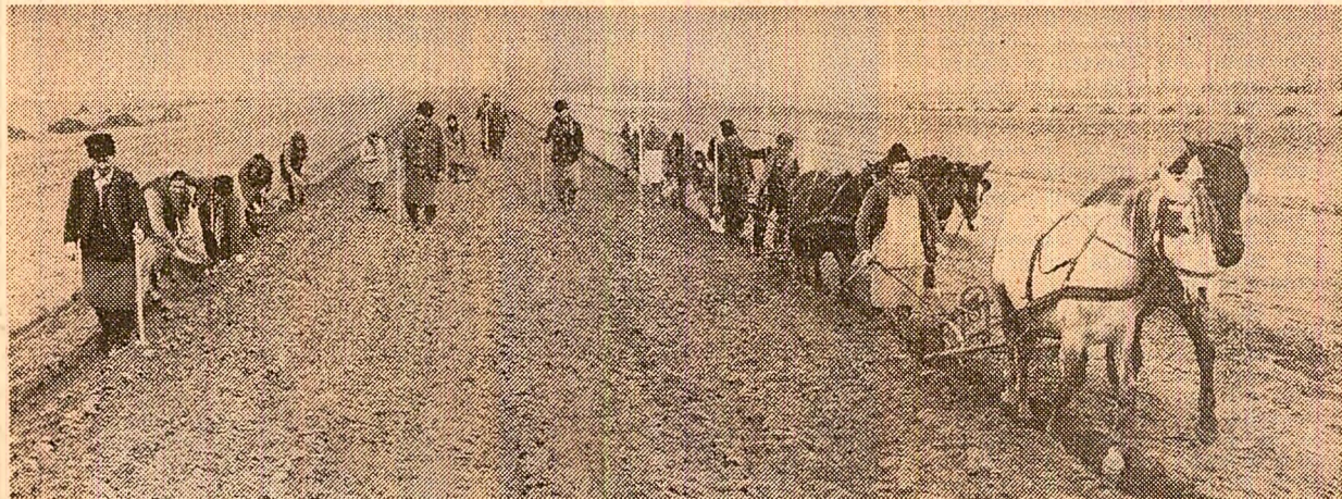
La Lungulețu, cartofii se plantează după obiceiul locului: foarte de timpuriu și într-un teren pregătît grădinarăște

Itinerarul nostru a scos în evidență că adevărații agricultori știu să lucreze pe orice vreme. Exemplul lor se cuvine să fie urmat și de alții, cu atît mai mult cu cît lucrările agricole se automerază de la o zi la alta și trebuie făcut totul pentru recuperarea întârzierilor. Iosif POP Constanțin SOCI