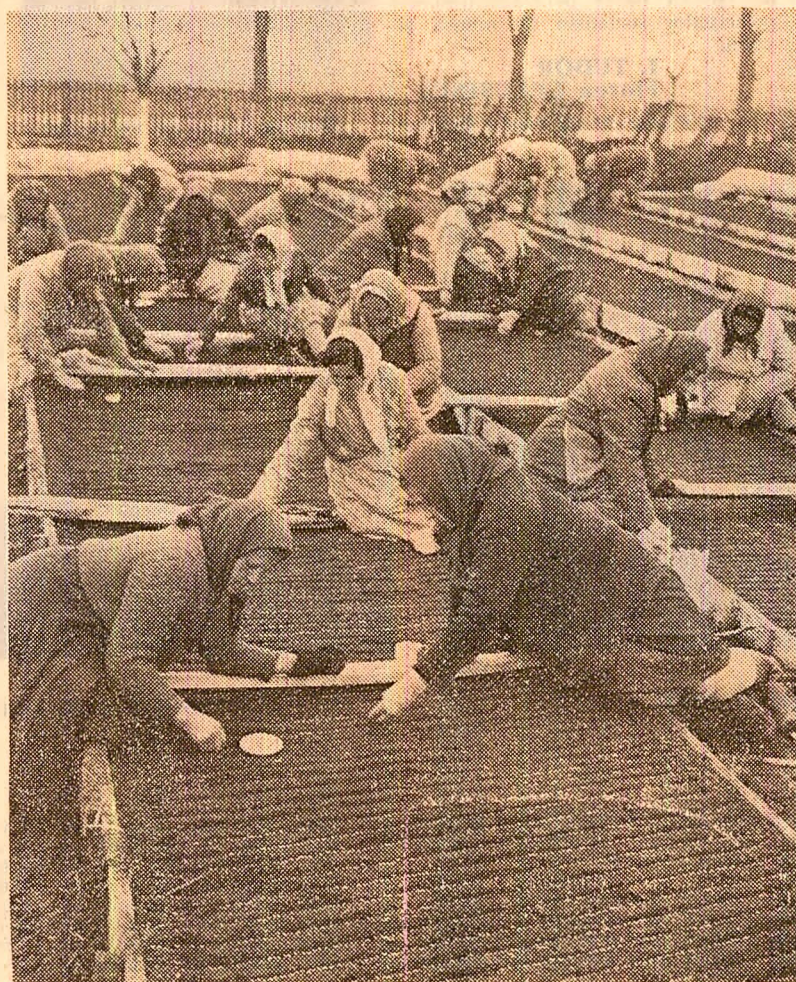
Chiar dacă ieri a plouat, cooperatorii din Potlogi au lucrat cu spor la semănatul răsădnilor