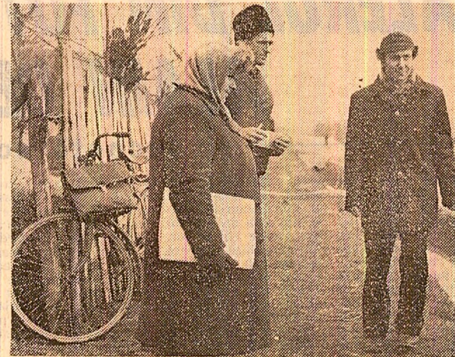
Doi moduri diferite ale a acțiunii în campania agricolă: la Crouv, cooperatorii, în frunte cu cadrele de conducere, au plantat între „ferestrele” ploilor peste 10 hectare cu cartofi, în timp ce la unitatea vecină din Odobesti, conducerea cooperativei abia acum se ocupă de semănarea angajamentelor pentru lucrările ce vor fi executate în acord global

Începînd de la 4 a prilej ac, timp de 3 zile, Simpozionul național cu tema „Bilanț și perspective în activitatea de creație științifică și tehnică de masă” va prileji dezbaterea în plen și pe ramuri ale economiei naționale a unor probleme de larg interes pentru țara noastră. Dezbaterile vor viza și noi în promovarea progresului tehnic și a concenției tehnice românești, în scopul reducerii importurilor, a consumurilor de materii prime, materiale, combustibili și