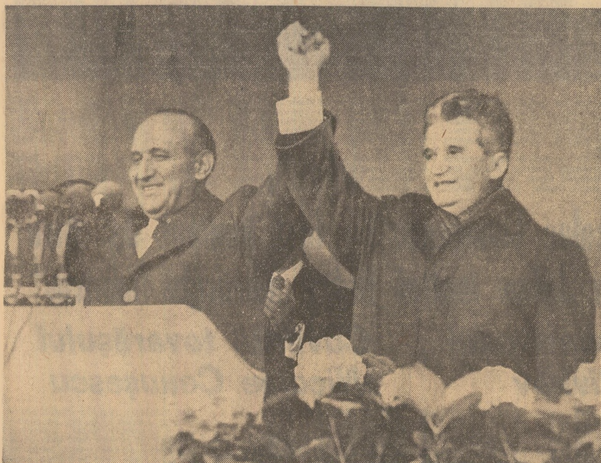
La mitingul prieteniei româno-bulgare

Mii de oameni ai muncii români și bulgari au dat expresie sentimentelor de profundă satisfacție pentru dezvoltarea continuă a colaborării frățești dintre cele două țări și popoare, în interesul construcției socialismului, al făuririi unei vieți tot mai prospere