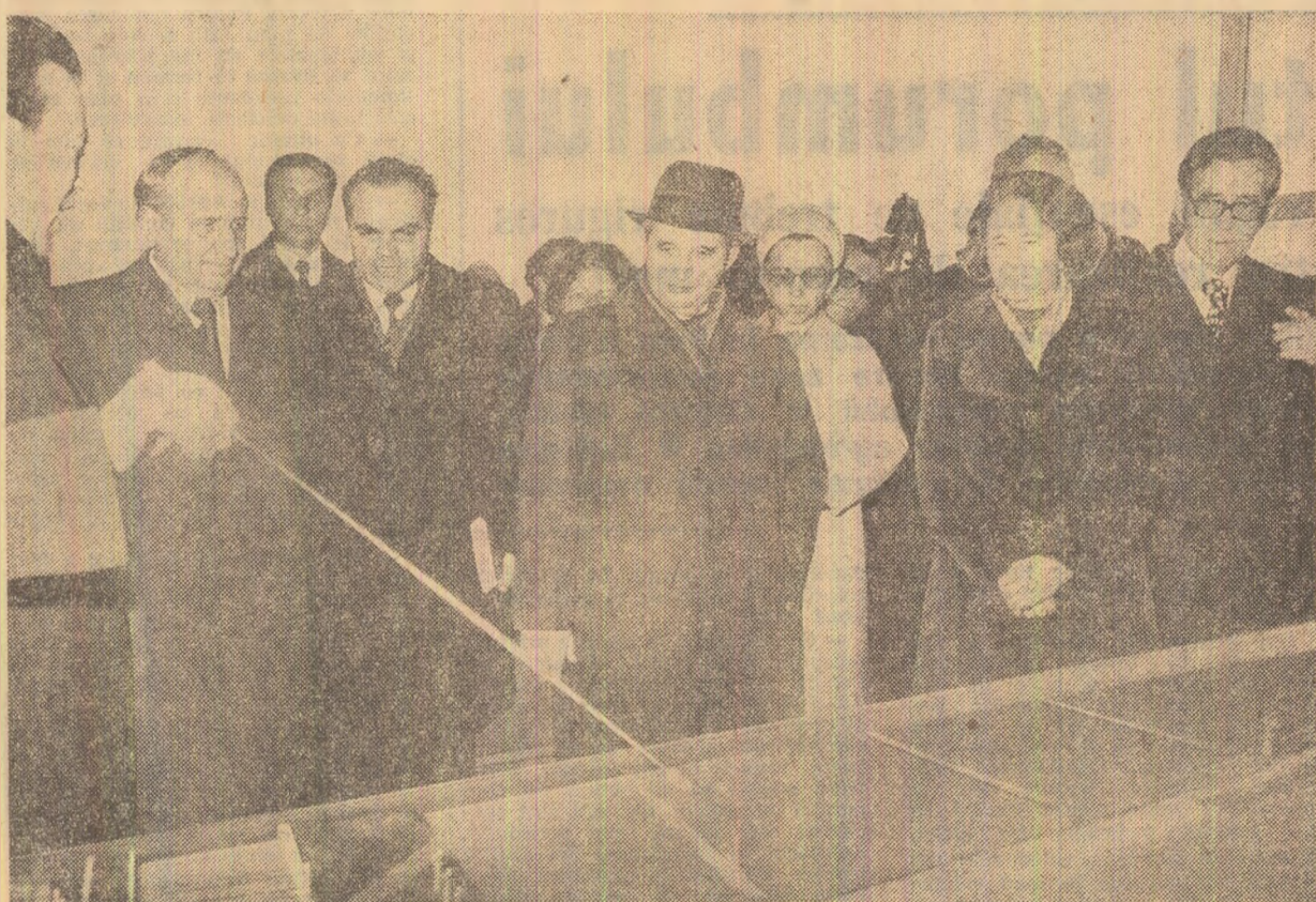
În fața machetei viitorului complex hidroenergetic

Mitingul la sfîrșit într-o atmosferă însuflețitoare, participării exprimi-mind, încă o dată, din inimă, recunoștința lor față de cei doi conducători de partid și de stat, pentru tot ceea ce au făcut și fac ca prietenia tradițională între partidele, popoarele și țările noastre să capete noi valențe, să se dezvolte și să se întărească continuu.