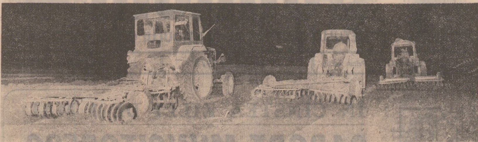
Cooperativa agricolă din Gorgota: în răcoarea nopții, mecanizatorii din schimburile prelungește pregătesc pentru a doua zi între 30 și 40 de hectare destinate însămînțării porumbului