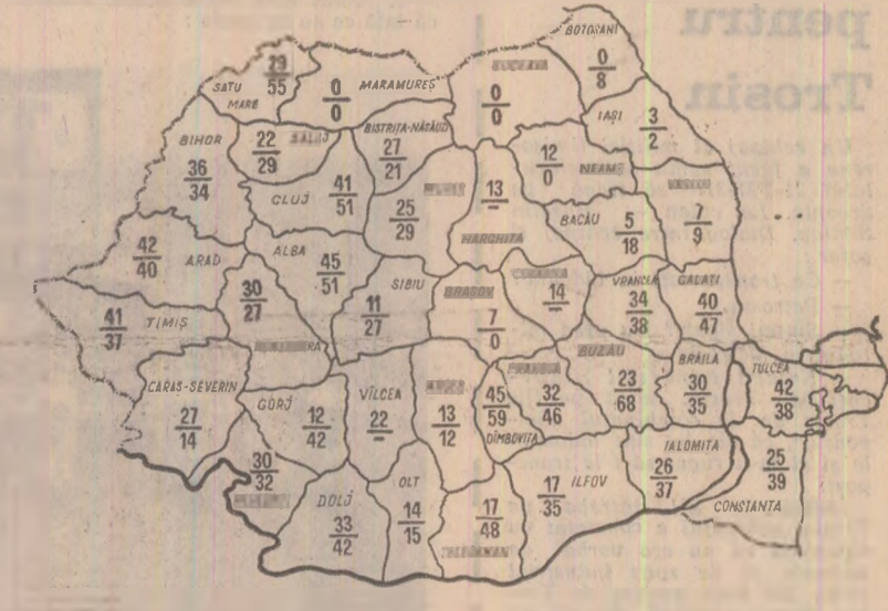
Stadiul însămînțării porumbului la 19 aprilie. Cifrele înscrise pe hartă reprezintă suprafețele însămînțate, în procente, în cooperativele agricole (sus) și întreprinderile agricole (jos)

• Tractoarele — zi și noapte pe ogoare • Ritmul de lucru trebuie să crească pretutindeni • Atenție deosebită calității lucrărilor