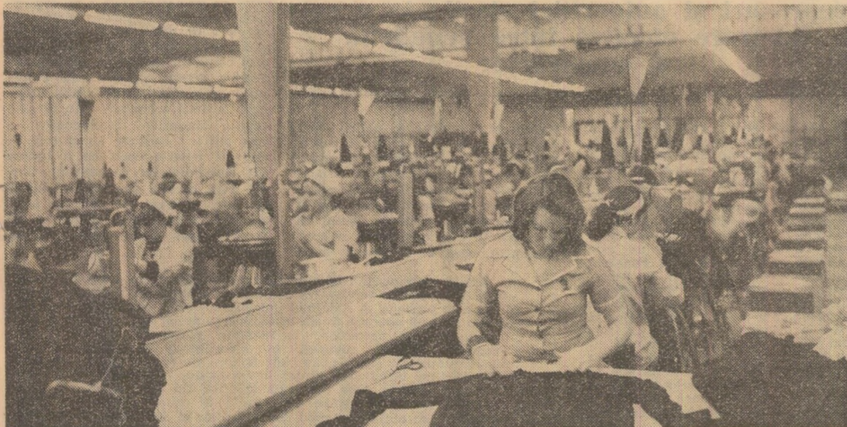
Prin participarea activă și competentă la amplu efort constructiv susținut de poporul nostru, femeile se afirmă tot mai pregnant ca o puternică forță creatoare în întreaga viață economică-socială și spirituală a națiunii. O imagine grăitoare dintr-una din secțiile întreprinderii „Tricoava” din București, unde prezența femeilor la conducerea și organizarea producției este preponderentă.

Calde și impresionante sentimente de prețuire și dragoste, de atâtea mulțumiri pentru contribuția deosebită la elaborarea și transpunerea în practică a măsurilor stabilite de conducerea partidului în vederea creșterii rolului femeii în viața socială și în viața economică, politică și socială a țării, pentru sprijinul permanent și îndrumările valoroase pe care le acordă mișcării de femei au fost exprimate față de tovarășa Elena Ceaușescu, eminentă persoana-