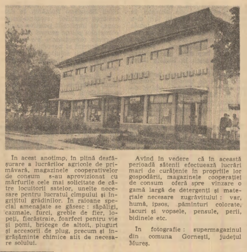
In acest anotimp, în plină desfășurare a lucrărilor agricole de primăvară, magazinele cooperativei de comunitate s-au aproponat cu mărfurile cele mai solicitate...