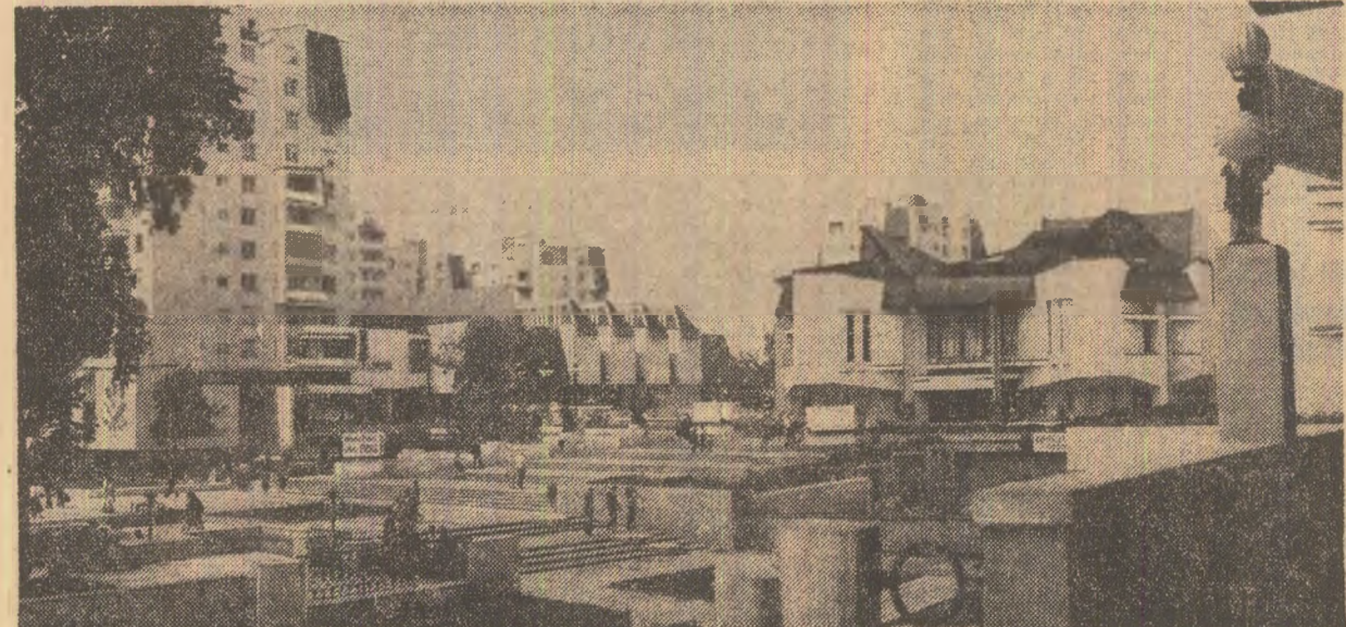
Piața teatrului din Tg. Mureș

Astăzi, în patria noastră, Ziua internațională a celor ce muncesc s-a dovedit a fi prin contribuția directă a femeii la progresul social și economic al țării, și deopotrivă cu cei de acum: un popor harnic, modest, iubitor de pace, cu sentimente de frăție și omenie, greu gășibile la alții, și care, în ciuda unor imperii mai mari sau mai mici, fără a turbura specificul limbii și purtarea altora, ne-am păstrat caracterul și sufletul nealterate, și astăzi de ușor de identificat, de la zidurile cele vechi ale cetăților de acum 2050 de ani la versul dinții al unui poet ce devine el însuși în această Cîntare a României — semn al muncii și împlinirii noastre libere. Spun că refac un drum, o călătorie imaginată care pornește din Cîmpia Bihorului, din partea de vest, unde Oradea e mai frumoasă ca niciodată; și ca într-un basm greu de crezut, am petrecut acolo, cu un timp în urmă, citeva zile la un Festival al teatrului scurt, și am ascultat acel text fără seamăn în enoția pe care mi-a dat-o, acel oțcio al lui Grigore Vodă, ce s-a păstrat în Oradea mea mai bine de 200 de ani