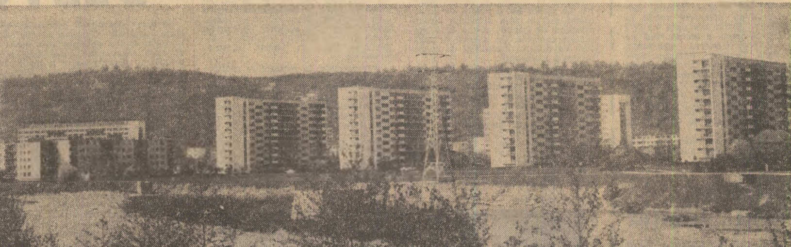
Cartierul Grigorescu din Cluj-Napoca

șămînțări la toate culturile constituie prima condiție de care depinde obținerea producțiilor prevăzute în planul pe acest an. În aceste zile continuă plantarea legumelor în cîmp, lucrare care se execută eșalonat, potrivit graficelor întocmite de organele de specialitate. Pînă acum legumele au fost plantate pe 75 la sută din suprafețele prevăzute. Această lucrare trebuie însă grabită, astfel încît să se asigure obținerea, unor recolte cât mai mari de legume. Vîntul puternic din zilele de 2 și 3 mai a descoperit unele solarii, iar în cîmp a deșădăcinat și rupt răsaduri. În asemenea situații, este necesar să fie refăcute solarile, iar goliurile din grădini să fie completate cu răsaduri din rezervele care există în unitățile respective sau în cele învecinate. Tempul este înaintat și de aceea trebuie să se acționeze energic pentru ca în toate unitățile agricole să se încheie neîntîrziat înșămînțarea porumbului și a celorlalte culturi de primăvară, să se troacă la efectuarea lucrărilor de întreținere.