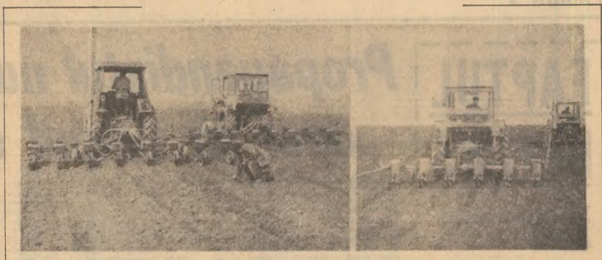
În județul Iași continuă înșămînțarea porumbului. În două aspecte surprinse pe ogărele cooperativei agricole din comuna Bivolari (fotografia din stînga) și ale cooperativei agricole din Trifești (fotografia din dreapta)

Mecanizatorii, lucrătorii din întreprinderile agricole de stat și cooperatorii din județul Teleorman au raportat încheierea înșămînțării porumbului. În telegrama adresată cu acest prilej C.C. al P.C.R., tovarășului Nicolae Ceaușescu, de Comitetul județean Teleorman al P.C.R. se spune: Asigurăm conducerea superioară de partid și de stat, pe dumneavoastră personal, mult stimate tovarășe Nicolae Ceaușescu, că oamenii muncii din agricultura județului Teleorman nu vor recruta nici un efort pentru a asigura în continuare executarea corectă și la timp a lucrărilor agricole, pentru îndeplinirea și depășirea sarcinilor de plan și a angajamentelor asumate, conștienți că în felul acesta contribuie la înfăptuirea neabătută a programului de edificare a socialismului și comunismului în scumpă noastră patrie, Republica Socialistă România.