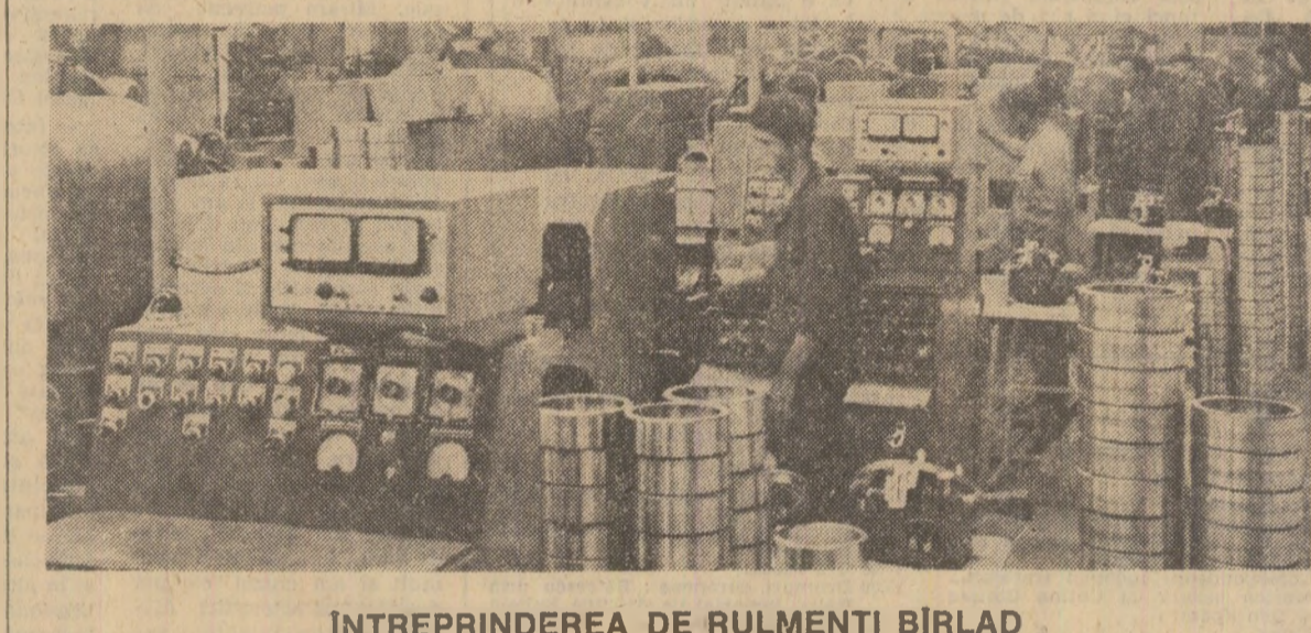
ÎNTERPRINDEREA DE RULMENȚI BIRLAD