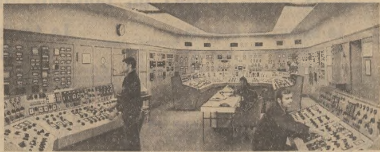
Prin înaltul grad de tehnicitate și automatizare al instalațiilor, termocentrala Iernu intruneste toate atribuțiile unei moderne citadele a luminii