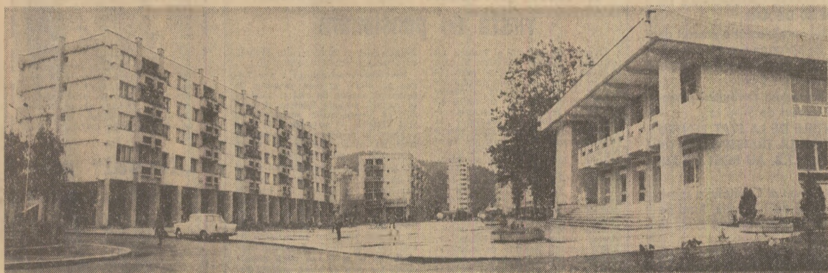
Înnouri urbanistice la Cîmpulna Moldovenească