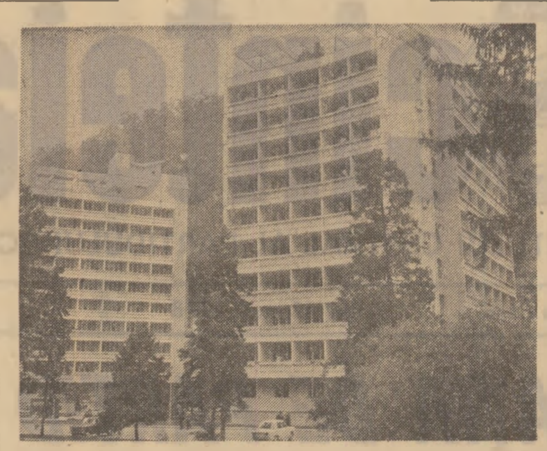
Herculane — una din stațiunile de cură balneară în care s-au construit în ultimii ani noi baze de tratament

De asemenea, se cuvine menționat faptul că, la începutul lunii viitoare se va încheia prima etapă de majorare a retribuțiilor oamenilor muncii — cu trei luni mai devreme decât se stabilise inițial — CEEI CE PERMITE OAMENILOR MUNCII SĂ OBTINĂ 2 MILIARDE LEI ÎN PLUS PESTE CELE 40 DE MILIARDE LEI, CIT TOTALIZEAZĂ FONDUL DE MAJORARE SUPPLEMENTARĂ A RETRIBUȚIILOR ÎN ACTUALUL CINCINAL. La sfârșitul primei etape de majorare — adică la 1 iunie anul acesta — creșterea retribuției tarifare nete pe ramuri va fi de 15,9—19,2 la sută. Începând de anul viitor se va trece la cea de-a doua etapă de majorare a retribuțiilor, ceea ce va asigura creșterea retribuției reale pe ansamblul actualului cincinal cu 32 la sută.