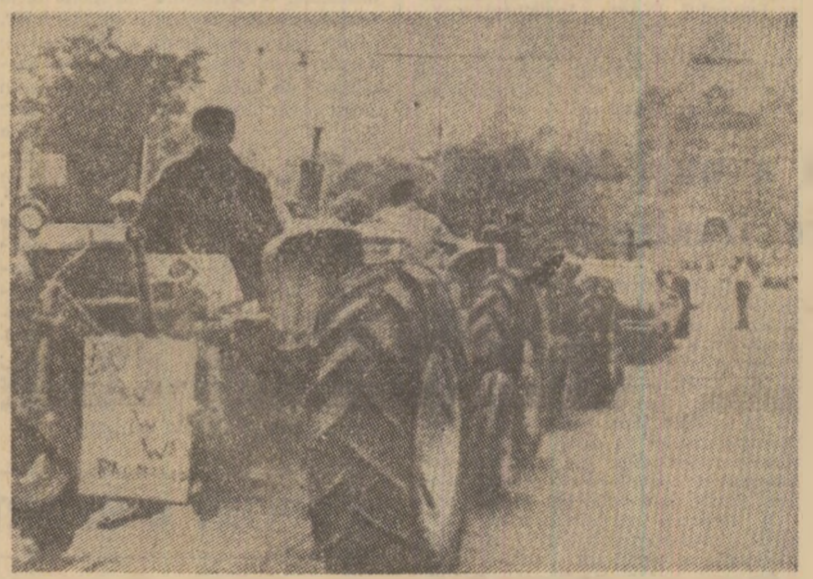
In Canada au loc acțiuni de protest ale fermierilor împotriva deteriorării situației lor economice. După cum se vede și in fotografia de mai sus, produsă din ziarul „Canadian Tribune”, pe străzile orașelor au loc demonstrații, participanții cerînd măsuri împotriva concedierii muncitorilor agricoli, precum și in sprijinul stabilizării veniturilor fermierilor mici și mijlocii, loviți de inflație.

Secretarul general al P.C. din Argentina, Geronimo Arnedo Alvarez, a evidențiat, totodată, că in țară există elemente extremiste de dreapta „care pot încerca o lovitură de stat”, ceea ce impune mobilizarea maselor, inclusiv a membrilor de partid, împotriva pericolului fascist.