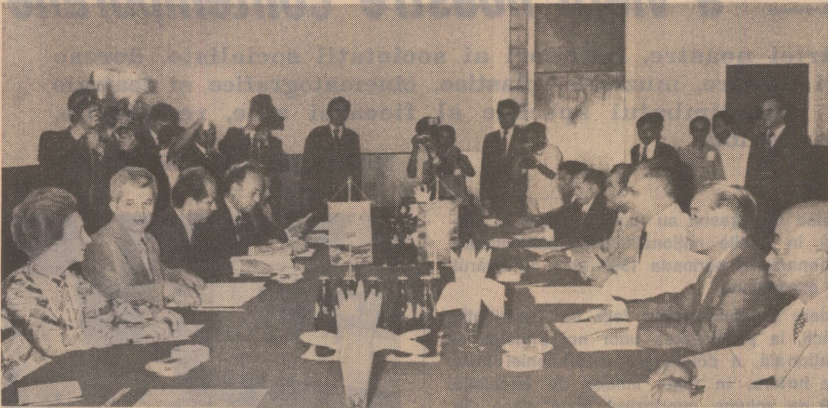
În timpul convorbirilor oficiale