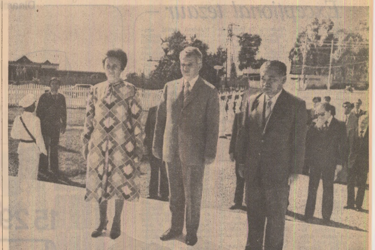
La Monumentul soldatului necunoscut