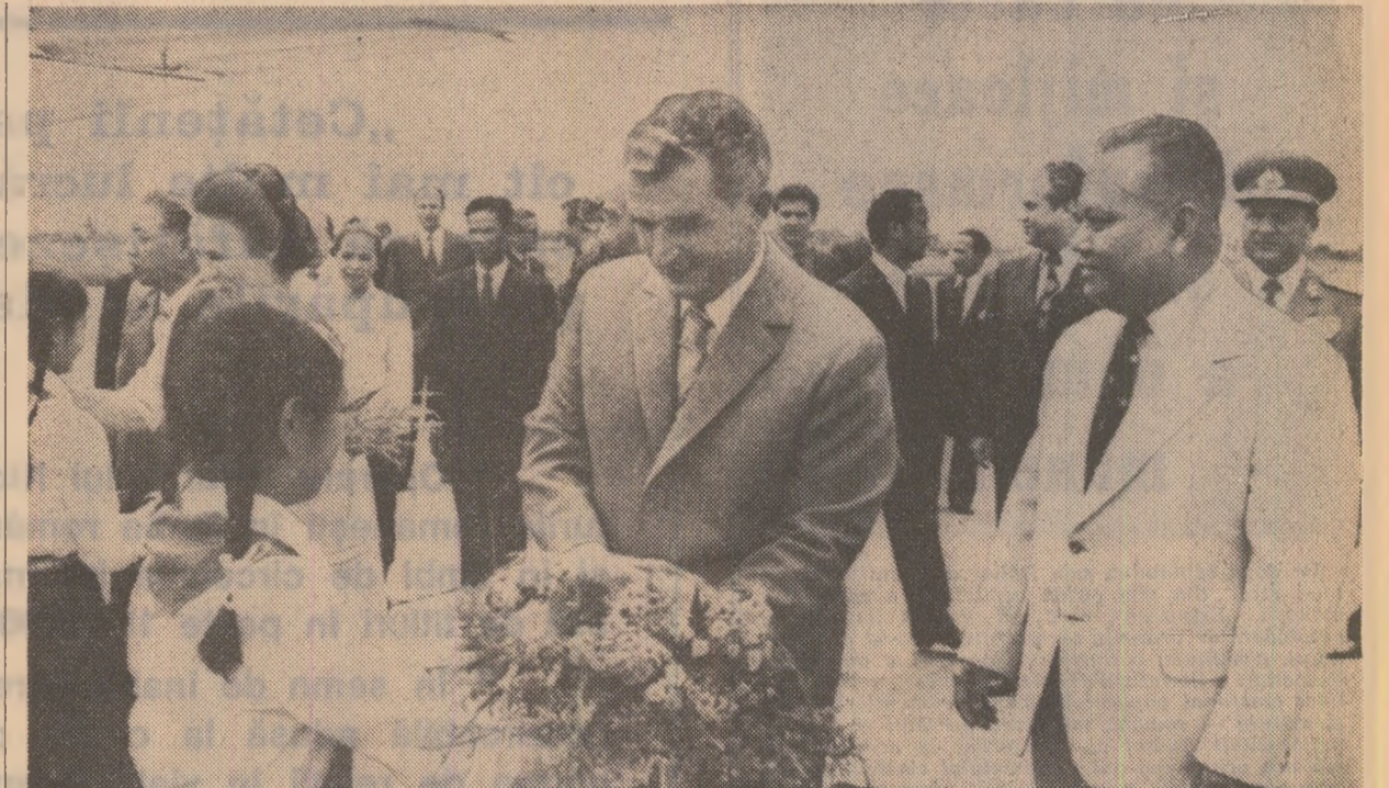
Flori ale stimei și prieteniei

(Urmare din pag. 1) pretutindeni cu dragoste și simpatie. Pe masini au fost arborate stegulețurile românești și laotiene. Tovarășul Nicolae Ceaușescu, tovarășa Elena Ceaușescu se interesează de modul în care se lucrează, urmărind procesul de fabricație a furniturilor obținute în principal din esențe deosebit de valoroase de copaci care cresc în pădurile Laosului.