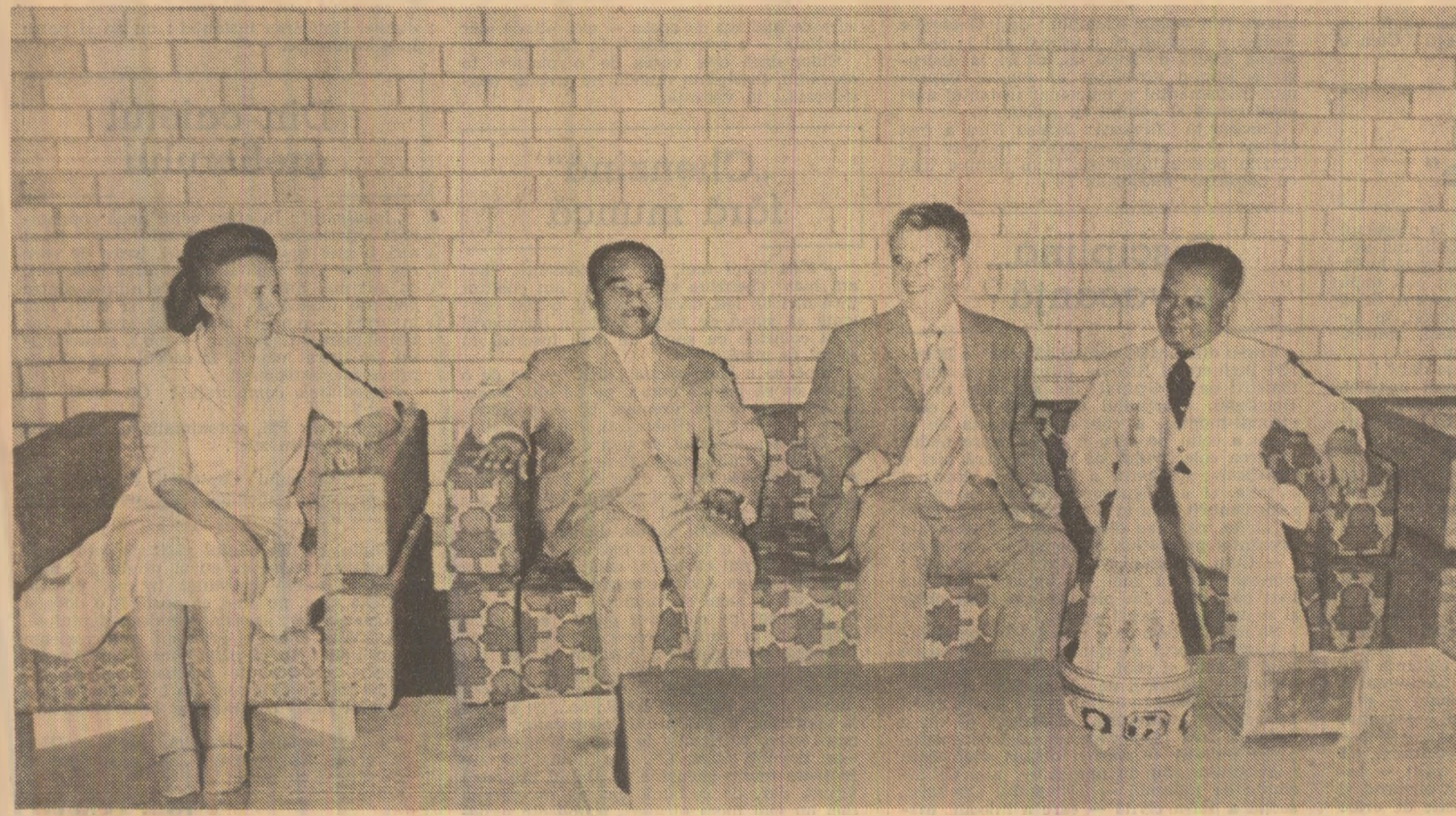
Întîlnirea tovarășului Nicolae Ceaușescu și a tovarășei Elena Ceaușescu cu tovarășii Kaysone Phomvihane și Sufanuvong