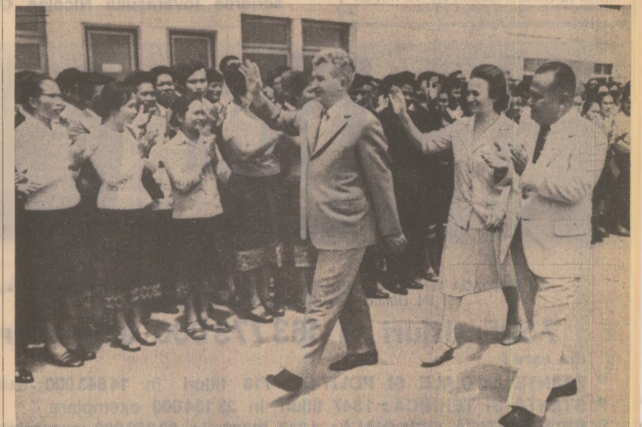
Înalții oaspeți români sînt întîmpinați cu dragoste și simpatie