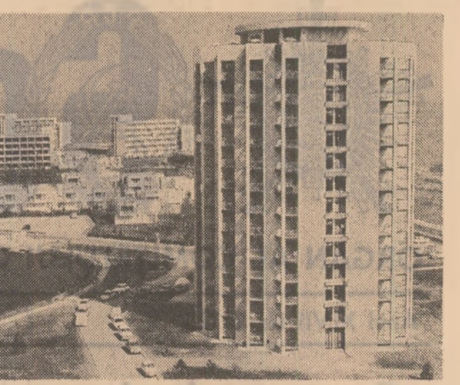
Imagine din stațiunea Venus