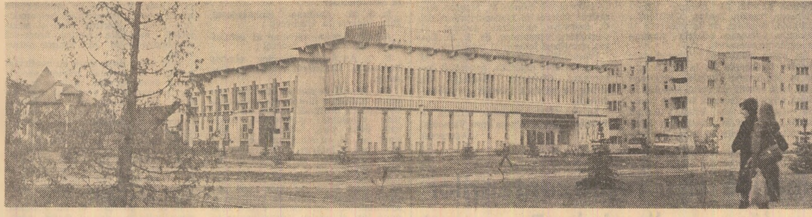
Noua casă de cultură în peisajul tînrului cartier al florilor din Gheorghieni

Nicolae BABALAU corespondent „Scintilei”