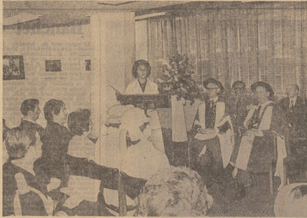
nu pierde", iar astăzi este o mare satisfacție de a avea aici, la Londra, o solie a României.