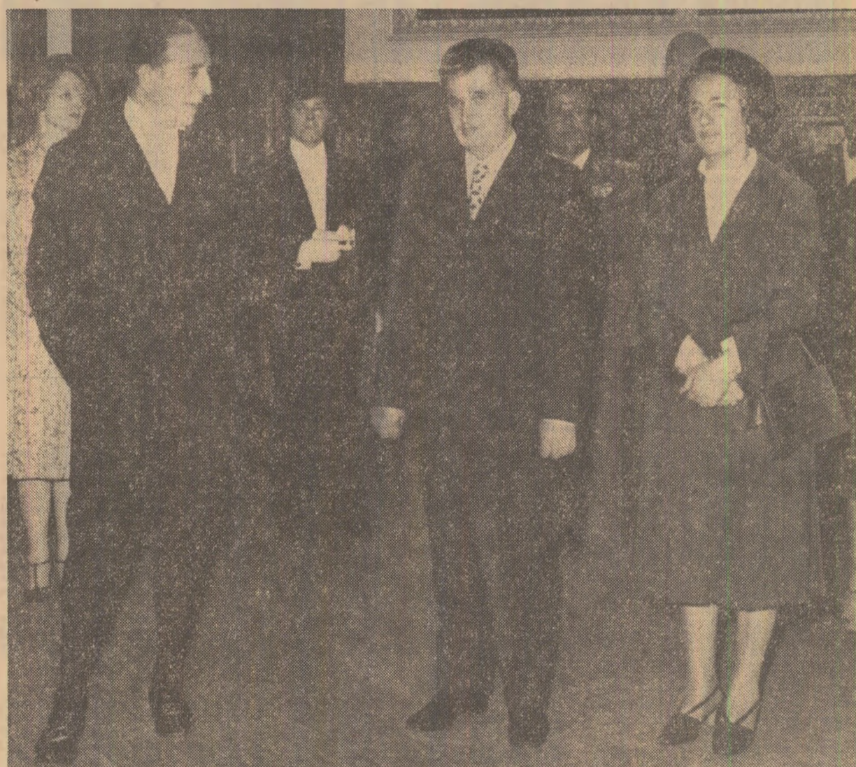
Primirea înalților oaspeți români la Palatul Westminster, sediul parlamentului