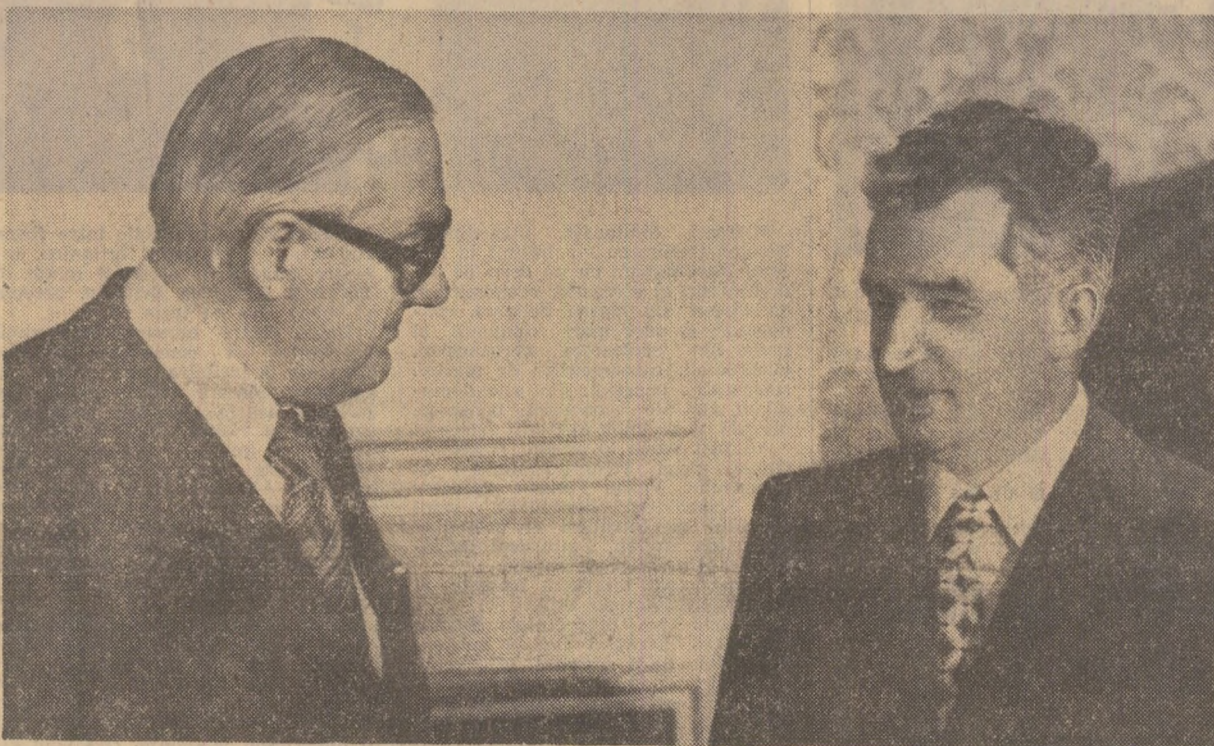
În timpul convorbirilor oficiale cu premierul britanic