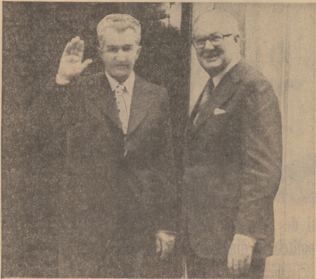
DEJUN OFERIT DE PRIMUL MINISTRU JAMES CALLAGHAN