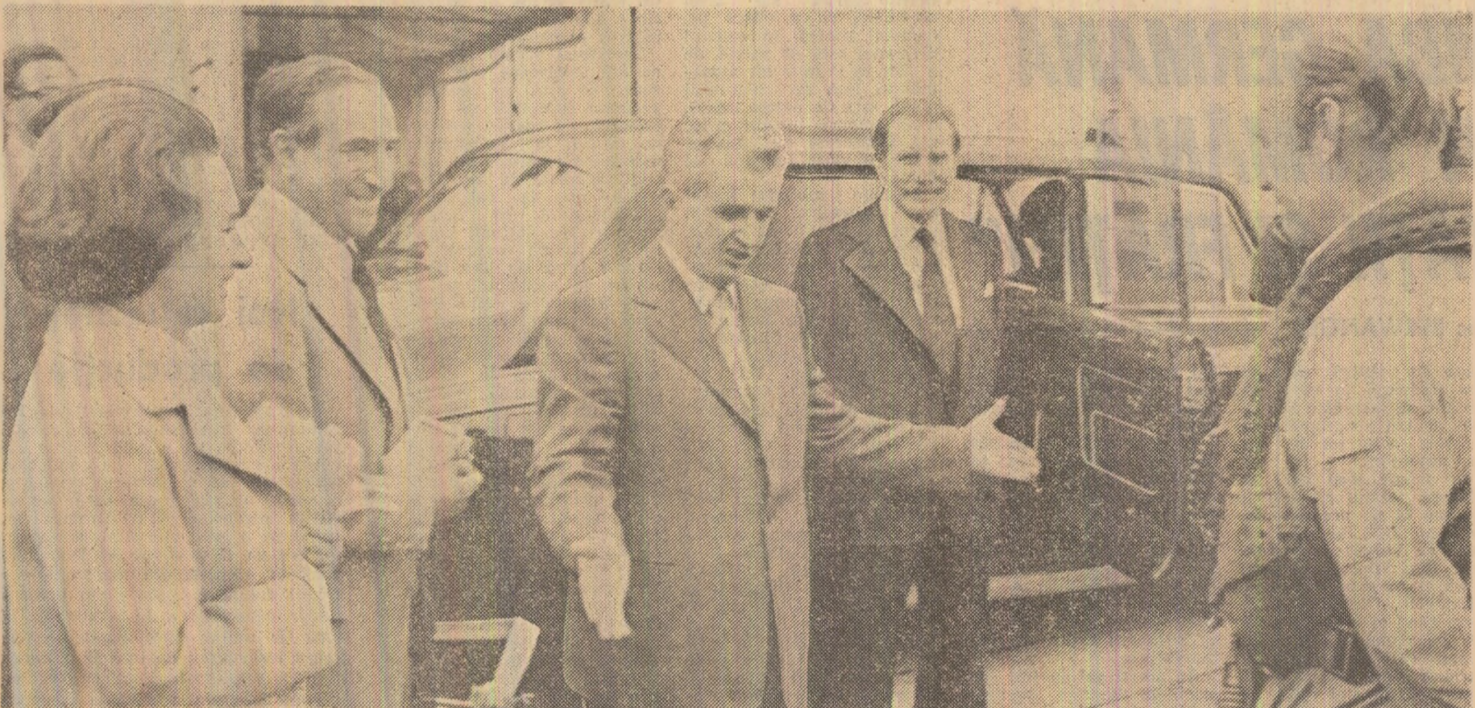
Tovarășul Nicolae Ceaușescu felicită pe piloții care au luat parte la demonstrația aviației organizată de British Aerospace