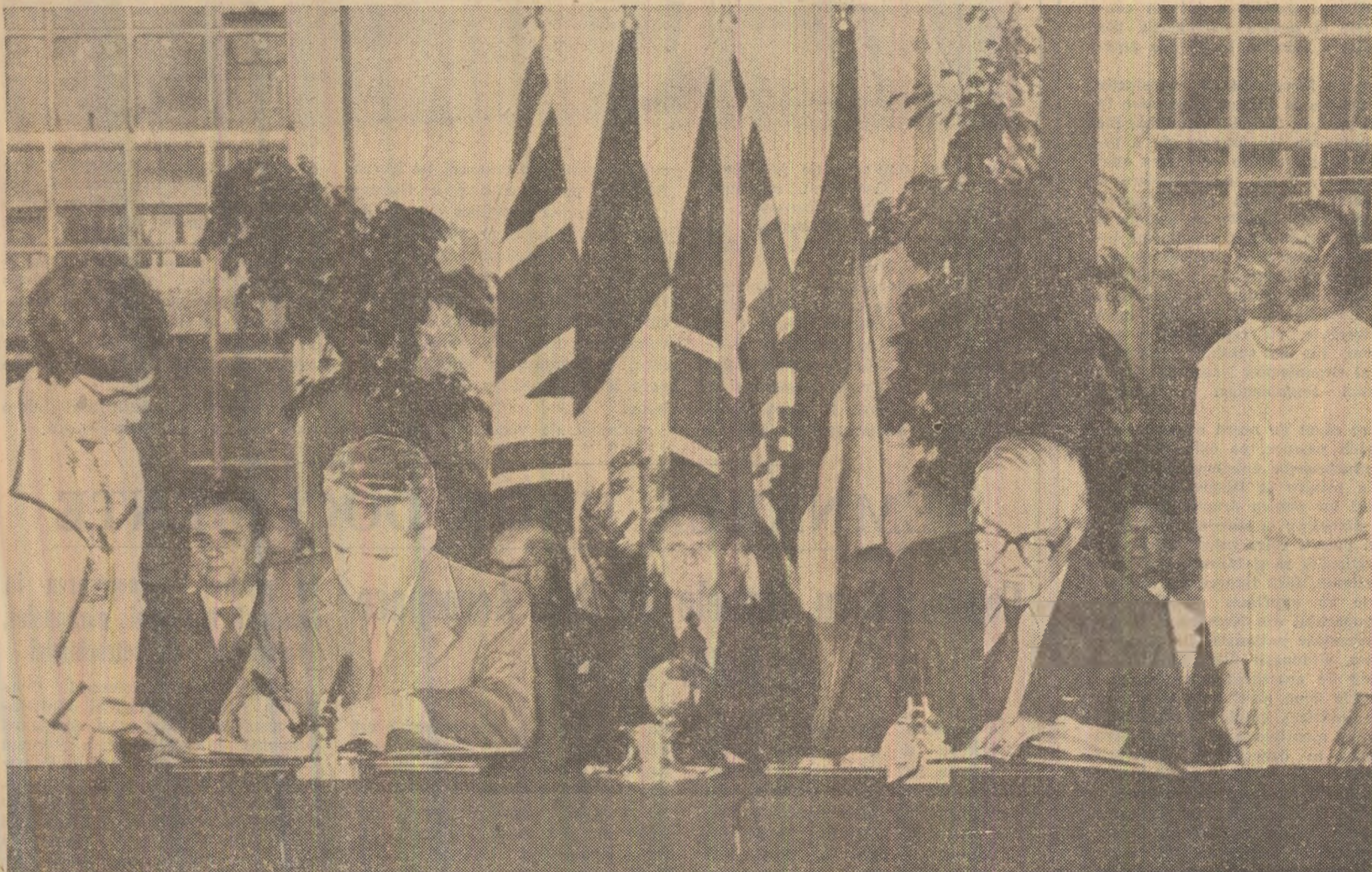
În timpul ceremoniei semnării Declarației comune

Radiografiile ale activității economice în preajma încheierii primului semestru înalta răspundere și buna organizare asigură