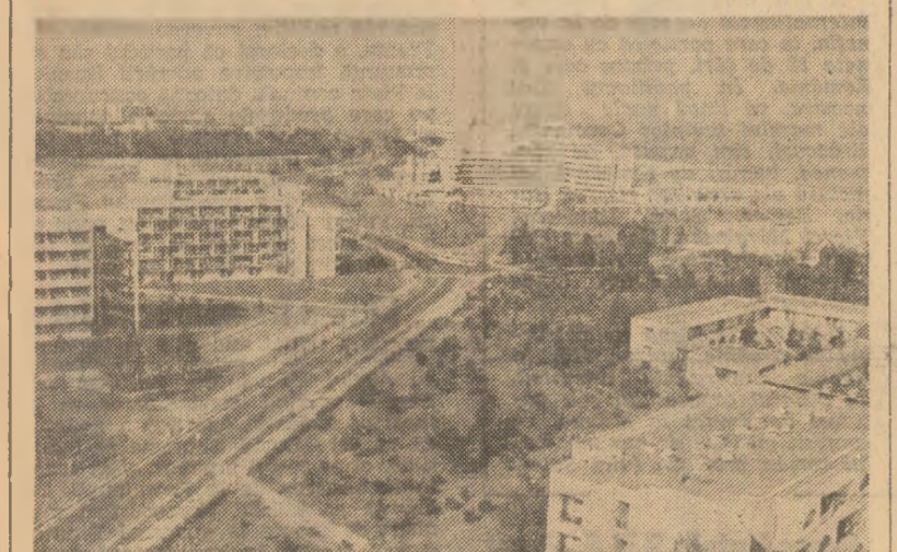
„Venus” - una din constelațiile litoralului românesc

De la Năvodari la Mangalia, plajele sunt pline de oaspeți din țară și de peste hotare. Oamenii se bucură, deopotrivă, de razele soarelui, de bunele servicii asigurate în hoteluri și restaurante. Dar, firește, gazele se preocupă în același timp și de asigurarea unor atractive programe culturale. Notăm în această ordine de idei că, în luna iunie, au avut loc peste 120 de spectacole de teatru, de operă, operetă, balet și folclorice, cu participarea unor prestigioase trupe din întreaga țară.