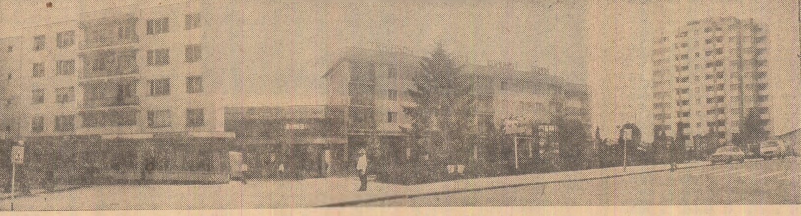
Arhitectură nouă în orașul Dorohoi