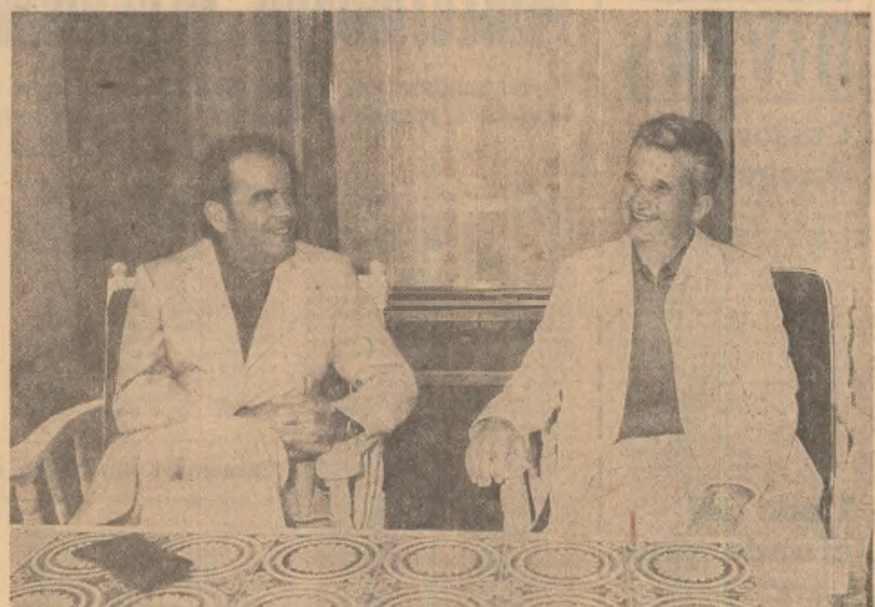
Luni au început, în stațiunea Neptun, convorbiri între tovarășul Nicolae Ceaușescu, secretar general al Partidului Communist Român, și tovarășul Georges Marchais, secretar general al Partidului Communist Francez, care se află la odihnă în țara noastră, la invitația C.C. al P.C.R. Convorbirile se desfășoară într-o atmosferă de caldă prietenie, de stimă reciprocă ce caracterizează bunele relații dintre Partidul Communist Român și Partidul Communist Francez.