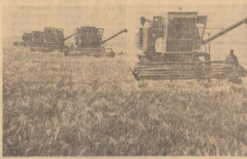
Zile de muncă intensă la seceriș, pe ogoarele C.A.P. Stoenești, județul Olt.

ACȚIUNI DE INTRAJUTORARE. Ziua de duminică pe ogoarele recoltate de Vaslui a fost o obișnuită de lucru la seceriș. Cifrele arată următorul bilanț : recoltat grîu și orz pe 1.316 hectare în cooperativele agricole, balotat paie pe mai bine de 1.200 hectare. Ziua de duminică a marcat începutul recoltării grîului în numeroase unități agricole. Pînă ieri, în cooperativele agricole grîul a fost secerat deja de pe circa 3.000 hectare. Un exemplu de bună organizare a muncii, a întregului flux de lucrări