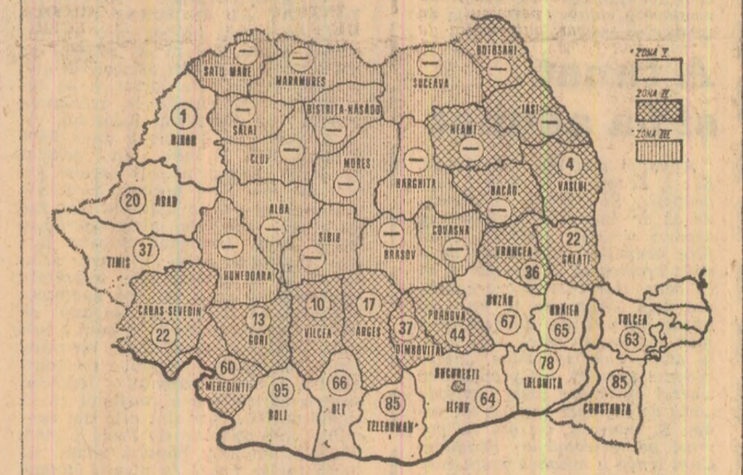
Stadiul recoltării grâului la 17 iulie a.c. Cifrele înscrise pe hartă reprezintă, în procente, suprafețe de pe care s-a strins recolta în cooperativele agricole. (În județele marcate cu o linie nu a început secerișul grâului sau această lucrare abia a demarat).

În aceste zile, oamenii muncii din agricultură depun eforturi sporite pentru a strînge grăbicul recolta de grâu. Datorită bunei organizări a muncii, care a permis folosirea cu randament sporit a combinelor și celorlalte utilaje, numeroase unități agricole situate în cîmpia de sud a țării au încheiat recoltarea grâului, întreaga producție fiind pusă la adăpost. De altfel, pînă ieri, 17 iulie, grîul a fost strîns de pe 828.350 hectare — 37 la sută din suprafața cultivată. Lucrările au intrat în stadiul final în unitățile agricole de stat și cooperatiste din județele Dolj, Teleorman, Ialomița și Constanța.