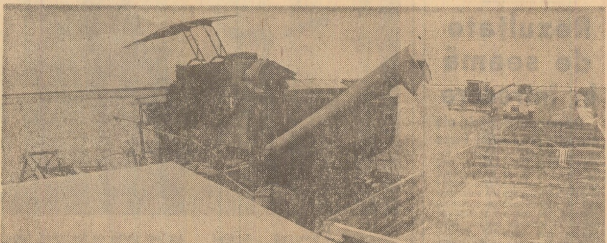
La C.A.P. Ștefan cel Mare, județul Argeș, secerișul avansează rapid.

Aceste cifre ilustrează hărnicia, dăruirea mecanizatorilor, cooperatorilor și specialiștilor, care nu precupețesc nici un efort pentru a strânge la timp și fără pierderi recolta. De-a lungul unui traseu de peste 300 km prin unități agricole argeșene, am consemnat numeroase fapte de muncă, acțiuni și inițiative pentru grăbirea lucrărilor.