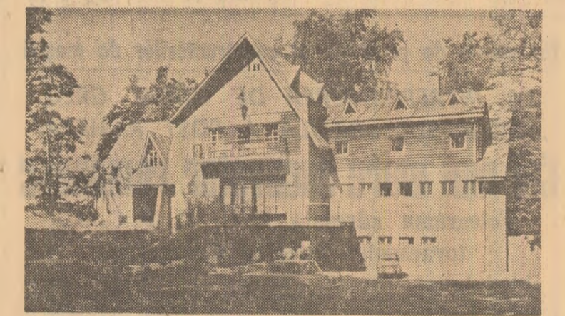
Unități turistice maramureșene

În ultimii ani, cooperatia de consum maramureșeană, ca și din alte județe ale țării, a construit și amenajat atrăgătoare unități turistice, locuri de popas și reconfigurate pentru petrecerea zilelor de vacanță. La numai 25 km de Baia Mare pe soseaua națională ce duce spre Sighetu Marmatiei se află elegantul han „Pintea Viteazul”. Amplasat într-un decor natural de răz mureșete, pe muntele Crăi, la 1 000 metri altitudine, hanul oferă — în orice anotimp — condiții bune de odihnă și confort (camere cu încălzire centrală și restaurant).