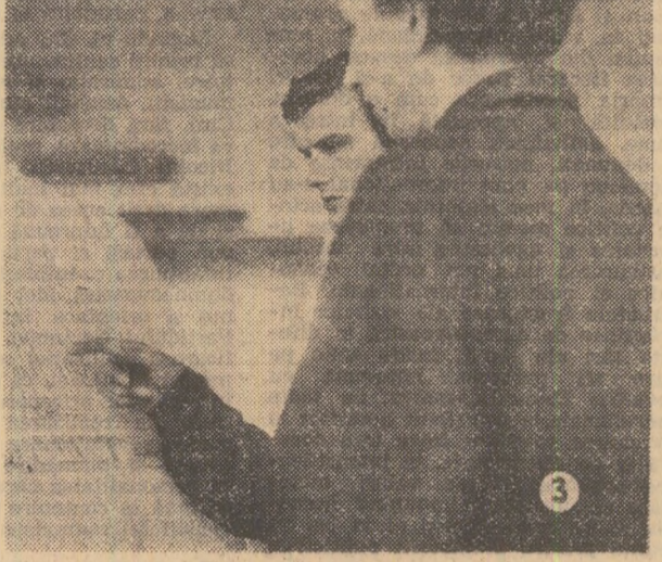
Fotoreportaj de Mihai CARANFIL