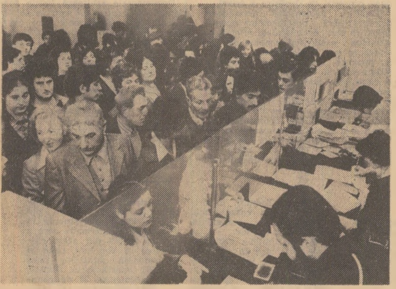
Numarul somerilor in Italia — ca si in alte tari occidentale — este in continua crestere, atingind in prezent, potrivit relatarilor oficiale, peste 1.500.000. Numal in orasul Torino exista 27.000 muncitori fara lucru, din care 60 la suta sint femei. In imagine: someri din Torino, lipsiti, ca si ceilalti oameni ai muncii din tarile capitaliste zilnic de drumuri, de cel mai elementar drept al omului — dreptul la muncă, se inghesuie in fata unui oficiu de plasare, in speranta ca vor putea gasi un post liber