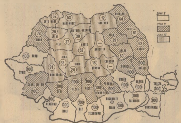
Cifrele înscrise pe hartă reprezintă, în procente, suprafețele de pe care a fost strîns grîul în cooperative agricole (în județele marcate cu o liniuță secerișul nu a început)

Din datele centralizate la Ministerul Agriculturii și Industriei Alimentare rezultă că pînă la 4 august grîul a fost recoltat de pe 95 la sută din suprafețele cultivate în întreprinderile agricole de stat și 80 la sută din cooperativele agricole. A mai rămas de strîns recolta de pe 398 000 ha, situate în centrul și nordul țării. Acum, cînd timpul a devenit frumos, în aceste zone obiectiv central trebuie să-și constituie intensificarea la maximum a secerișului pentru încheierea acestei lucrări în cel mult 3-4 zile. Și trebuie spus că există condiții ca, în aceste județe — printr-o puternică mobilizare a forțelor umane de la sașe, prin folosirea întregii capacități a combinelor din parcul propriu, ca și a celor trimise în ajutor din sudul țării — recoltarea să se încheie cât mai repede, iar producția de grîu să fie pusă în întregime la adăpost.