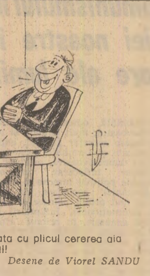
Desene de Violet SANDU