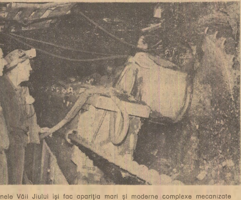
In minele Văii Jiului își fac apariția mari și moderne complexe mecanizate

1944 - AUGUST - 1978 Cărbune! Mai mult cărbune cocsificabil, mai mult cărbune energetic! Acesta este imperativul și sensul a tot ce se întâmplă astăzi în Valea Jiului: vechi și important bazin carbonifer al României, i s-a spus cărbunelui și „piinea industriei” și, desigur, în parte așa este. Cînd, în toamna anului trecut, a fost o vizită de lucru în Valea Jiului (prilej cu care minierii i-au acordat titlul de „Miner de onoare al Văii Jiului”), tovarășul Nicolae Ceaușescu a spus: „Dorim ca prin urgentarea mecanizării lucrărilor, prin introducerea utilajelor complexe, de mare productivitate, să ușurăm munca minerilor, să îmbunătățim condițiile de muncă în general și, totodată, să asigurăm o creștere mai accentuată a productivității și sporirea producției de cărbune, de care patria noastră are nevoie, pentru dezvoltarea sa economică și socială”.