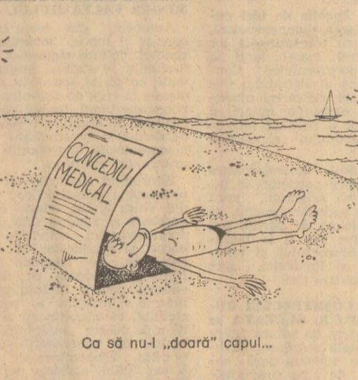
Ca să nu-l „doară” capul...

Gherman BUJOR osefer popular, maistrul la întreprinderea de produse refractare Alba Iulia