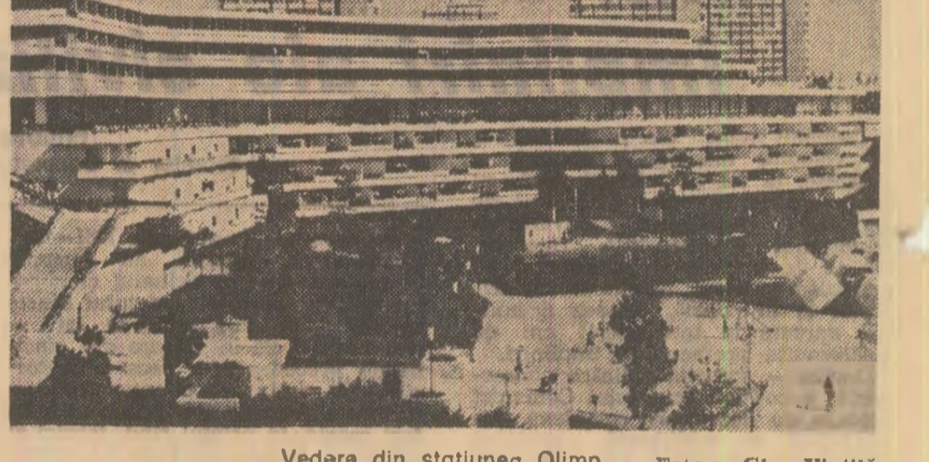
Vedere din stațiunea Olimp

Care sînt afecțiunile care se pot trata pe litoral și unde se asigură acest tratament ?