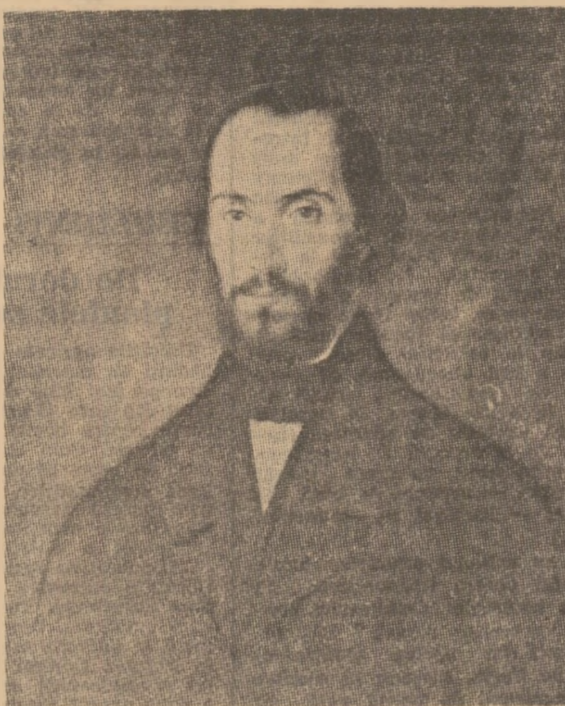
Gheorghe Tattarescu; NICOLAE BALCESCU