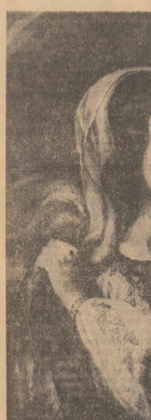
„Nu pot să creez decât figuri eroice, nobile și blinde în același timp” - marturisise pictorul C. D. Rosenthal...