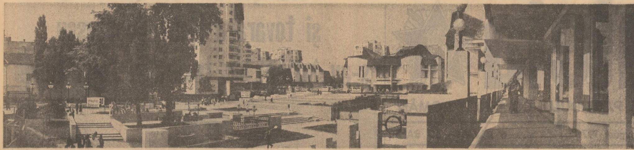
Plaza teatrului - carte de vizită elocventă pentru viața spirituală de azi a municipiului Tg. Mureș