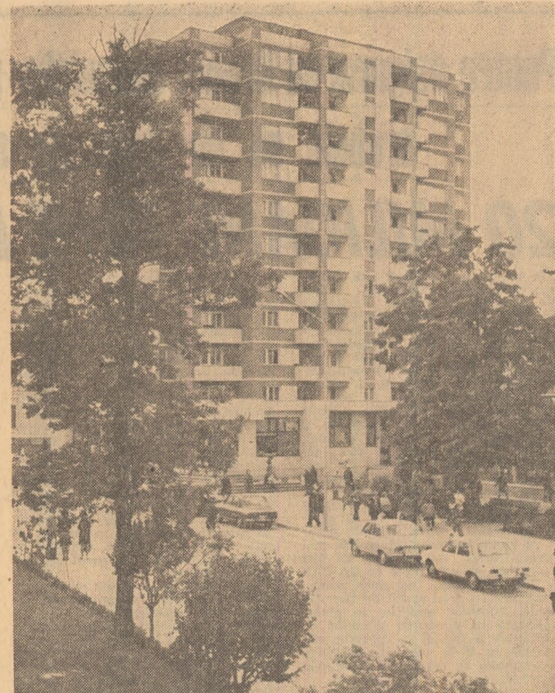
Imagine din noul peisaj urbanistic al municipiului Botoșani.

Angajate în întrecerea socialistă pentru îndeplinirea și depășirea planului de producție și a angajamentelor asumate pe anul 1978, colectivele unităților industriale din județul Suceava au realizat sarcinile pe opt luni. Ca urmare a avansului de șase zile, se va realiza suplimentar, pînă la sfîrșitul acestui luni, o producție industrială în valoare de 220 milioane lei și o producție netă de 56 milioane lei. Producția fizică, peste plan se va concretiza, printre altele, în aproape 8 000 tone minerale de mangan, mașini-unelte pentru așchieria metalelor în valoare de 20 milioane lei, peste 26 000 mc cherestea, mobilă în valoare de 4,7 milioane lei și 13 000 mp binale, 350 tone conserve din carne și 35 tone brînzetur. (Gh. Parascan).