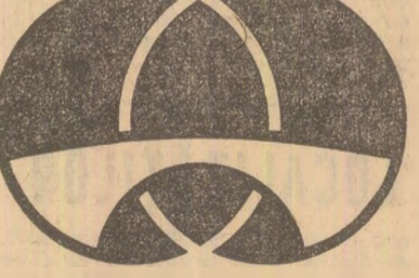
Emblema conferinței: o punte cu două simboluri regnurile amfiteroale sudice în care sînt situate majoritatea țărilor în curs de dezvoltare

Subliniind însemnătatea primordiale a efortului propriu al fiecărei națiuni, țara noastră consideră că