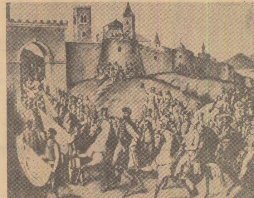
CONSTANTIN LECCA: Intrarea lui Mihai Viteazul în Alba Iulia

drul acestei societăți și, mai ales, necer să trăim în deplină armonie cu o astfel de înțelegere. De aceea cu socot că aspectul cel mai important al răspunderii față de realizarea neabătută a marilor idealuri ale poporului nostru constă în a-l ajuta pe om să-și formeze o concepție comunistă despre viață, pe baza căreia el să simtă, să înțeleagă și să acționeze. Atît marile opere ale dramaturgiei clasice și contemporane, cit și acelea ale dramaturgiei naționale ne pot stimula și îndemna pentru a deveni creatori conștienți ai propriei noastre vieți. O clipă înălțătoare trăită în cadrul unui spectacol nu este numai o mare bucurie sufletească, dar și un astfel de îndemn.