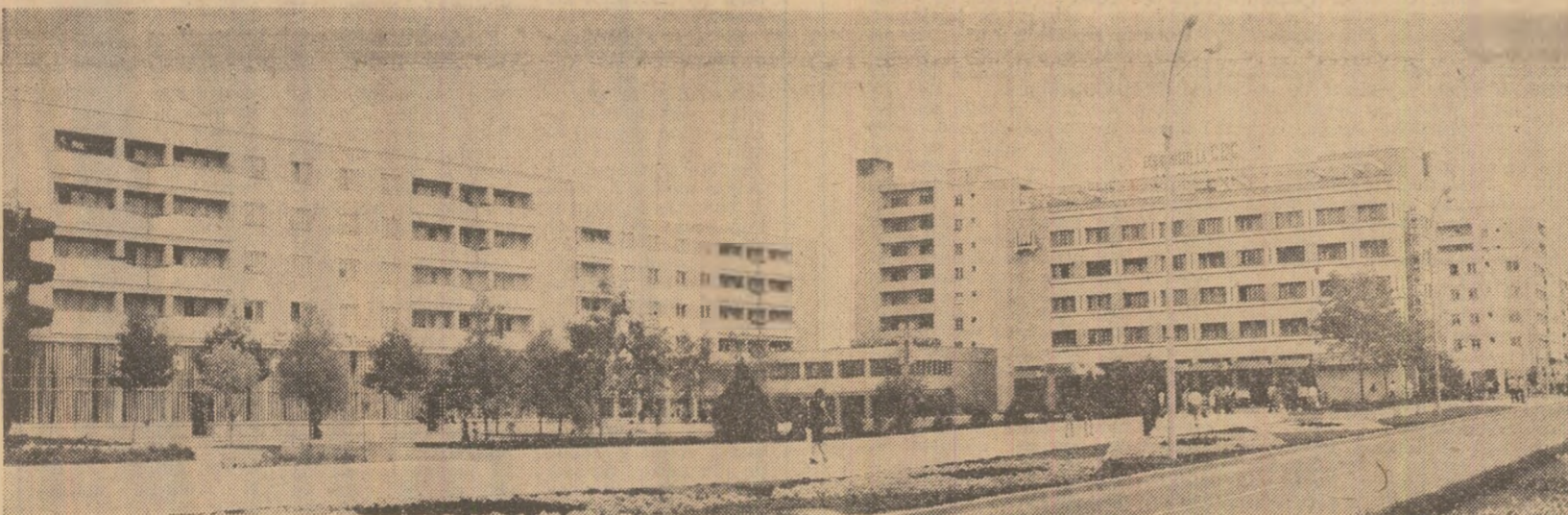
Urbanistica nouă la Birlad

Rețeaua sanitară din județul Bacău, care cuprinde 8 spitale și 110 dispensare urbane și rurale, s-a îmbogățit cu o nouă unitate. Recent a fost dat în folosință, la Buhuși, un spital modern cu 250 de paturi și o policlinică. În cele șapte secții ale noului edificiu sanitar și în cele 15 cabinete ale policlinicii, înzestrate cu aparatură de specialitate la nivelul cerințelor actuale, își desfășoară activitatea peste 200 de cadre medicale. Noi unități sanitare au fost date în funcțiune, în ultima vreme, și în orașul Bacău, în comunele Berești-Bistrița și Măgurești (Gh. Baltă).