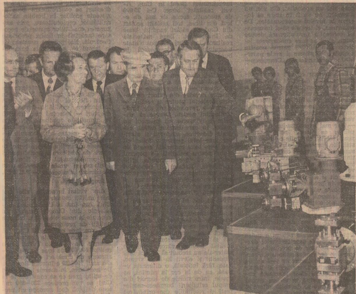
Vizitînd viltoarele spații de producție ale celui mai mare obiectiv industrial din municipiul Cluj-Napoca