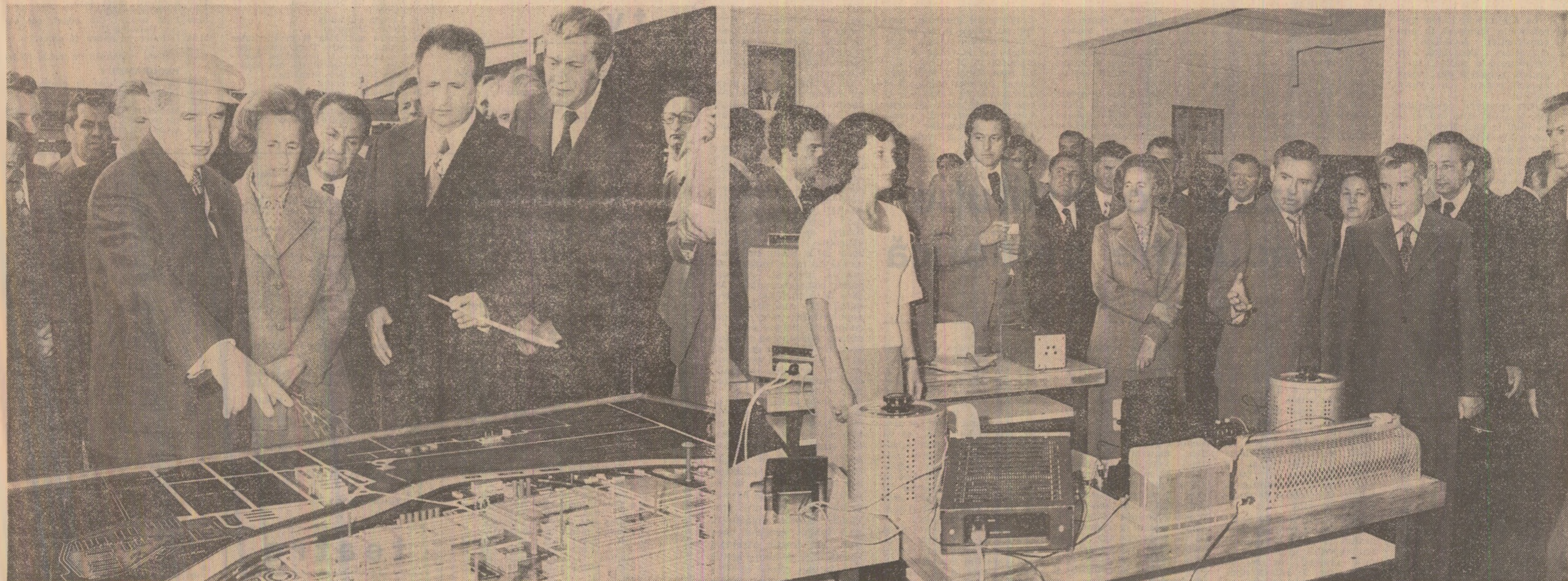
În fața machetei Combinatului de utilaj greu, a cărui construcție înalță în ritm rapid

Toți cei prezenți la marele miting din Cluj ovălionază, într-o atmosferă de vibrant entuziasm, pentru Partidul Comunist Român, pentru Comitetul său Central, pentru secretarul general al partidului și președintele Republicii Socialiste România, tovarășul Nicolae Ceaușescu.