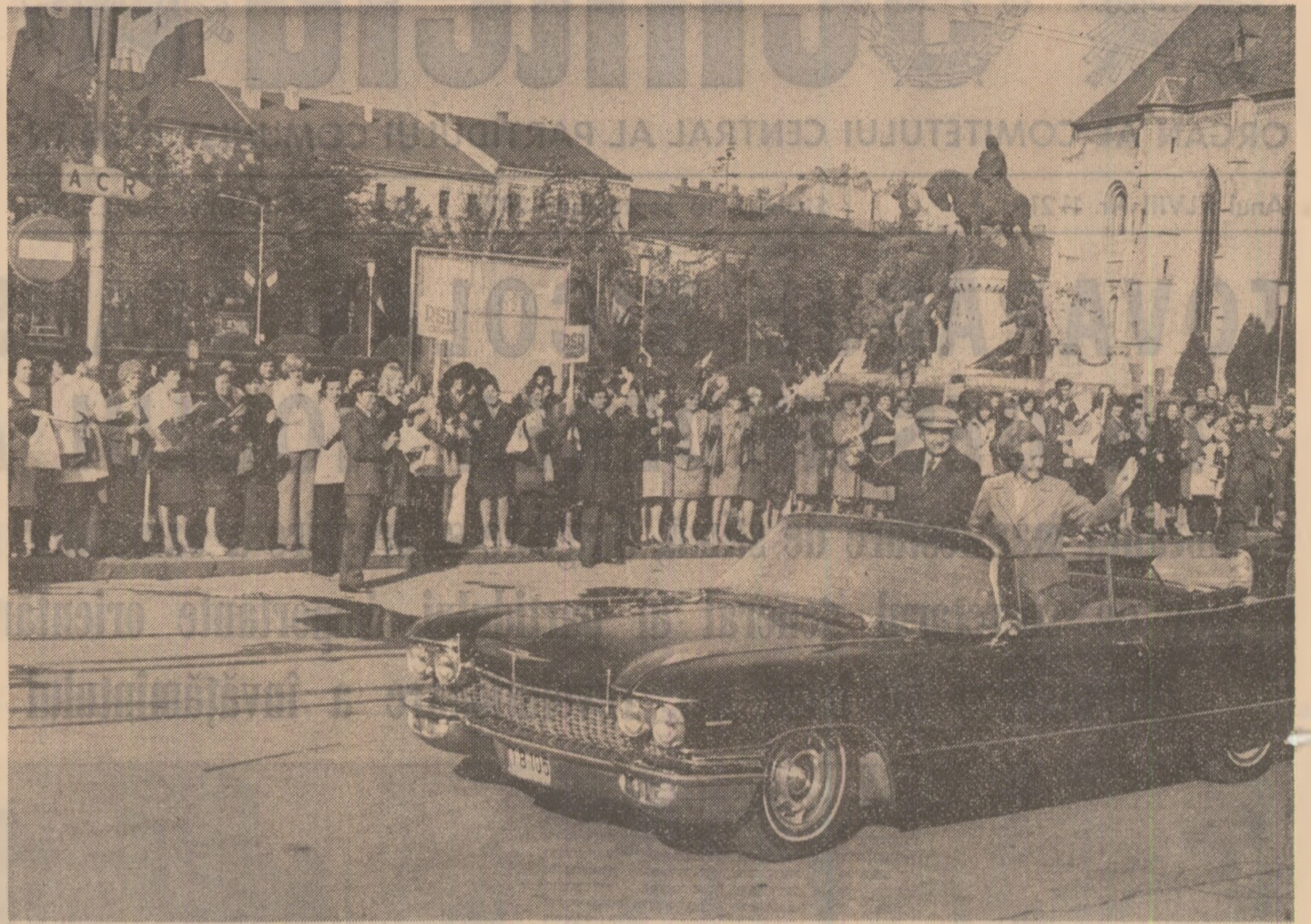
Pe străzile municipiului, mii de locuitori întîmpină cu bucurie și entuziasm pe tovarășul Nicolae Ceaușescu și pe tovarășa Elena Ceaușescu

de ansamblu a elevilor, pentru ca după absolvire toți tinerii să poată face față cu deplin succes tuturor solicitărilor specifice producției noastre moderne. În continuare, secretarul general al partidului și se infățișează cîteva date semnificative pentru dezvoltarea învățămîntului general și liceal în județul Cluj. Comparativ cu anul 1938-1939, numărul școlilor de toate gradele s-a dublat, iar numărul elevilor a crescut de peste trei