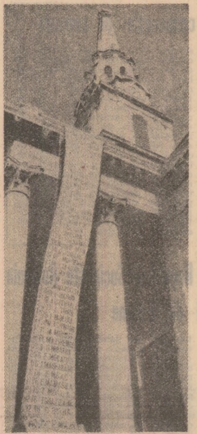
Implinirea unui an de la moartea cunoscutului militant de culoare din Republica Sud-Africană, Steve Biko, a fost comemorată în apropierea parcului londonez Trafalgar Square prin arborarea unui steag lung, pe care erau scrise numele lui Biko și ale altor 50 de patrioți suprimați prin torturi în închisorile rasistilor sud-africani

să devină elementele decisive și principale ale ordinii mondiale”, se arată în raport. În continuare se subliniază necesitatea utilizării depline și eficiente a Organizației Națiunilor Unite pentru aplanarea și soluționarea problemelor explozive din diverse zone ale lumii. Referindu-se la sesiunea specială a Adunării Generale a O.N.U. consacrată dezarmării, raportul apreciază că s-a pus o temelie bună pentru viitoarele eforturi în domeniul dezarmării, dar se adaugă că succesul în sine al sesiunii nu este suficient, el trebuie să fie nu sfîrșitul, ci începutul unei noi faze în eforturile O.N.U. în direcția dezarmării. Referitor la situația din Orientul Mijlociu, secretarul general al O.N.U. consideră „esențial ca toate părțile interesate să participe împreună, într-un efort comun, la găsirea unei căi spre o reglementare justă și durabilă”. Citînd priveste situația din sudul continentului african, raportul salută progresul spre stabilirea unui stat independent al poporului namibian. Se exprimă, în același timp, îngrijorarea față de evoluțiile în cazul Rhodesiei și față de refuzul regimului sud-african de a abandona discriminarea rasială instituționalizată. Ciprul, menționază, de asemenea, raportul, este o problemă care poate fi soluționată prin negocieri pasnice.