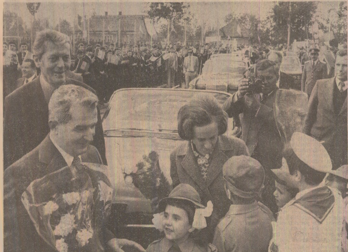
Copiii Clujului, școlii ai patriei, pionieri, uteciști nu vor uita aceste clipe de mare bucurie și emoție