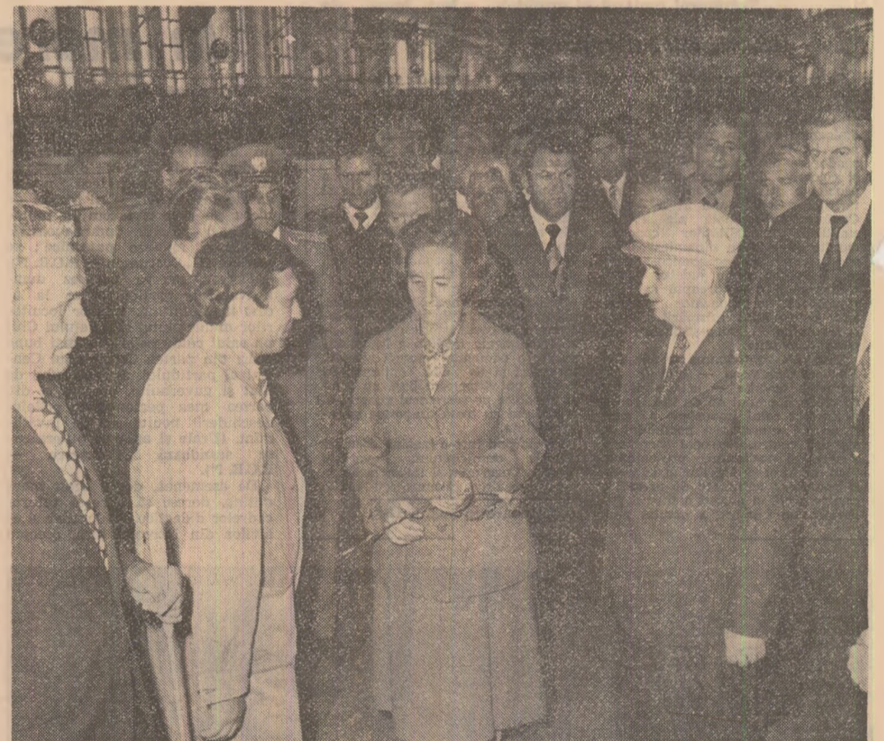
La întreprinderea „Unirea", moment emoționant pentru marele colectiv muncitoresc

instalațiile împotriva supratensiunilor atmosferice, tablourile de distribuție de joasă tensiune, al căror beneficiar sînt 8 întreprinderi industriale din județ și municipiul Cluj-Napoca. În încheierea vizitei, secretarul general al partidului a urat copului profesoral, elevilor noi succese în integrarea învățămîntului cu producția pentru perfecționarea calitativă a întregului proces de formare a cadrelor.