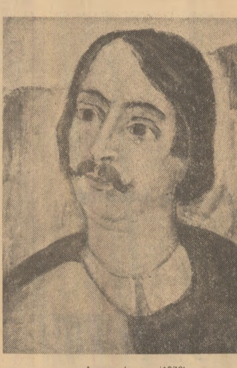
Avram Iancu (1976)

Manifestările de artă populară ale acestei zone, observate critic de către Vasile Drăguț, în amplul studiu monografic ce constituie prefata catalogului, „evită exuberanțele, povestirile și a căluză liniă asemenea Muresului în zilele înșirate de vară — cîntecele sint reținute și pară înțoarse spre sine, iar jocurile sint măsurate și solemne precum un ritual”.