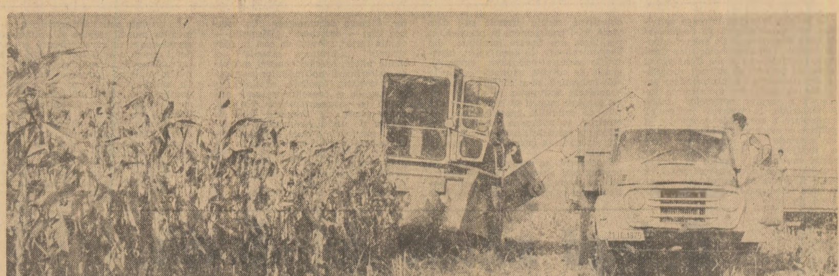
Recoltarea porumbului pe terenurile I.A.S. Urziceni, județul Ilfov