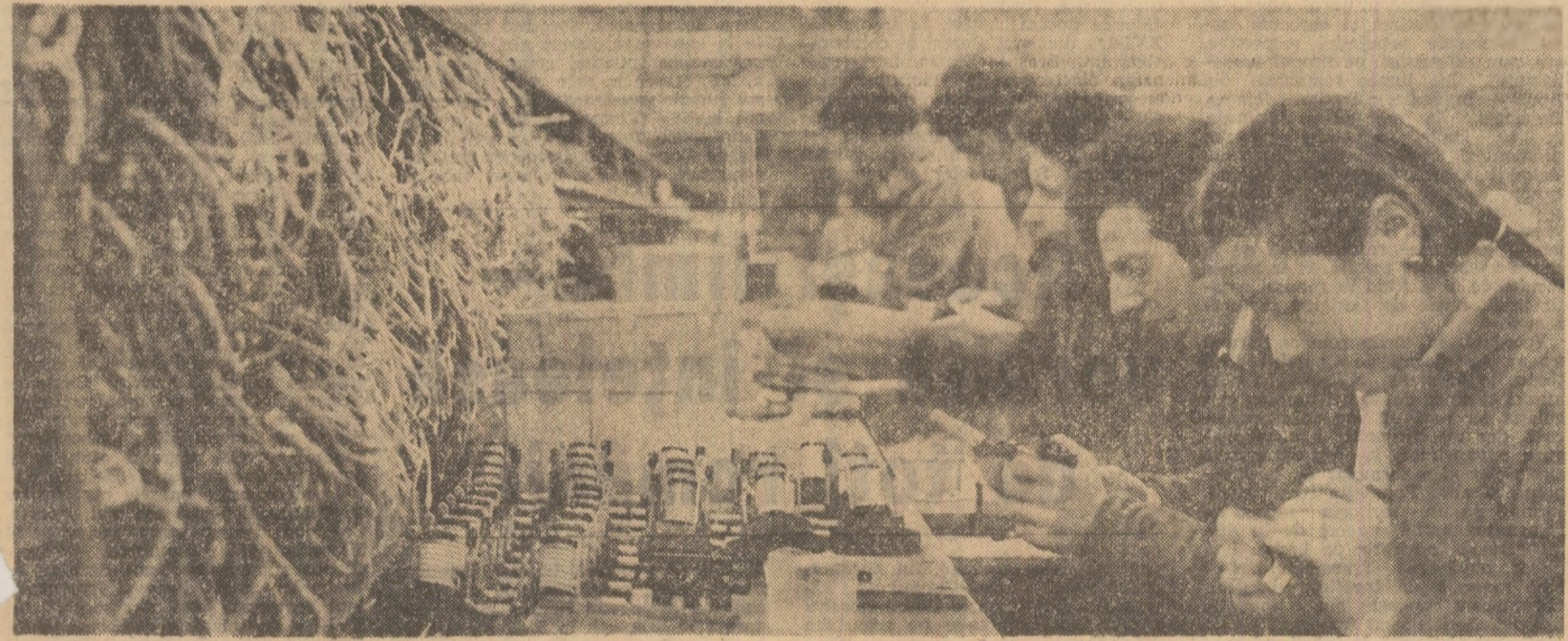
Muni îndemnatice la întreprinderea „Electrocontact” din Botoșani