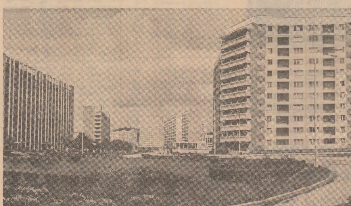
Reșița de azi, orașul siderurgicilor și constructorilor de mașini, cunoaște o dezvoltare editară fără precedent.

Energeticienii hidrocentralelor Portile de Fier au ridicat, joi, la 270 milioane kilowatt-ora producția obținută peste plan, cantitate ce intruce pe cea prevăzută în angajamentul anual. Succesul are la bază preocuparea specialiștilor și a muncitorilor pentru folosirea agregatorilor la capacitatea planificată, fapt concretizat în depășirea graficului de putere cu echivalentul unui agregat de 80 MW.