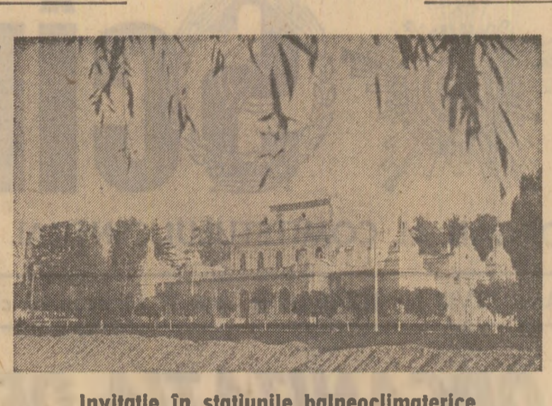
Invitație în stațiunile balneoclimaterice

Comitetul de femei din sectorul din direcția distribuției produselor din Ministerul Comerțului Interior au organizat o interesantă întâlnire între producătorii de articole de uz casnic, reprezentanții comerțului și un mare număr de femei active în diferite domenii de activitate. Scopul întâlnirii: prezentarea unor produse noi, realizate de industrie și cooperata mesteșugărească pentru a ușura munca în gospodărie. Specialiștii din comerț au făcut cunoscute invitelor o serie de ustensile electrice — oale, grătore, rîșnițe etc. — care redau timpul necesar pregătirii anumitor mâncăruri la doar cîteva minute. Alături de această categorie de ustensile casnice au fost înfățișate și altele mai mici și mai modeste, dar la fel de utile, ce fac mai