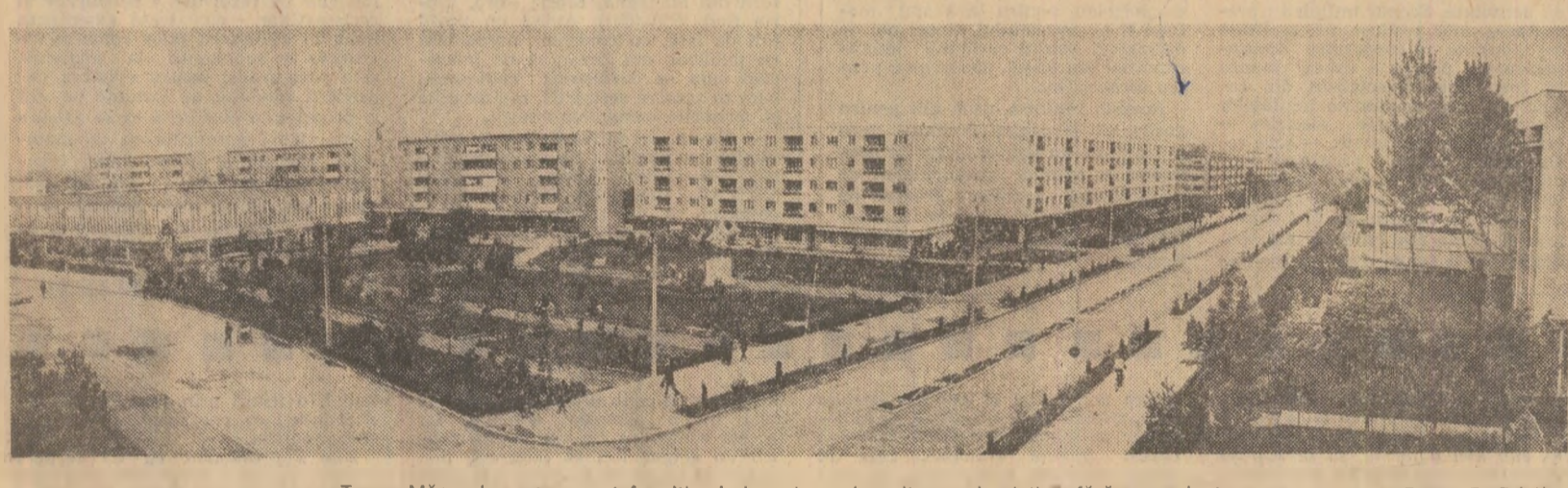
Turnu Măgurele a cunoscut în ultimul deceniu o dezvoltare urbanistică fără precedent.

Un moment nou. În expunerea tovarășului Nicolae Ceaușescu se găsește o apreciere pozitivă a rezultatelor sesiunii speciale a O.N.U., care au subliniat că, odată cu terminarea sesiunii, popoarele, forțele care se pronunță pentru cauza dezarmării și păcii își pot diminua eforturile. Dimpotrivă, se impune, mai mult ca oricând, să depunem eforturi și mai susținute pe plan internațional pentru trecerea la dezarmare.