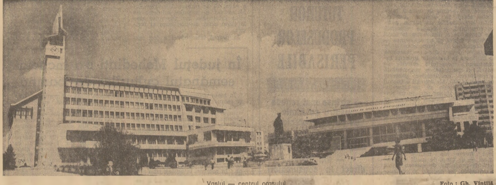
Vaslui — centrul orașului