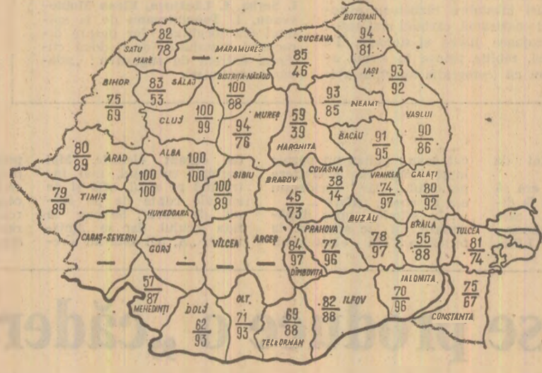
Cifrele înscrise pe hartă reprezintă, în procente, suprafețele de pe care s-a strâns recolta de sfeclă de zahăr la 27 octombrie (sus) și cantitățile transportate față de cele recoltate (jos).

COMANDAMENTELE LOCALE, CONDUCERILE COOPERATIVELOR AGRICOLE ȘI REPREZENTANȚII FABRICILOR DE ZAHĂR AU DATORIA SĂ ACȚIONEZE FERM ÎN VEDEREA UTILIZĂRII TUTUROR UTILAJELOR MECANICE ȘI MOBILIZĂRII COOPERATORILOR PENTRU A SE ÎNCHEIA GRABNIC RECOLTAREA SFECLEI DE ZAHĂR, IAR TRANSPORTUL ȘI DEPOZITAREA RĂDĂCINILOR SĂ SE FACĂ REPEDE ȘI CU CEA MAI MARE RESPONSABILITATE, ASTFEL ÎNCIT SĂ NU SE PIARDĂ NIMIC DIN RECOLTA ACESTUI AN.