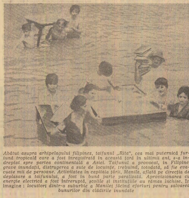
Abătu asupra arhipelagului filipinez, taifunul „Rita”, cea mai puternică furtună tropicală care a fost înregistrată în această țară în ultimii ani, s-a îndreptat spre partea continentală a Asiei. Taifunul a provocat, în Filipine, grave inundații, distrugerea a sute de locuințe, trebuind, totodată, să fie evacuate mii de persoane. Activitatea în capitala țării, Manila, aflată de direcția de deplasare a taifunului, a fost în bună parte paralizată. Aproximarea cu energie electrică a fost întreruptă, școlile și instituțiile au rămas închise. În imagine: locuitorii dintr-o suburbie a Manilei făcînd eforturi pentru salvarea banurilor din clădirile inundaate

Campania electorală reliefează nu numai existența unor dispute între Casa Albă și Congres, ci și numeroase alte aspecte, în special de ordin economic și social. În acest context se înscriu datele oficiale care arată o creștere a producției industriale în septembrie de 0,5 la sută, însoțită de o oarecare temperare a creșterii prețurilor și somajului. De altfel, ca o ilustrare a preocupării deosebite a autorităților americane pentru această din urmă problemă, vineri s-a anunțat că președintele S.U.A., Jimmy Carter, a semnat legea Humphrey-Hawkins, privind combaterea somajului; în virtutea acestei legi, somajul ar urma să fie redus de la 6 la 5 la sută, cit și în prezent, la 4 la sută, pînă în 1983. În schimb, dolarul nu „se simte deloc bine” — după expresia revistei „U. S. News and World Report”. Pe piața monetară internațională, dolarul a înregistrat, chiar zilele acestea, noi scăderi față de marca vest-germană și de yenul japonez (1,77 mărci vest-germane și, respectiv, 180 yeni pentru un dolar). Persistența fenomenului inflaționist a determinat de altfel hotărîrea președintelui Carter de a face cunoscute detaliile unui nou program de combatere a inflației, fenomen care afectează atât de serios viața economică. N. PLOEANU New York