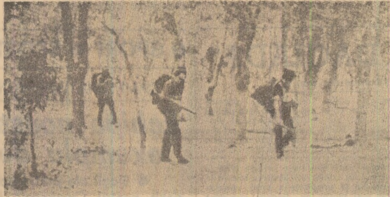
Trope invadatoare ale regimului rasist de la Salisbury au atacat, în Zambia, așezări de refugiați zimbabwwe, provocînd moartea a numeroase persoane nevinovate

Cei doi președinți și-au exprimat dorința de a contribui la întărirea mișcărilor țărilor nealiniate și s-au pronunțat pentru instaurarea unei noi ordini economice internaționale.