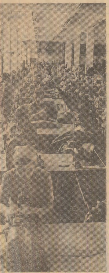
Ținere muncitoare din atelierul de confecții al întreprinderii din Botoșani.