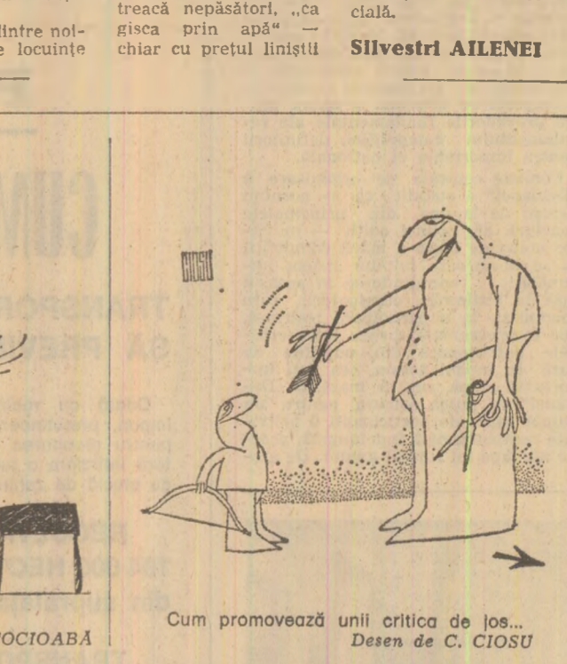
Cum promovază unii critica de jos...