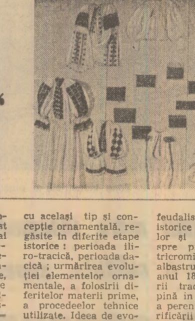
lucie mai cuprinde apoi și interferențele stilistice între arta populară și cea a curțiilor senioresale din

artă populară, folosind drept exemplificări piese din toate zonele etnografice ale țării — selectate în funcție de măsura în care acestea ilustrează și demonstrează mai bine problema — și-a propus și să raporteze această valoroasă piesă de port