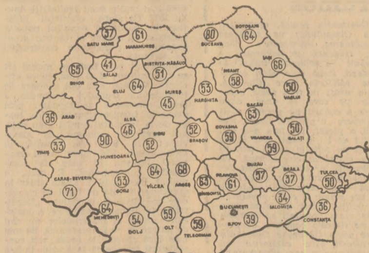
Stadiul executării arăturilor de toamnă, la data de 13 noiembrie. Cifrele înscrise pe hartă reprezintă, în procente, suprafețele arate în cooperativele agricole

Cu toate că în cea mai mare parte a țării condițiile de lucru în cîmp sînt bune, în multe unități agricole și chiar în județe întregi ritmul în care se execută arăturile de toamnă este nesatisfăcător. În cooperativele agricole din județele Timiș, Ialomița, Arad, Constanța, Brăila, Hîrov — județe cu mare pondere în producția de cereale și plante tehnice a țării — nu a fost arată decît o treime din suprafața prevăzută. Aceasta se datorește, în principal, faptului că tractoarele rămase disponibile după terminarea semănăturii și transportului produselor nu au fost concentrate imediat la arături. În cooperativele agricole din