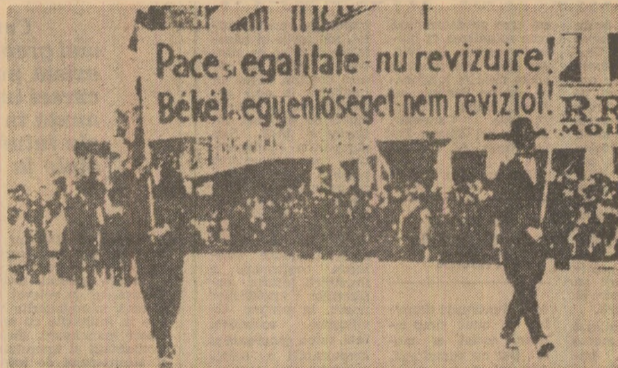
În mai 1939, la Cluj au avut loc mari demonstrații, în cadrul cărora sute de țărani maghiari, mobilizați de Mădoș, au demonstrat sub lozincile: „Pace și egalitate — nu revizuire!” și „Apărînd hotarele României, apărăm pămînturile noastre!”

Pagină realizată de Silviu ACHIM și Paul DOBRESCU