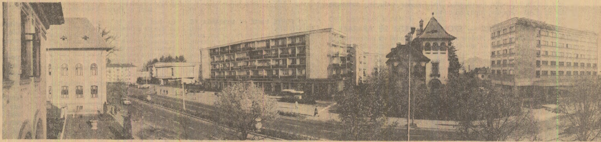
Cimpulung-Argeș: Noile construcții își inscriu geometria în specificul arhitectonic al acestei pitorești localități

Vaste resurse deturnate de la scopurile prosperității economico-sociale. Dezvoltarea economică a statelor este atocîtă considerabil și de pe urma scoaterii (Continuare în pag. a VI-a)