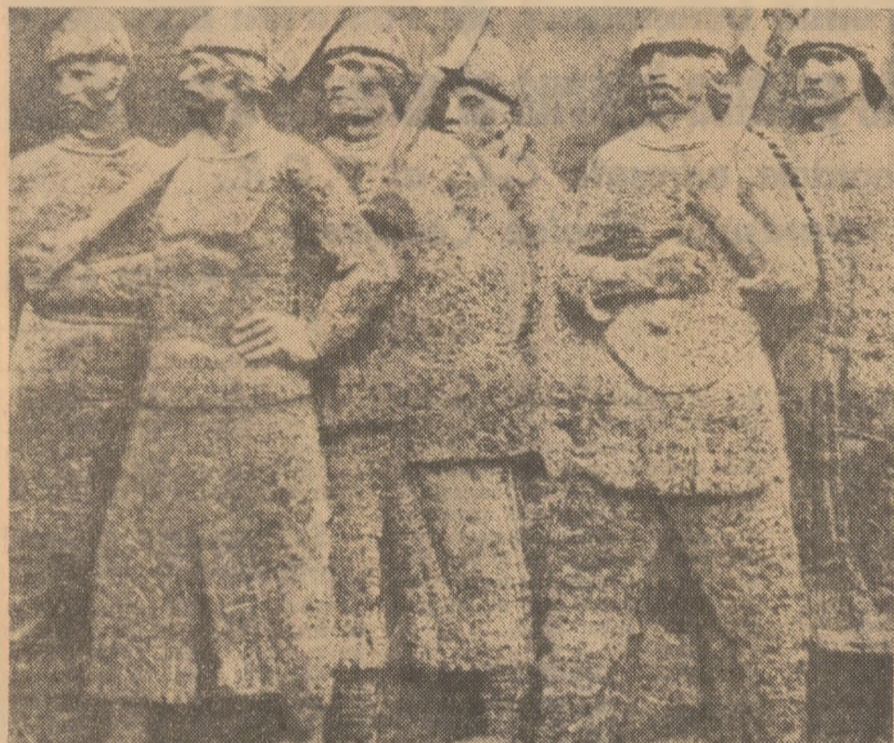
Tărani răsculați în anii 1437—1438 (sculptură de pe monumentul ridicat la Bobilna)

De secole pe meleagurile patriei conviețuiesc în strinsă frăție oameni ai muncii români, maghiari, germani și de alte naționalități; și așa cum împreună au trăit și au muncit de-a lungul veacurilor, s-au ridicat de nenumărate ori împreună în lupta comună împotriva exploatării, pentru împlinirea năzuințelor lor de dreptate și libertate.