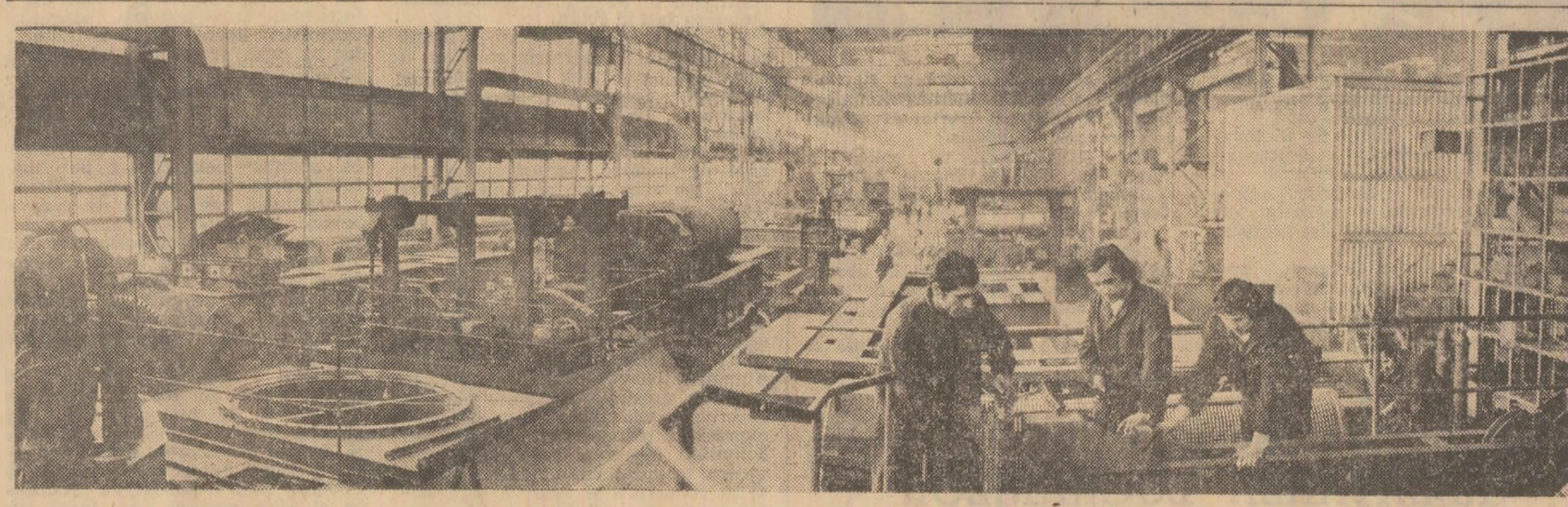
Întreprinderea mecanică din Timișoara: secția de poduri rulante dotată cu utilaje moderne

Anchetă realizată de Dan CONSTANTIN, Alexandru MUREȘAN, Nicolae CATANA