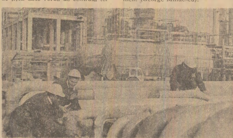
Aspect de pe șantierul platformei petrochimice Midia-Năvodari

Construcții și montajul de pe platforma petrochimică Midia-Năvodari au pus în funcțiune un important obiectiv care precede intrarea în probe tehnologice a rafinăriei, a rezervorului și conductorului liței. Este vorba de centrala termică a platformei, unde a început să producă abur cel de-al doilea cazan cu o capacitate de 100 de tone. Noua capacitate a intrat în producție cu 12 zile înainte de termen. (George Mihăescu).