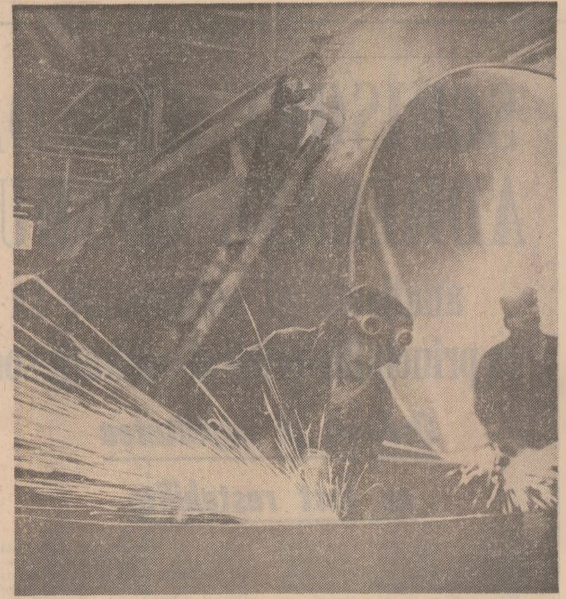
În secția cazangerie grea a întreprinderii de utilaj chimic „Grivița roșie” din Capitală.