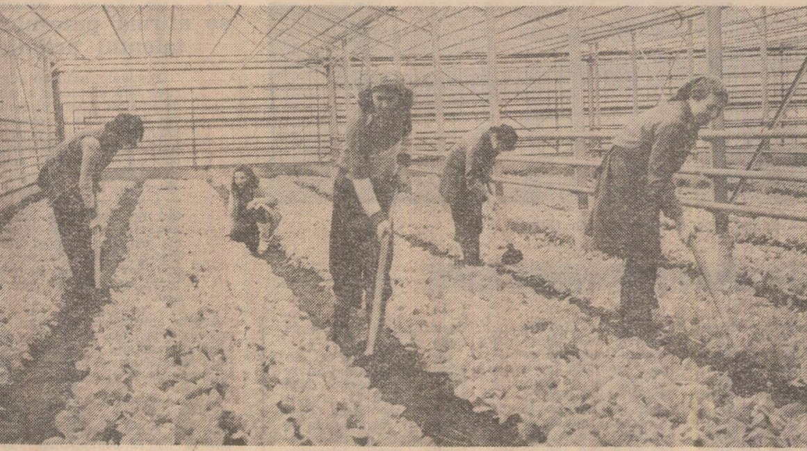
Pe lângă flori, întreprinderea de sere Codlea, judeţul Braşov, livrează pentru aprovizionarea populaţiei însemnate cantităţi de legume. În fotografie: un aspect din timpul lucrărilor de întreţinere la culturile de salată din seră.