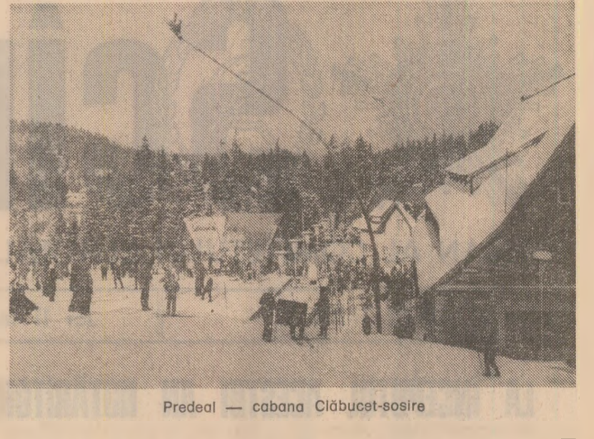
Predeal — cabana Clăbucet-sosire