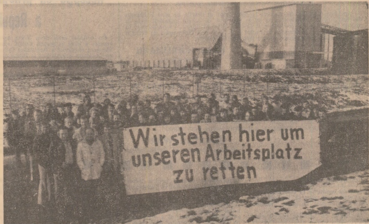
„Ne aflăm aci pentru a ne apăra locul de muncă” — stă scris pe uriașă pancartă pe care o poartă muncitorii fabricii de îngrășminte artificiale „Beker Chemie” din Brake (R.F.G.); ei au hotărît să ocupe întreprinderea, amenințată cu lichidarea, și să-și apere în acest fel locul de muncă. Filială a concernului american „Beker”, firma avea obligația morală de a asigura un loc de muncă stabil salariații, intrucît primise din fondurile publice, respectiv din impozitele contribuabililor, subvenții în valoare de 4,8 milioane mărci pentru dezvoltarea producției. În ciuda acestui fapt, patronii, nesatisfăcuți cu beneficiile obținute, au decis închiderea fabricii

Postul de radio iranian a mai anunțat că lucrătorii de la rafinăria de petrol din Teheran, Shiraz, Tabriz și Kermanshah și-au reluat miercuri activitatea, relatează agenția France Presse.