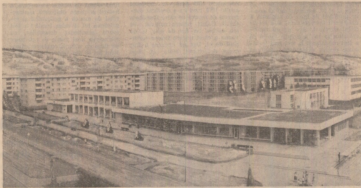
Motru — primul oraș al minerilor din Oltenia

Pentru creșterea producției de cărbune. Din noul abataj frontal de mare capacitate de la Întreprinderea minieră Bărbănteni s-au scos primele cantități de cărbune acum. Extracția stă și în secele Paroseni se munceste intens pentru deschiderea unui abataj cu front lung de lucru, prevăzut cu un complex de mecanizare a operațiilor de susținere a lucrărilor miniere și de tăiere a cărbunelui. (Sabin Cerbu).