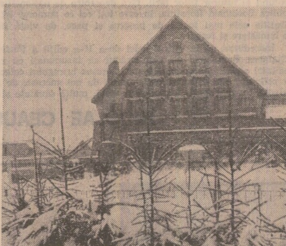
În fotografiile: Hanul „Urșul Negru” din Sovata (stînga) și o ilustrație de la Borșa (dreapta)

Locuri de popas. Unități turistice ale cooperăției de consum asigură, în cele mai pitorești zone ale țării, camere confortabile, servirea mesei la restaurante care oferă numeroase preparate culinare cu specific tradițional și local. În județul Mureș, un plăcut loc de odihnă și reparații este hanul „Dealul Văntului”, situat într-un cadru natural pitoresc, la 9 km de Tîrgu Mureș, pe șoseaua spre Brașov. De asemenea hanul „Dealul Vîlilor” din Bălăușeri, situat la 21 km de Tîrgu Mureș, la poalele unui deal cu plantații de viță de vie, dispune de camere cu încălzire centrală, iar masa poate fi servită la restaurant. În același județ la intrarea în stațiunea balneoclimaterică Sovata este situat hanul „Urșul Negru”. În județul Cluj, Cabana Buru, aflată la numai 4 km de Chelie Turzii, pe Valea Arișului, este altă unitate a cooperăției de consum, dotată cu încălzire centrală și un restaurant care oferă diferite preparate culinare. (Publicitate).