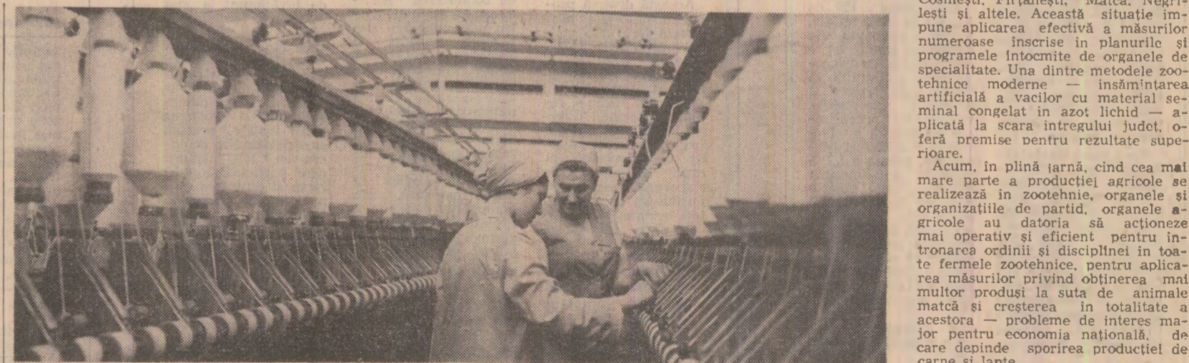
Aspect din secția ringuri a întreprinderii textile „Moldova” din Botoșani.

— Un rol important în creșterea productivității muncii îl are perfecționarea profesională a cadrelor. Și în acest an, ca și în ceilalți ani ai cincinalului, urmează să se prezinte la locul de muncă zeci de mii de oameni calificați în cele mai diverse meserii.