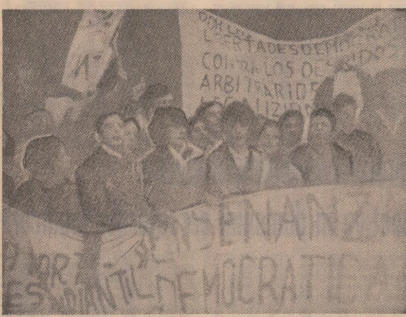
Manifestație studențească la Madrid în sprijinul revendicărilor privind îmbunătățirea situației învățământului