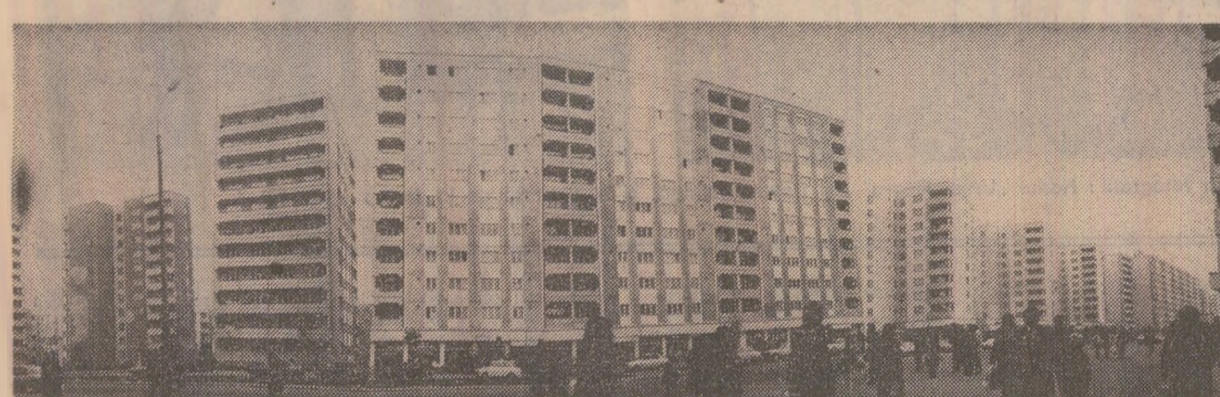
Cartierul 1848 din Tîrgu Mureș — oraș care a cunoscut în ultimii ani o puternică dezvoltare

Astăzi, în jurul orei 12,30, posturile de radio și televiziune vor transmite direct ceremonia sosirii președintelui Republicii Franceze, Valéry Giscard d'Estaing, care, împreună cu doamna Anne-Aymone Giscard d'Estaing, va face, la invitația președintelui Republicii Socialiste România, tovarășul Nicolae Ceaușescu, și a tovarășei Elena Ceaușescu o vizită oficială în țara noastră.