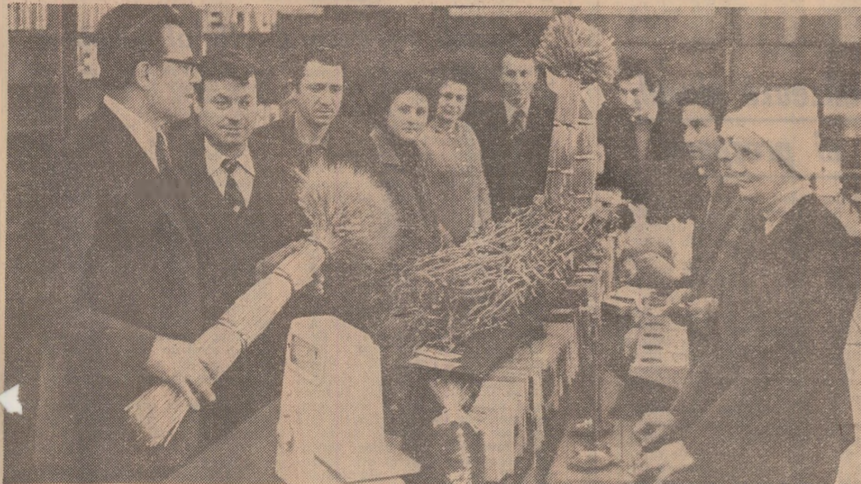
Oră de curs în laboratorul de agrotehnie la Casa agronomului din Timișoara: specialiștii din agricultura județului fac un schimb activ de opinii privind tehnologiile moderne de cultivare a cerealelor