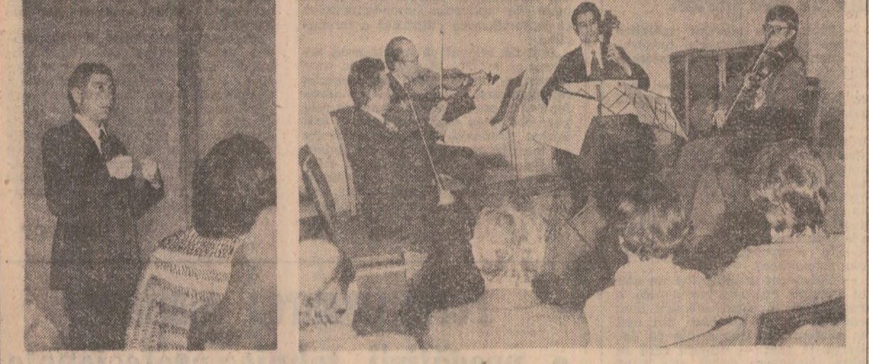
(Urmare din pag. 1)