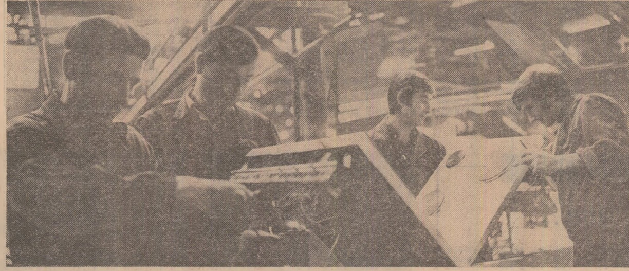
La întreprinderea „23 August“ din Satu Mare, profilată pe producția de mașini cosnice de gătit și încălzit, se acționează, prin măsuri organizatorice eficiente, pentru realizarea ritmică și în condiții de bună calitate a producției. In fotografie: o echipă de muncitori din sectorul de montaj la lucru.