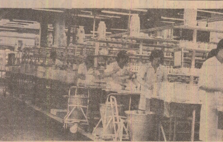
Întreprinderea de porțelan din Alba Iulia — una dintre cele mai moderne unități ale industriei noastre ușoare. În fotografie: un aspect din atelierul turnătorie