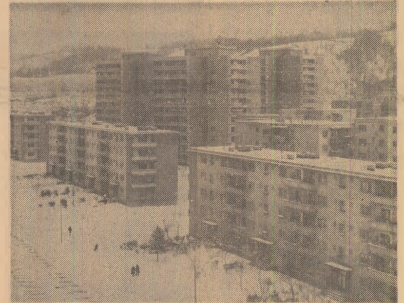
Coroșești — unul din noile cartiere ale orașului Vulcan

Construcții școlare. Tineretul școlar din județul Alba va beneficia în acest an de 96 noi săli de clasă. Tot în 1979 se vor finaliza construcțiile școlare de la Cugir, Izvoru Ampoiului și Berghin. De asemenea, va începe construcția unor edificii școlare noi în orașele Blaj și Cippeni. (Stefan Dinică).