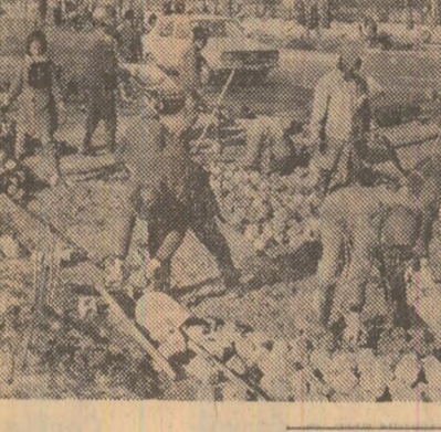
Ca întămare, se fac cu multe reparatîi sînt sute de muncitori reconstruite caldarimul. (Ca în fotografia alăturată).