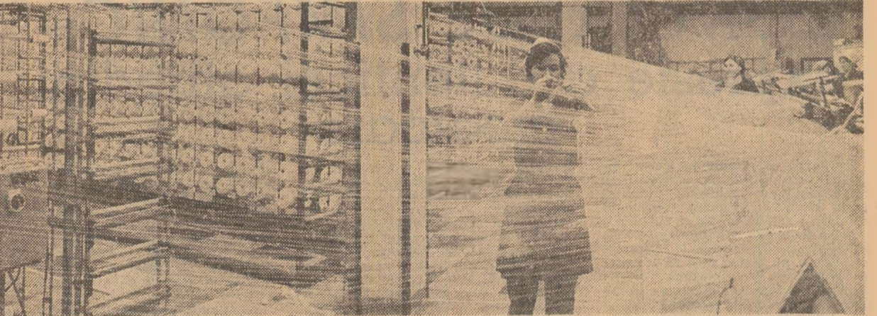
Aspect din secția preparației a întreprinderii „Jesutura” din Iași