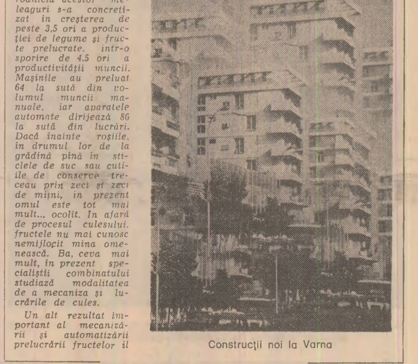
Construcții noi la Varna