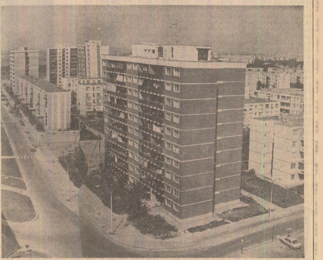
Locuințe moderne în cartierul „Dundrea” din Galați, pentru muncitorii combinatului siderurgic