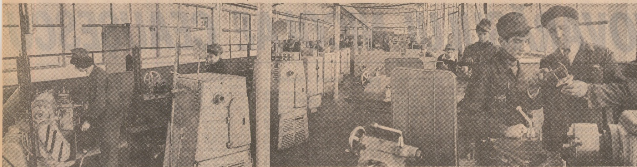
Grupul școlar al întreprinderii mecanice Muscel: viitorii muncitori calificați deprind a.b.c.-ul meseriei în atelierul-școală