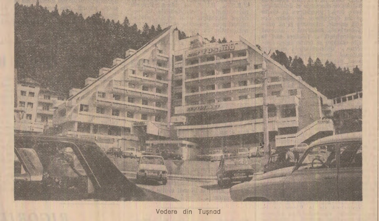
Vedere din Tușnad