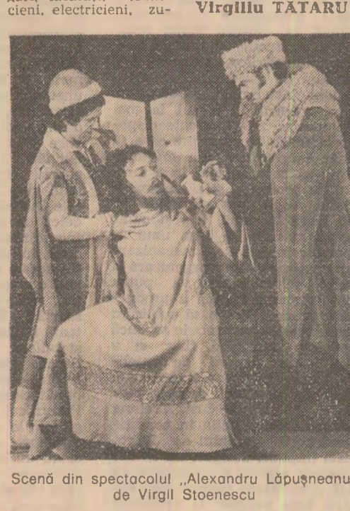
Scenă din spectacolul „Alexandru Lăpușneanu” de Virgil Stoescu