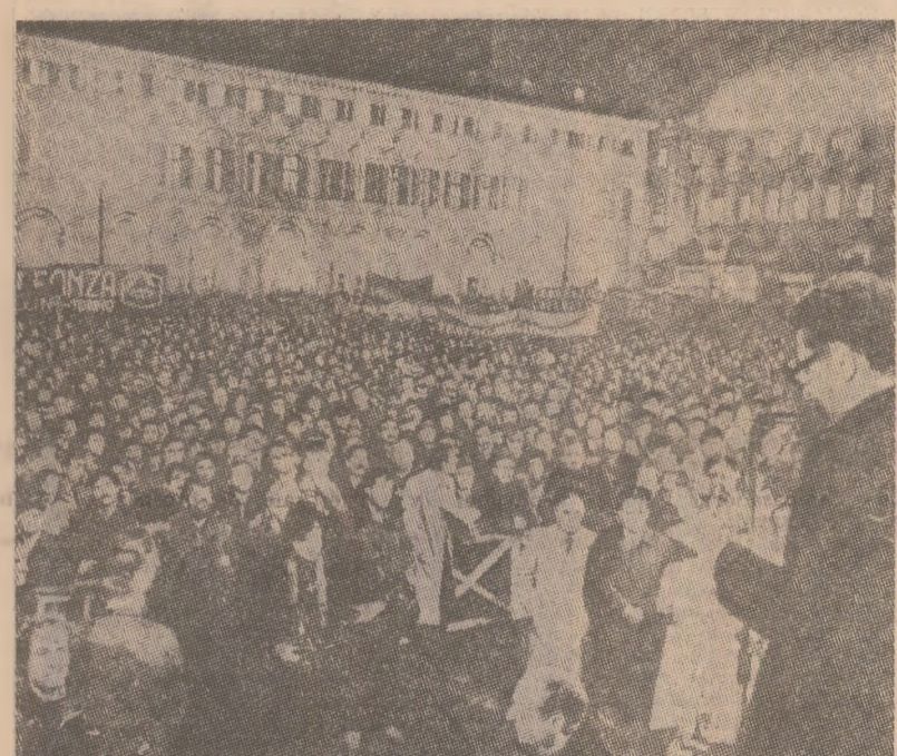
În orașul italian Torino s-a desfășurat, zilele trecute, o mare manifestație populară împotriva recrudescenței atentatelor teroriste

Comisia Pieței comune a hotărât alocarea sumei de 5 milioane unități de cont (o unitate de cont este egală cu 1,33 dolari) pentru finanțarea programelor de cercetări geologice și explorări de noi zăcămine de uraniu pe teritoriul „ceor nouă”. După cum a precizat un purtător de cuvânt al comisiei, realizarea acestor programe vizează ameliorarea situației energetice a Pieței comune.