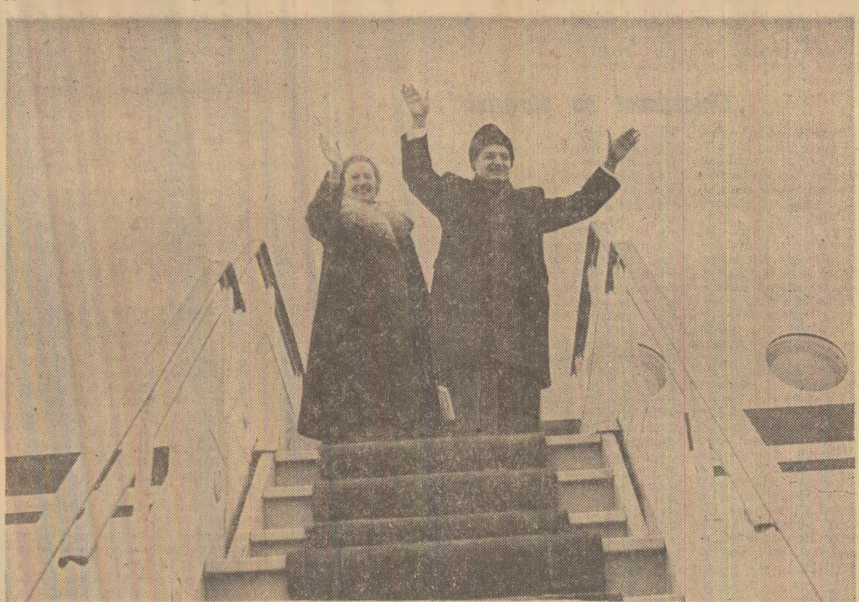
Înainte de decolarea avionului prezidențial

Secretar general al Partidului Comunist Român, Președintele Republicii Socialiste România