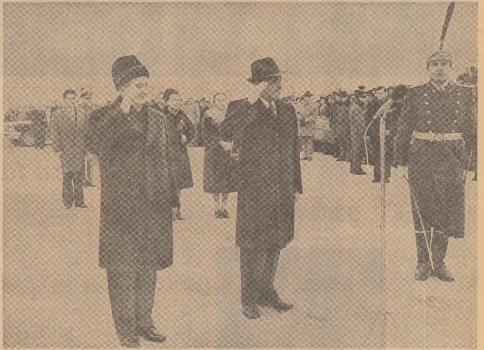
La plecare, pe aeroportul din Voden