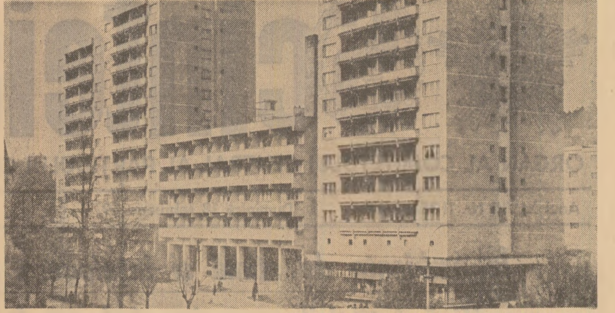
Noul centru civic din Petroșani