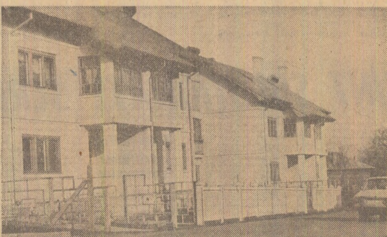
Modernizare la Stoicânești

Și cum să nu se prindă virtos la treabă cooperatorii din Stoicânești? Atestată documentar de peste 500 de ani, această comună din boxata cîmpie a Boianului a fost întotdeauna săracă. Cu 30 de ani în urmă, casele erau din pămînt, iar pe timp de ploaie noroiul ulișelor îl obliga pe oameni, mai ales pe copiii care mergeau la școală, să folosească picioroaie de lemn. Erau realitățile satului românesc de ieri. Realitatea de azi? Mai întii, străzile : bună parte din ele sînt asfaltate, altele pietruite. Casele — mari, cu ferestre luminoase, iar în