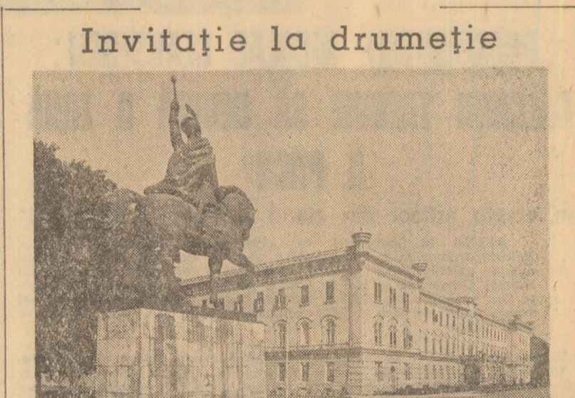
La filialele de turism bucurestene se pot procura bilete pentru excursii organizate cu prilejul zilei de 1 Mai. Avînd o durată de patru zile și jumătate, excursiile prezintă străbaterea celor mai pitorești zone turistice ale țării. Dintre obiectivele ce vor fi vizitate, enumerăm: monumentele istorice din Alba Iulia, sculpturile lui Brâncuși din Tirgu Jiu, zona Porților de Fier

Problemele scrise se vor desfășura, în întreaga țară, la data de 15 aprilie 1979, ora 9, în localitățile reședință de județ, la unitățile de învățămînt stabilite de inspectoratele școlare.