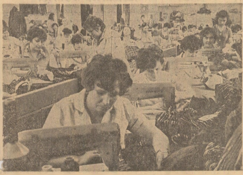
Aspect de muncă la Întreprinderea de confecții „Mondiala” din Satu Mare