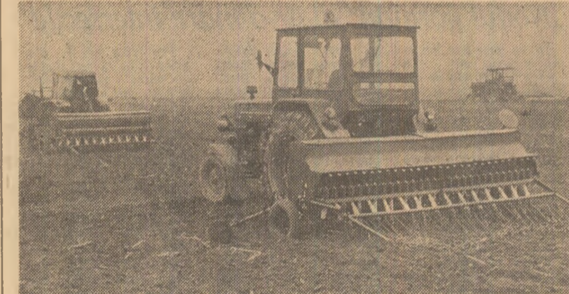
Imediat ce timpul a permis, la cooperativa agricolă Mozaoeni, județul Argeș, a început semănatul mazărei. Se remarca grija specialiștilor pentru organizarea superioară a muncii și pentru executarea în flux a lucrărilor