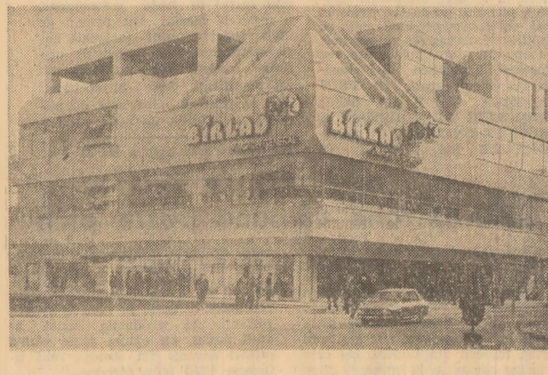
BIRLAD: Un nou și modern magazin

S.M.A. Gottlob poate realiza toate reperele necesare pentru repararea toacărilor de furaje despre care era vorba în nota „A fi recepționat” dar apelul cooperativilor”, publicată în „Șcînteia” nr. 11340.