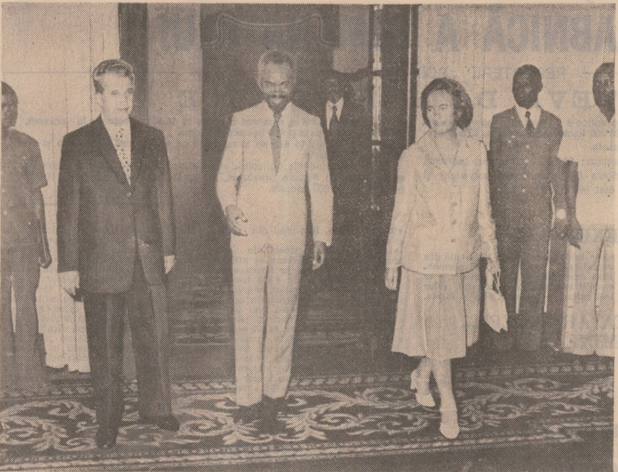
Înaintea convorbirilor oficiale