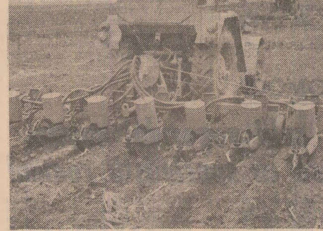
ORA 6. Nu este devreme pentru mecanizatorii de la I.A.S. Pietrolu ca să înceapă semănatul

Multe sînt exemple din județul Ialomița ce dovedesc că mecanizatorii, cooperatorii și specialiștii au înțeles necesitatea de a-și mobiliza toate energiile pentru „comprimarea” timpului și încheierea semănăturii