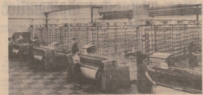
Aspect din secția preparării a întreprinderii textile „Dunăreana” din Giurgiu

Noi obiective industriale în construcție. La Focșani și Panciu au început lucrările de construcție la două noi obiective ale industriei ușoare: fabrica de bumbac cardat și fabrica de tricotate. În prezent, într-un stadiu avansat de execuție se află Întreprinderea integrată de țesături groase Adjud. (Dan Drăgulescu).