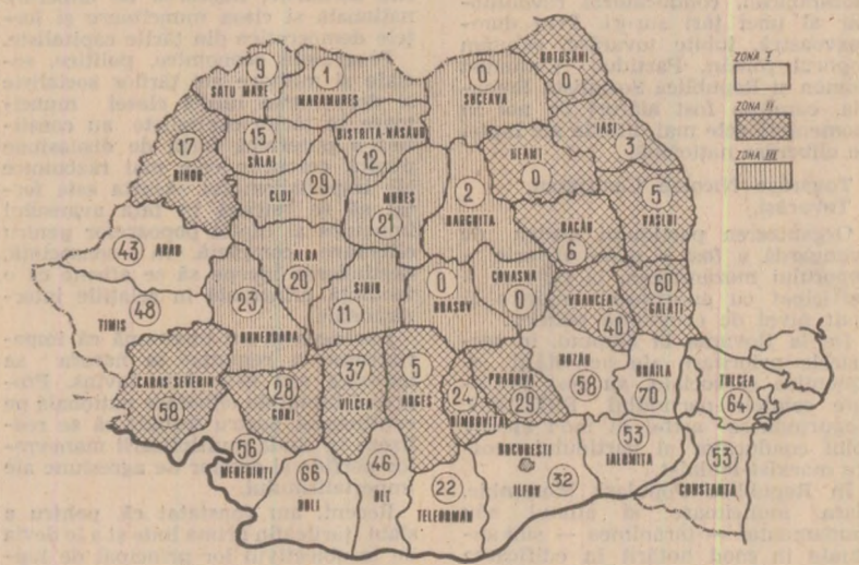
Cifrele înscrise pe harta reprezintă, în procente, suprafețele totale însămîntate cu porumb pînă la 19 aprilie