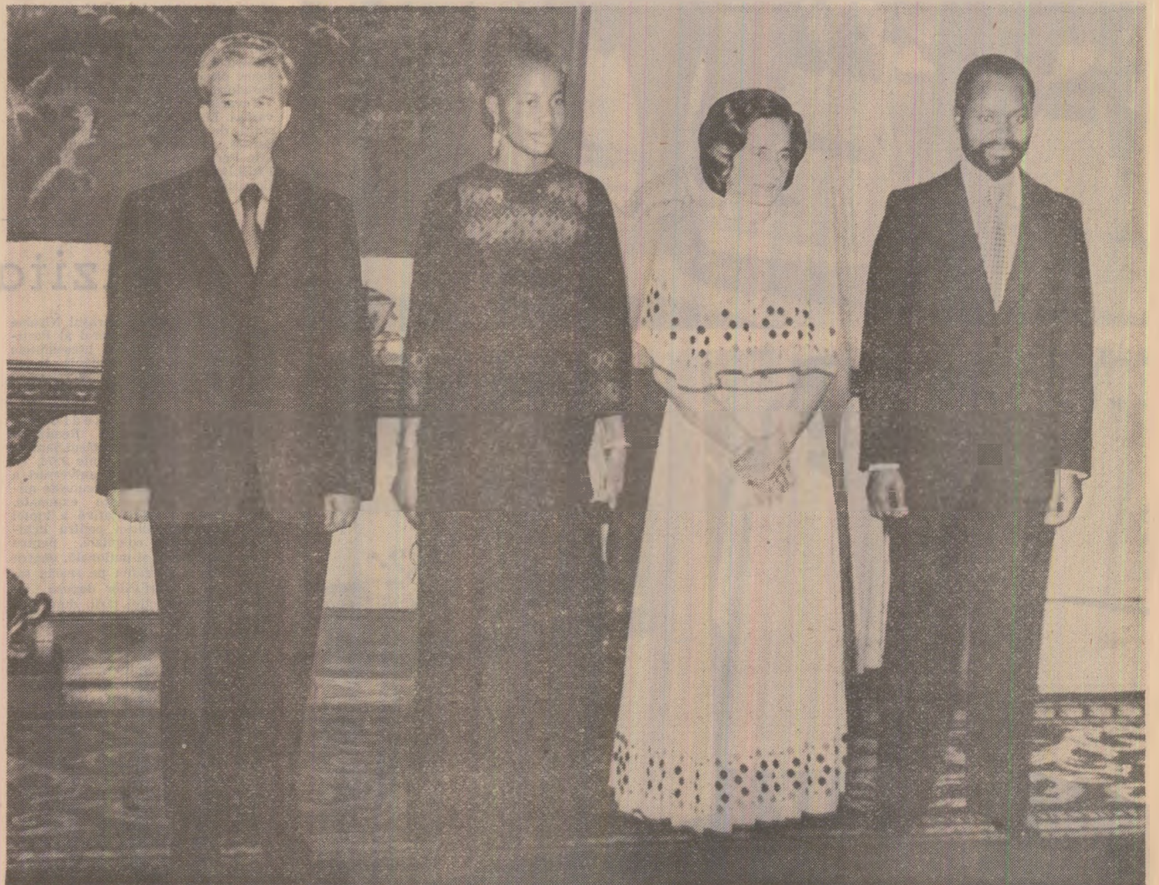
Înainte dineului oficial