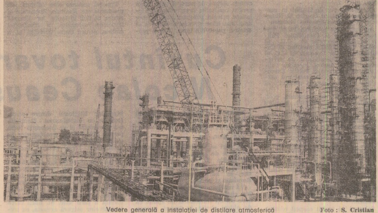
Vedere generală a instalației de distilare atmosferică