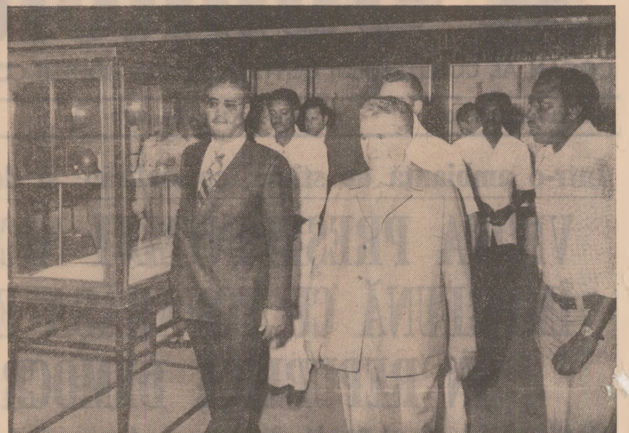
Intr-una din secțiunile Muzeului Național al Sudanului