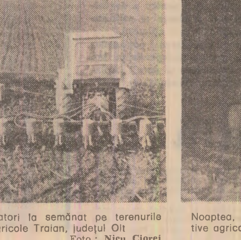
Formații de mecanizatori la semănat pe terenurile cooperative agricole Traian, județul Olt

le agroindustriale. De la Radomirești s-au trimis tractoare cu discuri și semănători la consiliul vecin Văleni. Asemenea forțe vor fi dirijate în următoarele zile și spre alte consilii agroindustriale rămase în urmă. De ce nu se realizează ritmul zilnic planificat? În ultimele zile, cînd timpul a fost favorabil, viteza de lucru la semănat a sporit. De la 4.020 hectare, cit s-a înregistrat în ziua de 22 aprilie, s-a ajuns la 12.600 hectare și, respectiv, 12.800 hectare, în zilele de 23 și 24 aprilie a.c. Cu toate acestea, nu s-a atins încă viteza zilnică planificată de 13.900 hectare. Aceasta și datorită faptului că, pe alocuri, mai ales în unitățile din nordul județului, nu se acționează cu toată hotărîrea pentru a se semăna parcelele unde solul este zvînzat. În vederea accelerării ritmului lucrărilor, comandamentul județean a luat măsuri pentru folosirea tractoa-