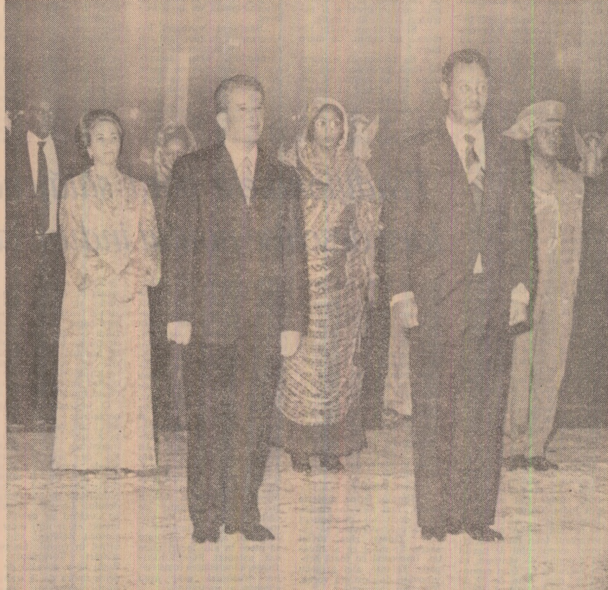
La dineul de luni seara oferit în onoarea președintelui Nicolae Ceaușescu și a tovarășei Elena Ceaușescu