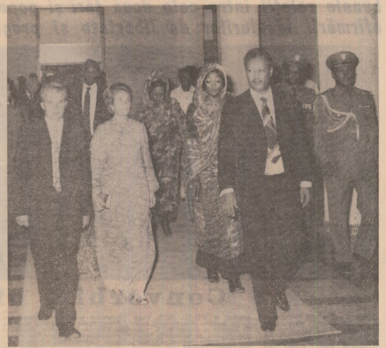
La Palatul Adunării Poporului, simbol al colaborării româno-sudaneze