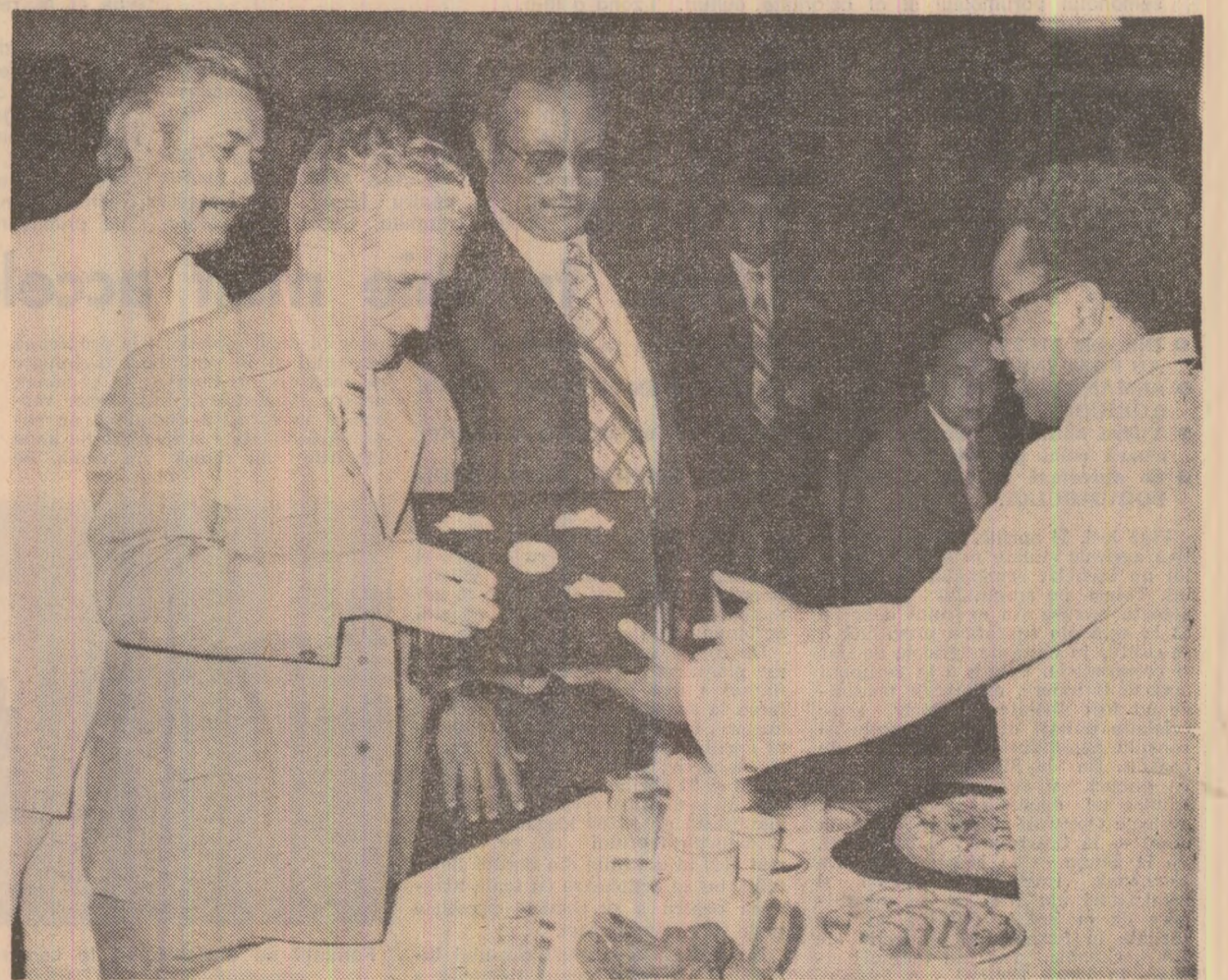
La festivitatea înminării cheii orașului Khartum