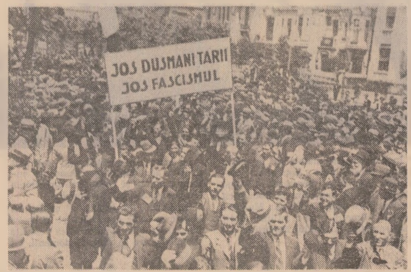
Imagine care s-a repetat de nenumărate ori în deceniul al patrulea — impresionanta mulțimi participind la demonstrațiile antifasciste