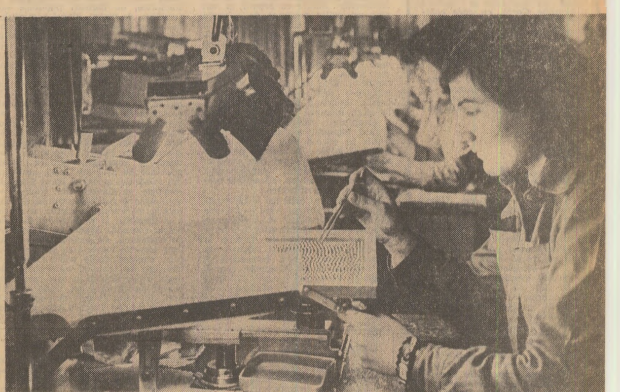
Aspect din secția bile-rola de la Întreprinderea de rulmenți Alexandria.

Ca și duminica trecută, la început de știre din județul Mehedinți în acest an, pînă la jumătatea lunii mai s-au obținut peste plan 240 milioane de kWh energie electrică, 825 tone de hule, 206 vagoane de marfă ș.a.