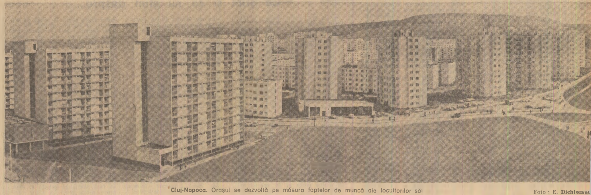
Cluj-Napoca. Orașul se dezvoltă pe măsura faptelor de muncă ale locuitorilor săi