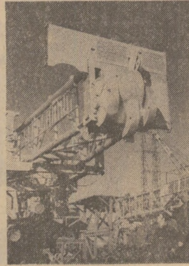
Instalația de intervenție și foraj „P 80” — în producție de serie la întreprinderea de utilități petroliere din Tirgoviste — se bucură de îndrăgite aprecieri din partea beneficiarilor.