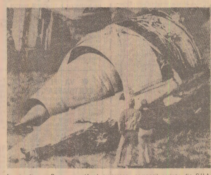
Agentia France Presse anunță că numeroase companii oriene din S.U.A., Anglia, Japonia, Suedia, Italia, Canada, Spania și alte țări au hotărât să interzică zborurile avioanelor „DC-10” pe care le au în dotare, pînă cind vor fi elucidate cauzele care au determinat tragicul accident de pe aeroportul internațional din Chicago, unde, datorită fobăgării unui astfel de aparat, și-au găsit moartea 273 de persoane. Probagura înfățișează unul din reactoarele avionului a cărui desprindere de arnă a cauzat dezastrul — cel mai grav din istoria aviației civile a Statelor Unite

intolerabilă. Perpetuarea sa constituie o amenințare reală la adresa stabilității și prosperității întregii omeniri. Această amenințare reclamă un efort hotărât de solidaritate internațională din partea tuturor statelor pentru a contribui la întărirea înfrustrării activității științifice ale țărilor în curs de dezvoltare.” Cu convingerea că lichidarea stării de subdezvoltare depline de întărirea capacităților lor tehnico-științifice, țările în curs de dezvoltare au propus în prezent statelor în fost de acord, ca primul capitol al Programului de acțiune să fie intitulat: „Întărirea capacităților tehnico-științifice ale țărilor în curs de dezvoltare”. Acest capitol conține recomandări adresate țărilor în curs de dezvoltare, care pornesc de la considerentul că lor le revine responsabilitatea primordială pentru creșterea și dezvoltarea capacităților lor tehnico-științifice. În esență, aceste recomandări se referă la: elaborarea de către țările în curs de dezvoltare de politici naționale pentru știință și tehnologie, corespunzătoare priorităților lor de dezvoltare economică și socială; creșterea de organe guvernamentale (consilii sau comitete naționale) pentru știință și tehnologie; înființarea de institute sau cen-