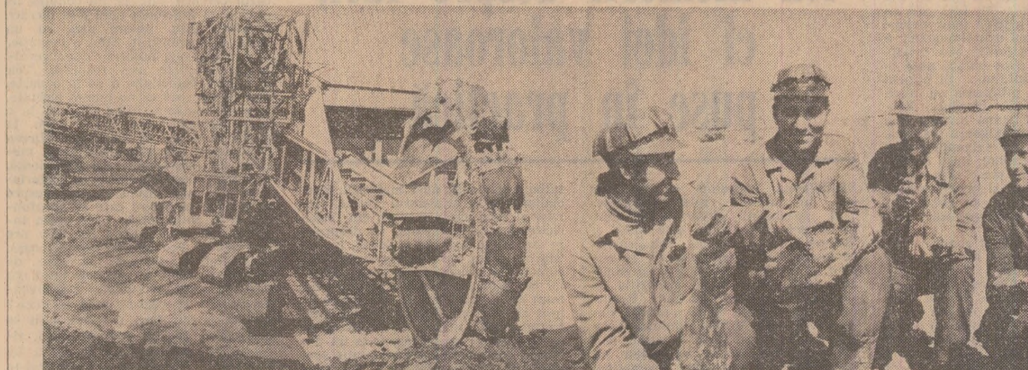
Date „la zi“ despre mersul bătăliei pentru mai mult cărbune IN PAGINA A III-A