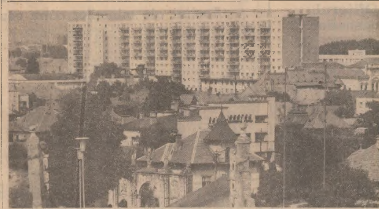
Alba Iulia — vedere de pe cetate

publica Socialistă România, în luna octombrie 1979, în calitate de reprezentant al Maiestății Sale Hirohito, împăratul Japoniei.