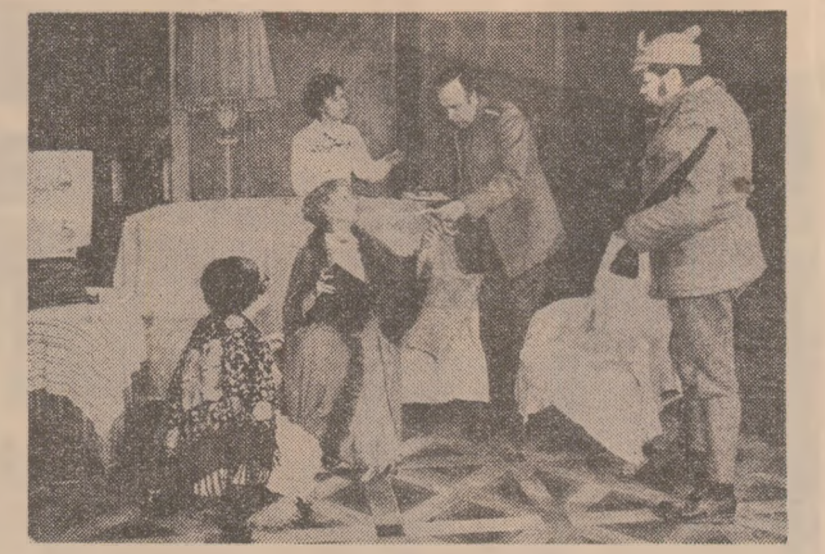
Scenă din spectacolul Teatrului Național din Craiova cu piesa „Seară de taină”