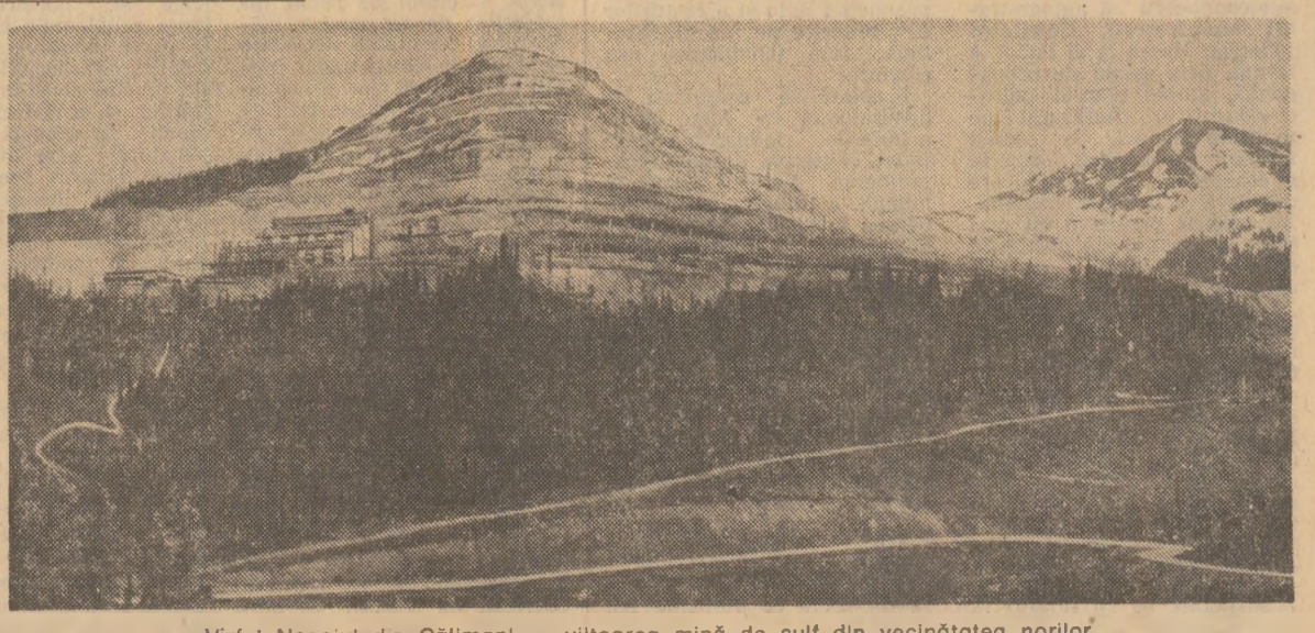
Virful Negoiului din Călimani — viltoreea mină de sulf din vecinătatea norilor

Nivelele recoltelor depinde în măsură hotărîtoare și de calitatea semănăturii. Important este ca, imediat după eliberarea terenului de paie, să se facă arături, astfel încît pierderile de umiditate din sol să fie minime. Recoltarea fără întirzire a orzului, eliberarea imediată a terenului, realizarea integrală și chiar depășirea planului de însămînșare a culturilor succesive trebuie să se preocupe în aceste zile în cea mai mare măsură direcțiile agricole, consiliile unice agroindustriale și conducerea unităților agricole. Obținerea a două culturi pe același teren va asigura un spor însemnat de produse agricole. Organele și organizațiile de partid au datorat să mobilizeze pe mecanizatorii și cooperatorii la executarea în flux continuu a lucrărilor agricole și să evită, aceasta ducînd deopotrivă la evitarea pierderilor la culturile care se string acum, cât și la obținerea unor cantități suplimentare de porumb boabe, legume și furaje.