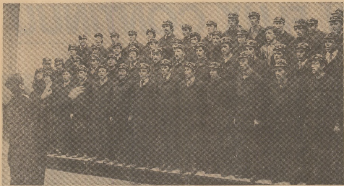
Corul minierilor de la Motru, un ansamblu artistic bine apreciat în Festivalul național „Cîntarea României“