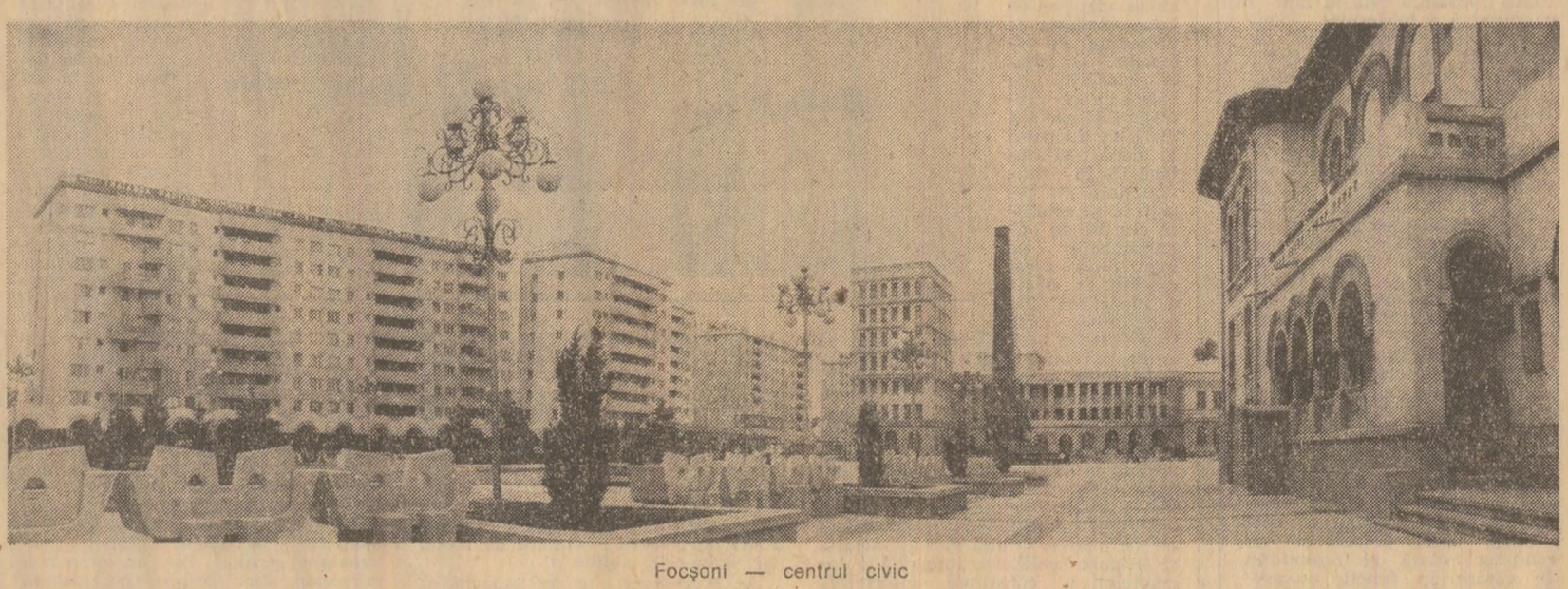
Focșani — centrul civic