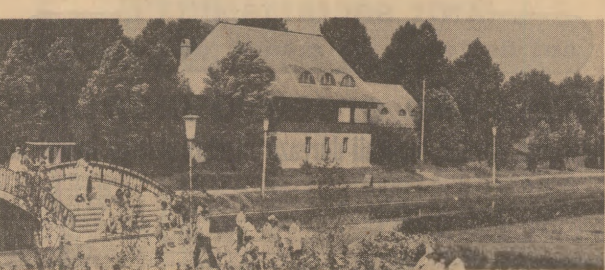
In satul de vacanță din Constanța, o prezență ușor remarcată are casa „Apulum” din județul Alba

Vizitînd magazinele comerțului de stat, cumpărătorii au posibilitatea să-și procure obiectele necesare unei agreabile drumetii. La munte sau la mare, pentru o cîmă confortabilă petrecere a zilelor de vacanță, sînt necesare unele obiecte de strictă necesitate. Ele se găsesc în magazinele și raioanele specializate ale comerțului de stat. Aici există un bogat sortiment de articole pentru sport și turism; termosuri (prețul între 25 și 108 lei); cutii turistice pentru alimente; spirtieră de voiaj (prețul 14 lei); lămpă camping tip „Lucaș-făruș”; saci de dormit (prețul între 181 și 522 lei); sacii de pînă (prețul între 23,50 și 415 lei); corturi tip Alpin, Dacia și Litoral, pentru 2, 3 sau patru persoane (prețul între 900 și 3.094 lei); mobilier pentru camping; paturi, scheme mesoplate (prețul între 49 și 300 lei).