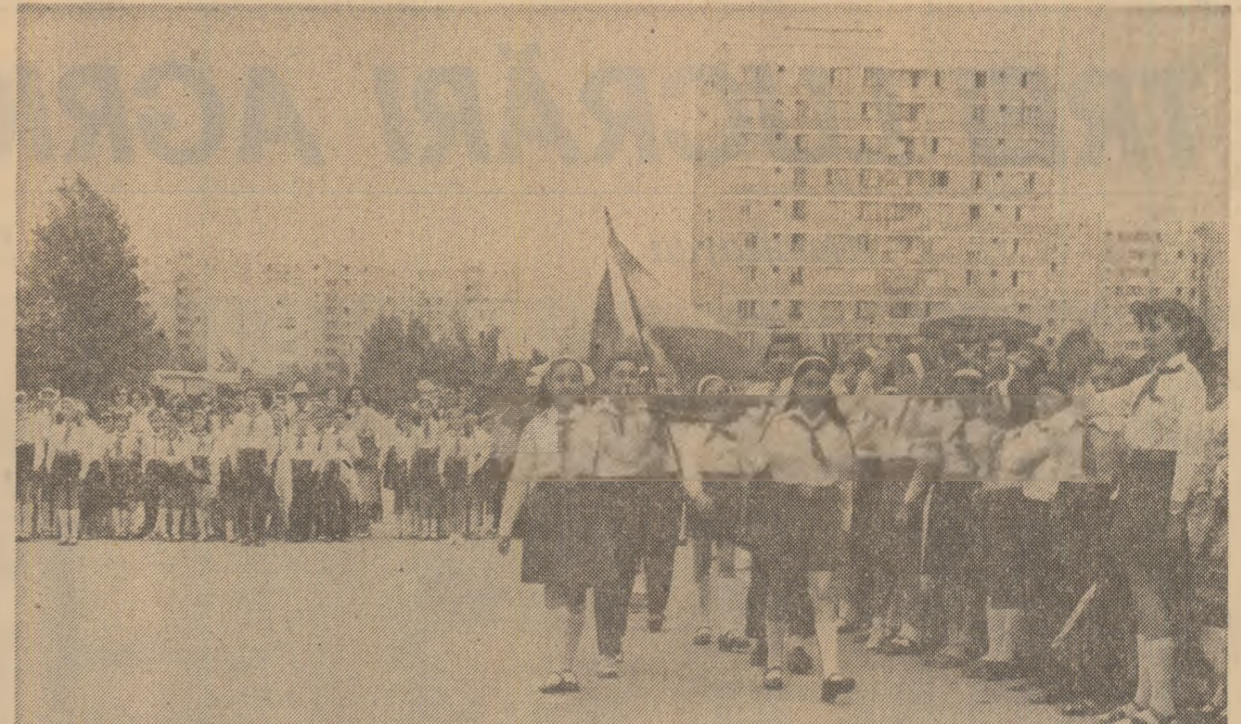
leri au avut loc tradiționalele serbări școlare de sfîrșit de an, prilej de satisfacții și bucurii pentru rezultatele bune obținute la învățătură și în activitatea practic-productivă. În fotografie: aspect din timpul serbării de la Școala generală nr. 204 din cartierul bucureștean „Drumul Taberei“

Marti dimineața, purtătorii cravatei roșii cu tricolor din întreaga țară au trăit din nou momente solemne ale ceremonialului pionieresc, momente prilejuate de împlinirea a 30 de ani de la crearea primelor detașamente de pionieri din România. Evenimentul marcat prin adunări pionieresti, a fost întregit de tradiționalele serbări școlare care au încheiat anul de învățămînt 1978-1979. După cuvîntul de bilanț, rostit de directorii școlilor, comandanții-instructori pe unitate au prezentat principalele realizări obținute în acest an școlar în activitatea pionierescă. Au luat, de asemenea, cuvîntul pionierii frunțiși la învățătură și în activitatea obișnuită, precum și reprezentanți ai părinților. În acest cadru, s-au înmînat apoi celor mai merițuoși dintre elevii primelor școlare - recunoaștere a bunelor rezultate obținute de-a lungul unui an întreg de rodnică eforturi - medalia „Meritul pionieresc“ și titlul de „Pionier de frunte“. În încheierea manifestărilor au fost organizate variate și atractive acțiuni cu caracter cultural-artistic, sportiv-turistic și distractiv, desfășurate sub emblema Anului internațional al copilului. (Agerpres).