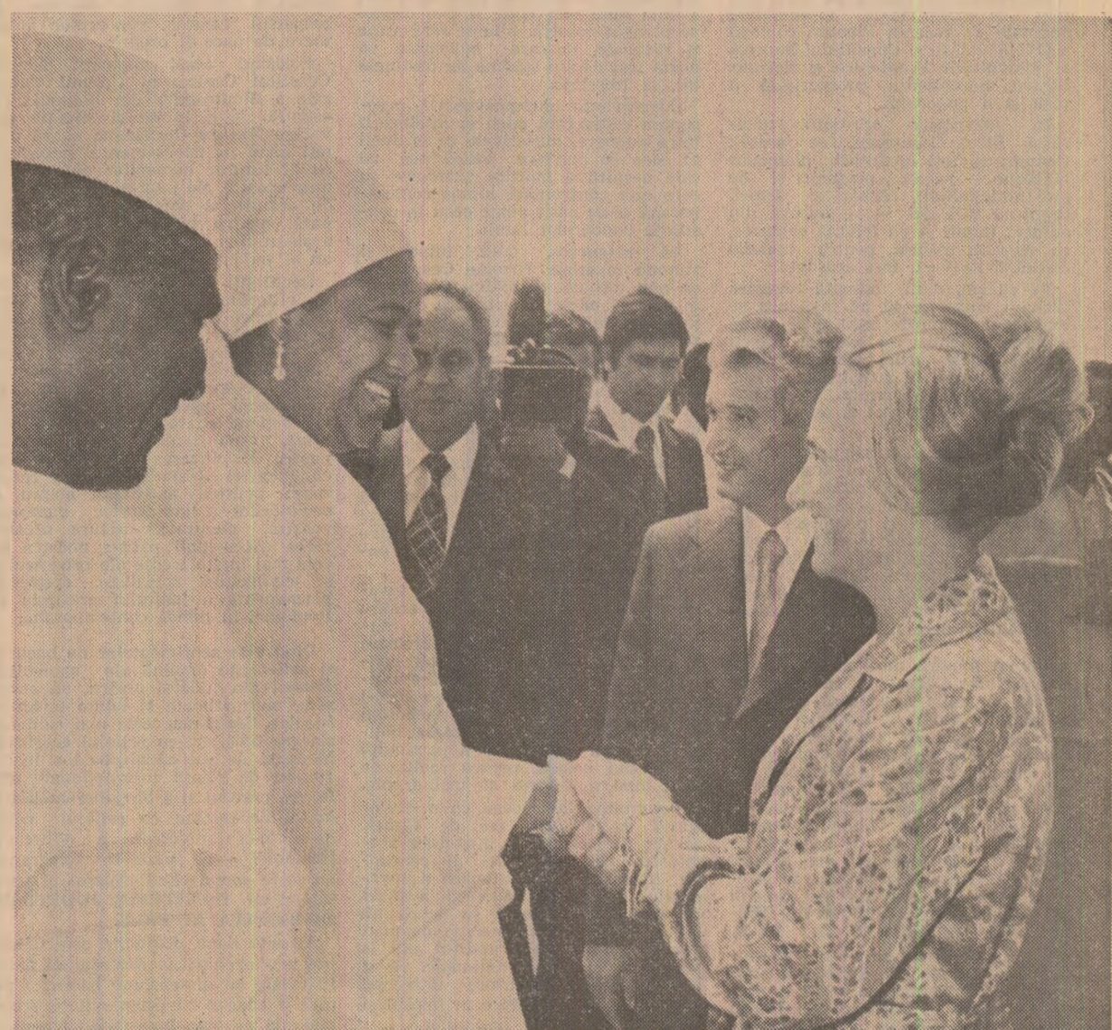
Tovarășă Elena Ceaușescu și tovarășă Andrée Touré își string cordial minile

„Semnind în cartea de onoare a muzeului, tovarășa Andrée Touré și-a exprimat deosebita satisfacție pentru prilejul de a cunoaște nemijlocit aceste valorose măturii ale istoriei, culturii și civilizației poporului român.