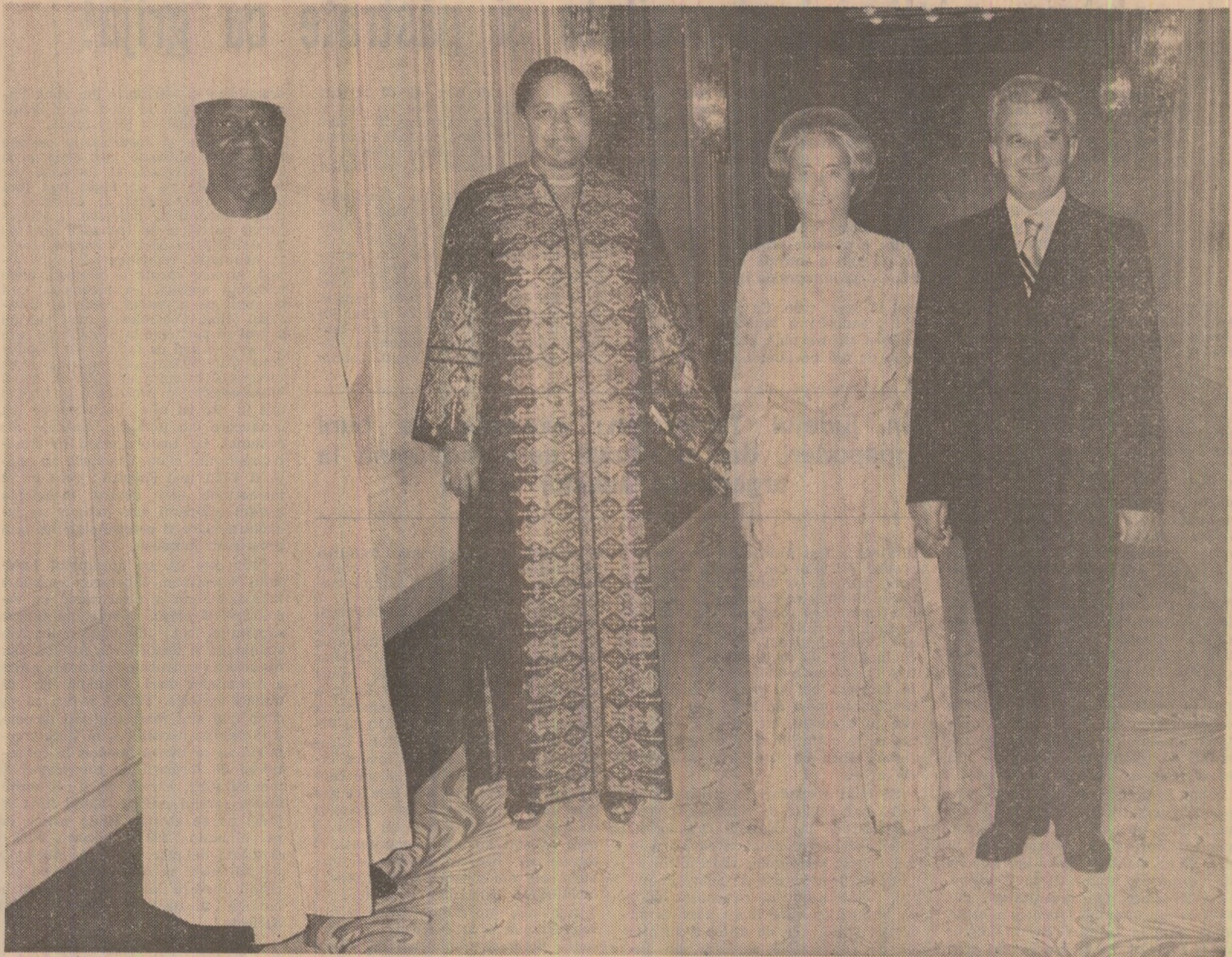
La dineul oficial