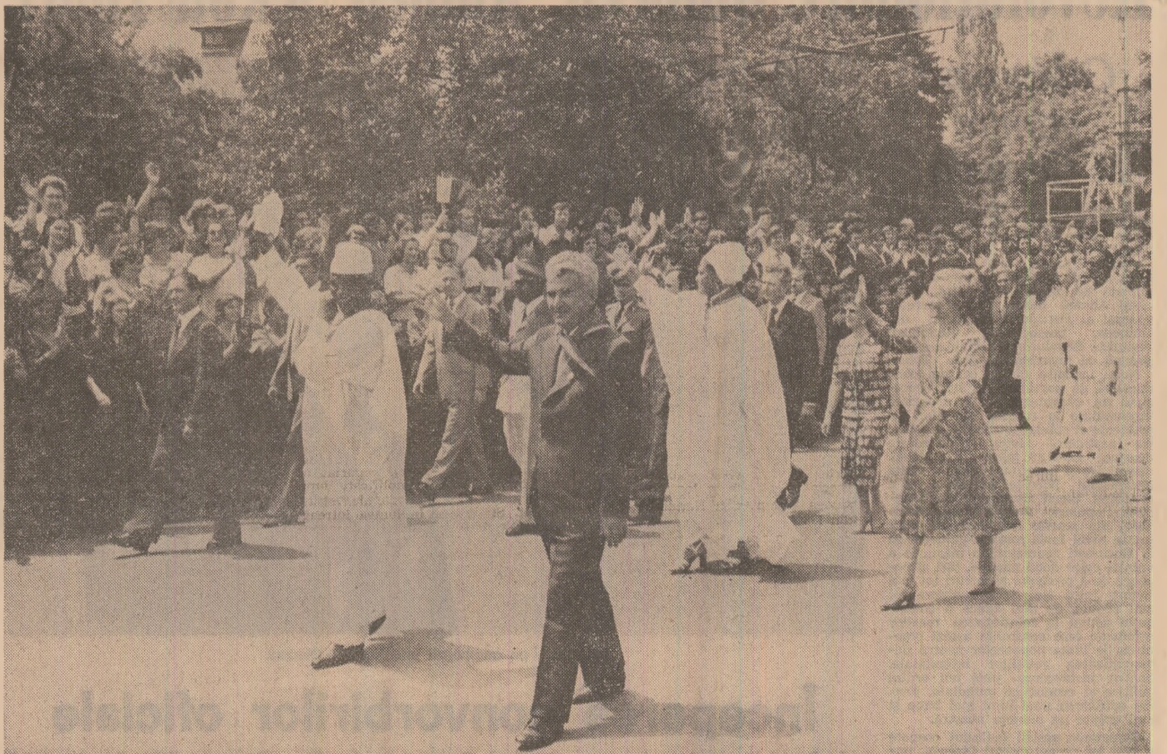
În mijlocul locuitorilor Capitalei, răspund manifestărilor de căldă prietenie și înaltă prețuire

La Palatul Primăverii, conducătorii de partid și de stat ai României și Guineei, tovarășii Elena Ceaușescu și tovarășa Andrée Touré s-au întretinut cordial, prietenești.