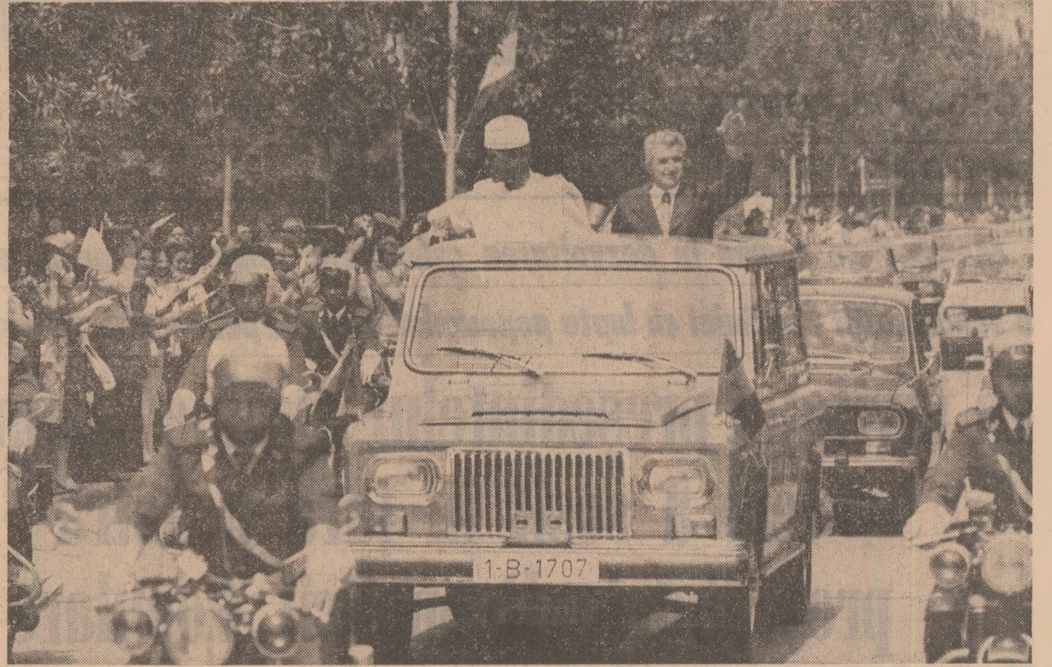
Mii de bucușteni ovaționează pe cei doi conducători de partid și de stat