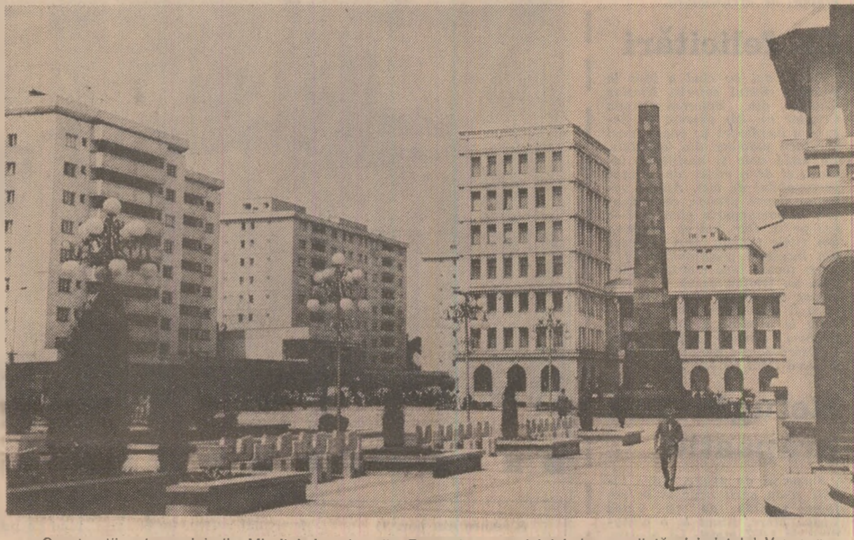
Construcții noi pe plaiurile Miorței. Imagine din Focșani — municipiul de reședință al județului Vrancea