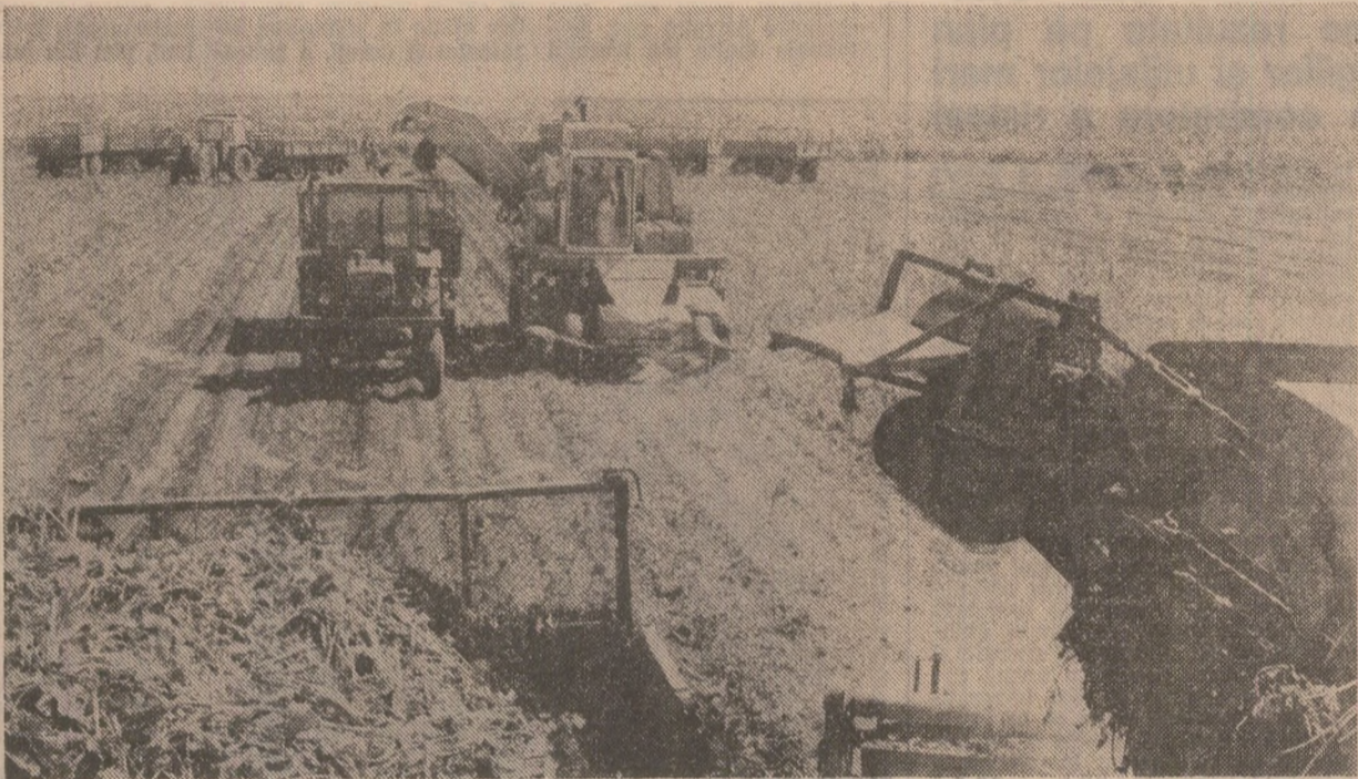
Mijloace mecanizate la recoltarea sfeclei de zahăr la cooperativa agricolă „Gheorghe Doja”, județul Ialomița