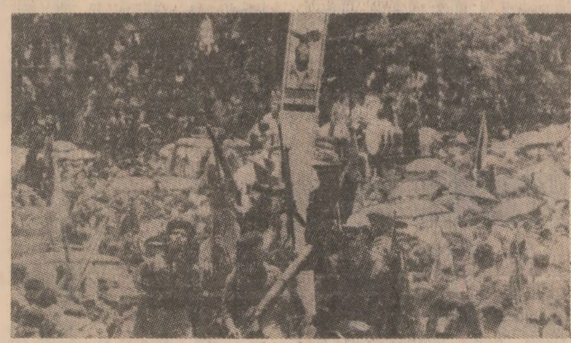
Piața Revoluției din Hanoi. 150.000 de cetățeni au luat parte la o mare demonstrație, manifestîndu-și bucuria pentru instalarea Guvernului de Reconstrucție Națională în capitala Nicaraguii.

Jo — informează agenția MEN — forțele israeliene au continuat bombardamentele asupra localității Baalbek, provocînd importante pagube materiale.